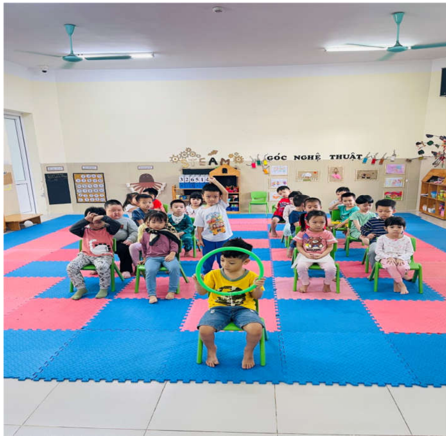
Giáo dục trẻ an toàn giao thông