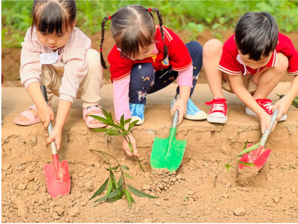
Giáo dục trẻ bảo vệ môi trường