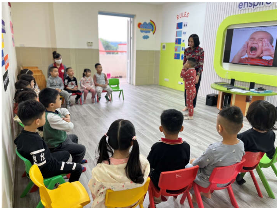
Giáo dục trẻ phòng chống bắt cóc