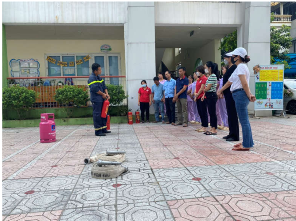
Giáo dục tuyên truyền phòng chống cháy nổ, tai nạn thương tích