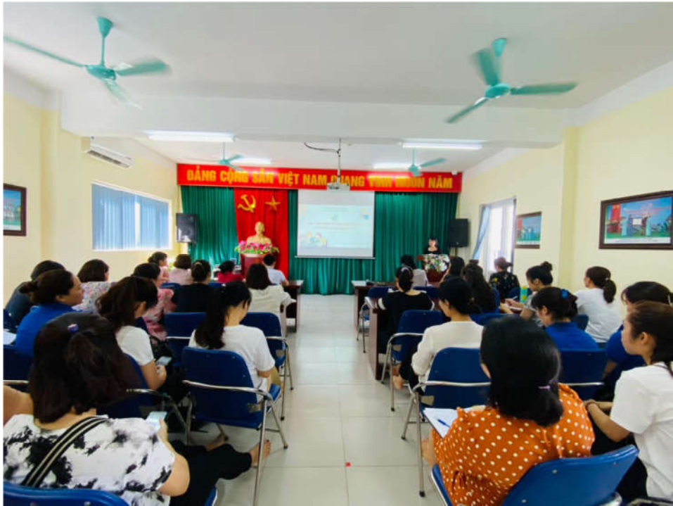
Tuyên truyền tại các cuộc họp của nhà trường