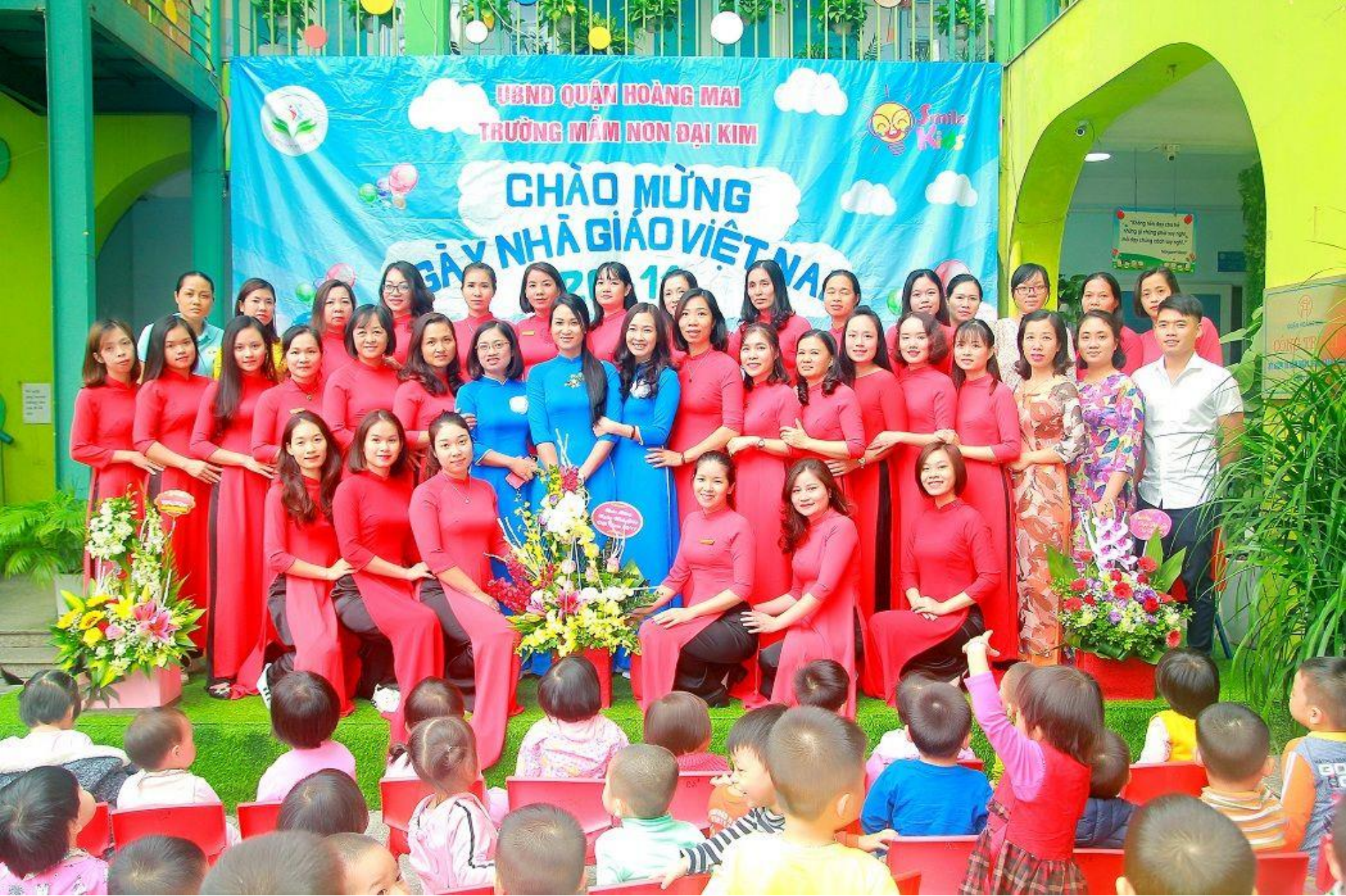
Các thầy cô giáo chụp ảnh kỷ yếu