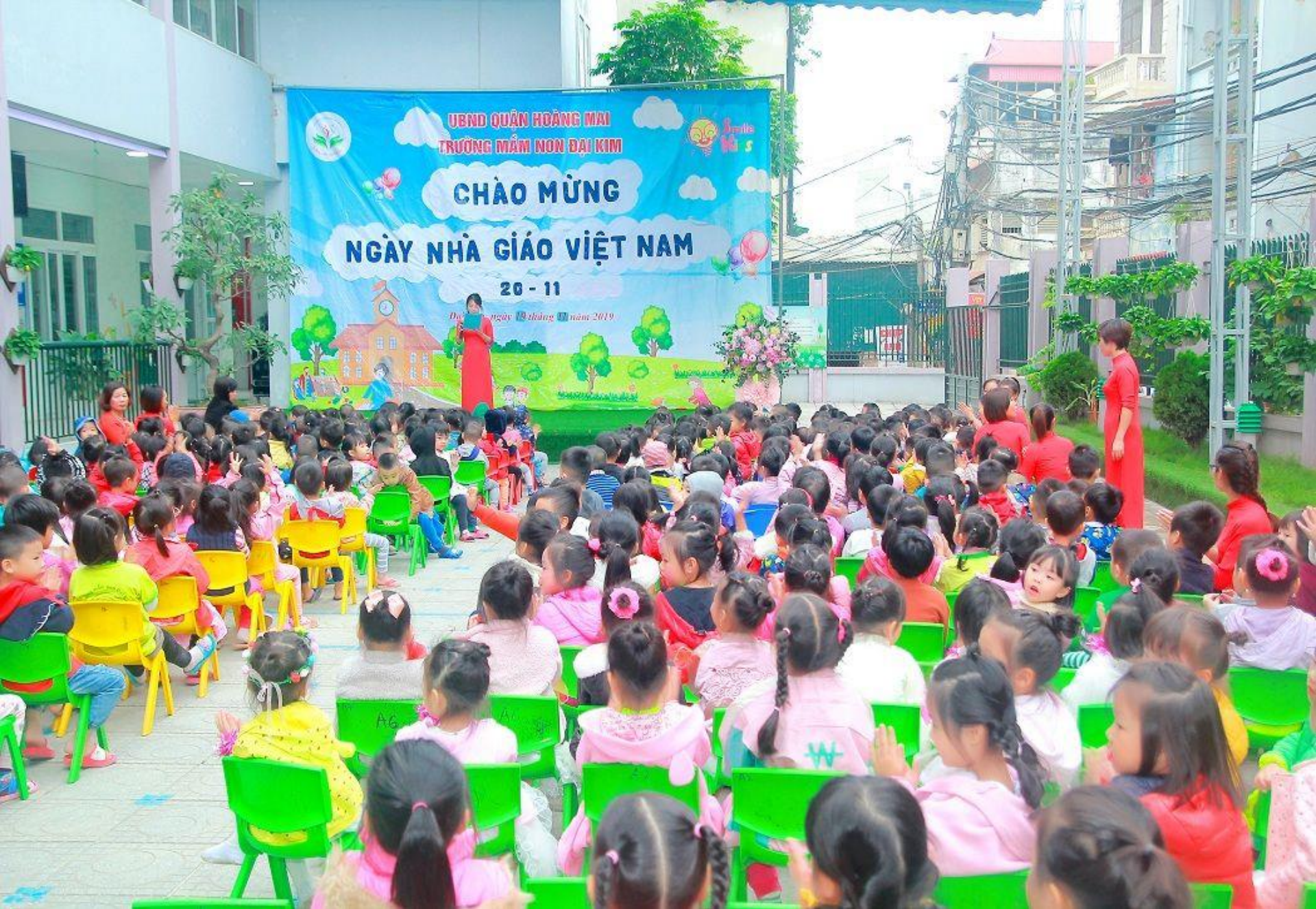
Cô và trẻ dự lễ mít ting chào mừng ngày 20/11