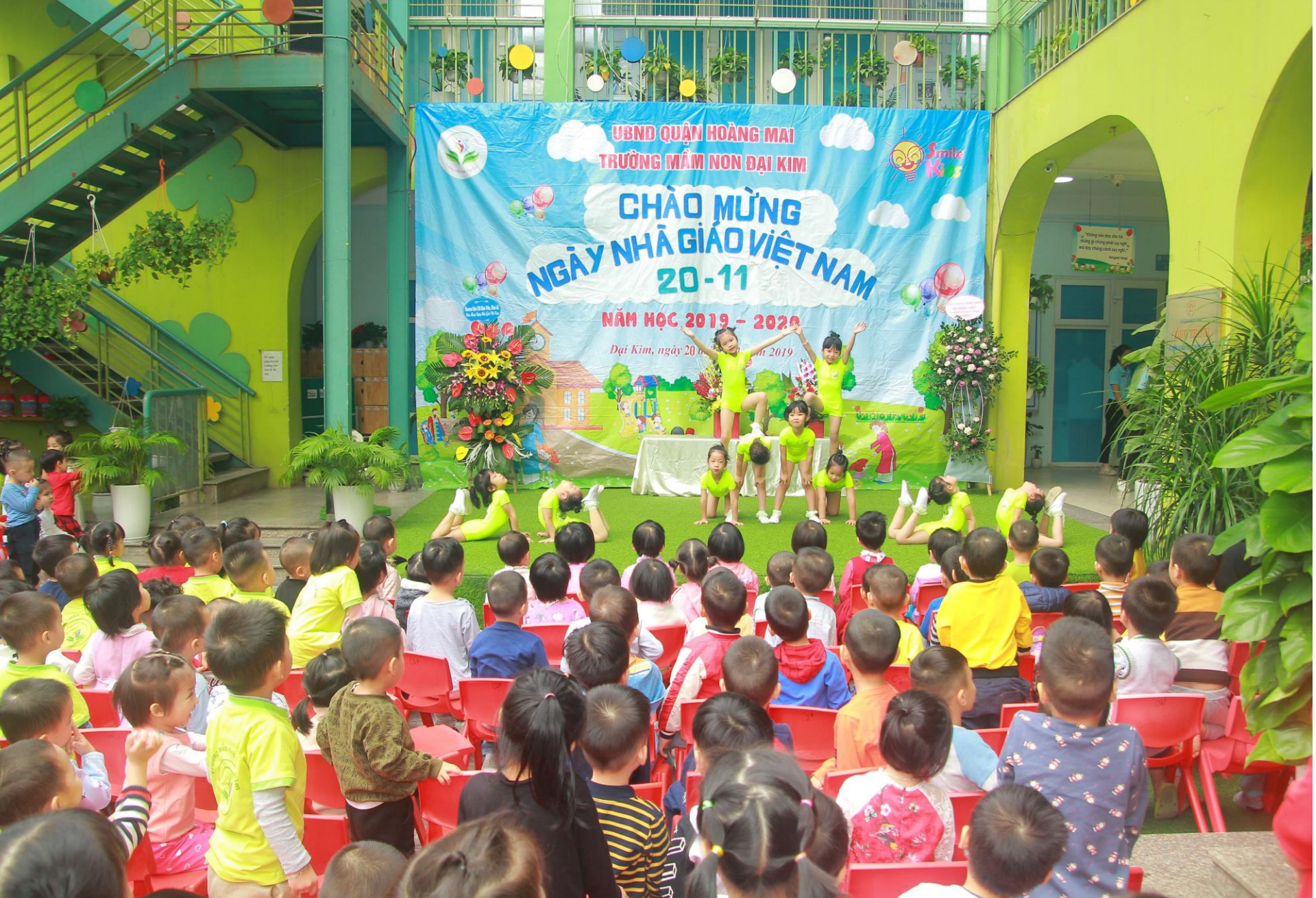
Các bạn lên biểu diễn văn nghệ chào mừng ngày 20/11