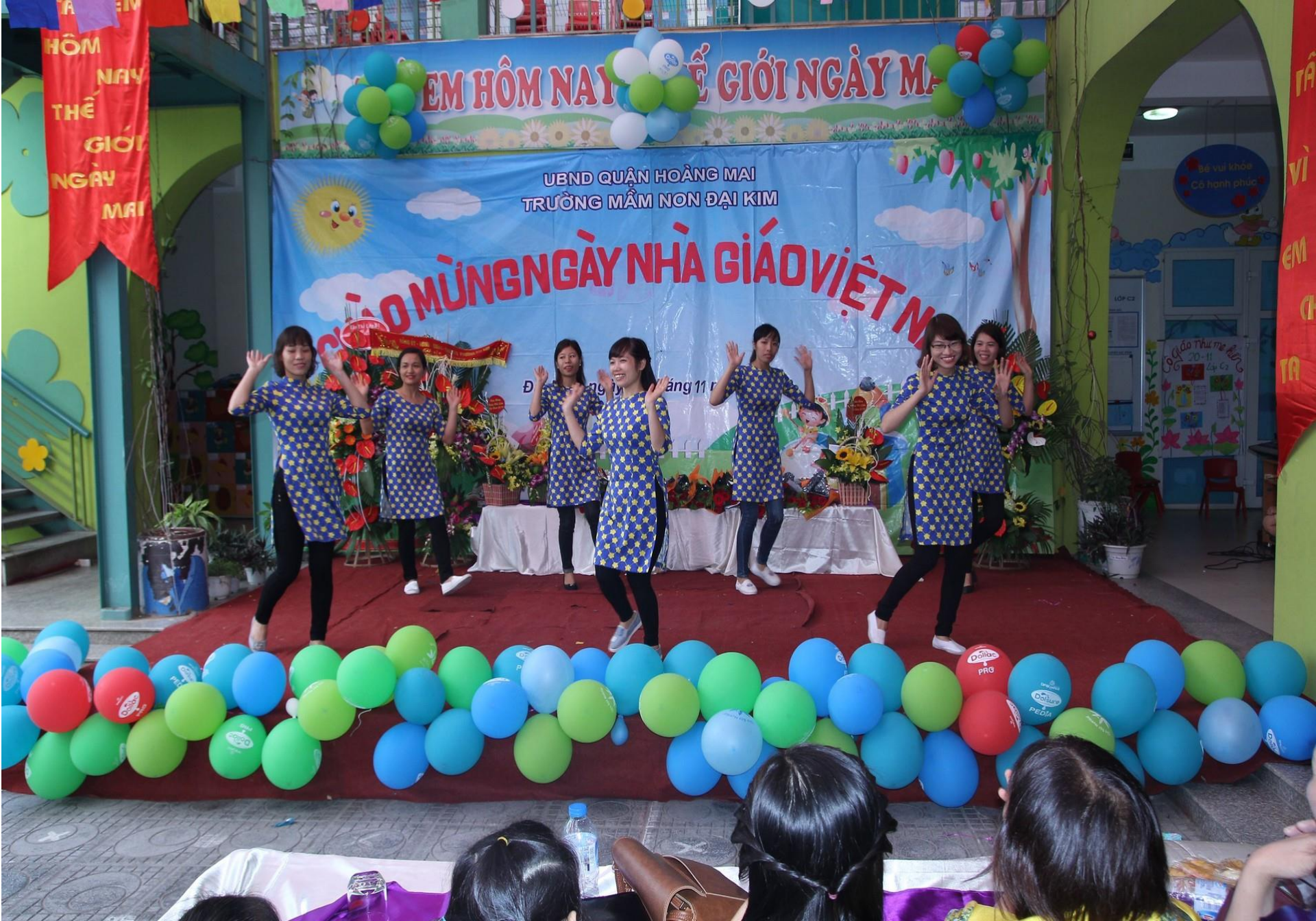
Các cô giáo biểu diễn văn nghệ