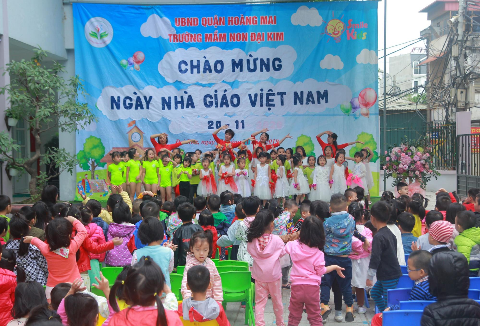
Cô và trẻ cùng hát