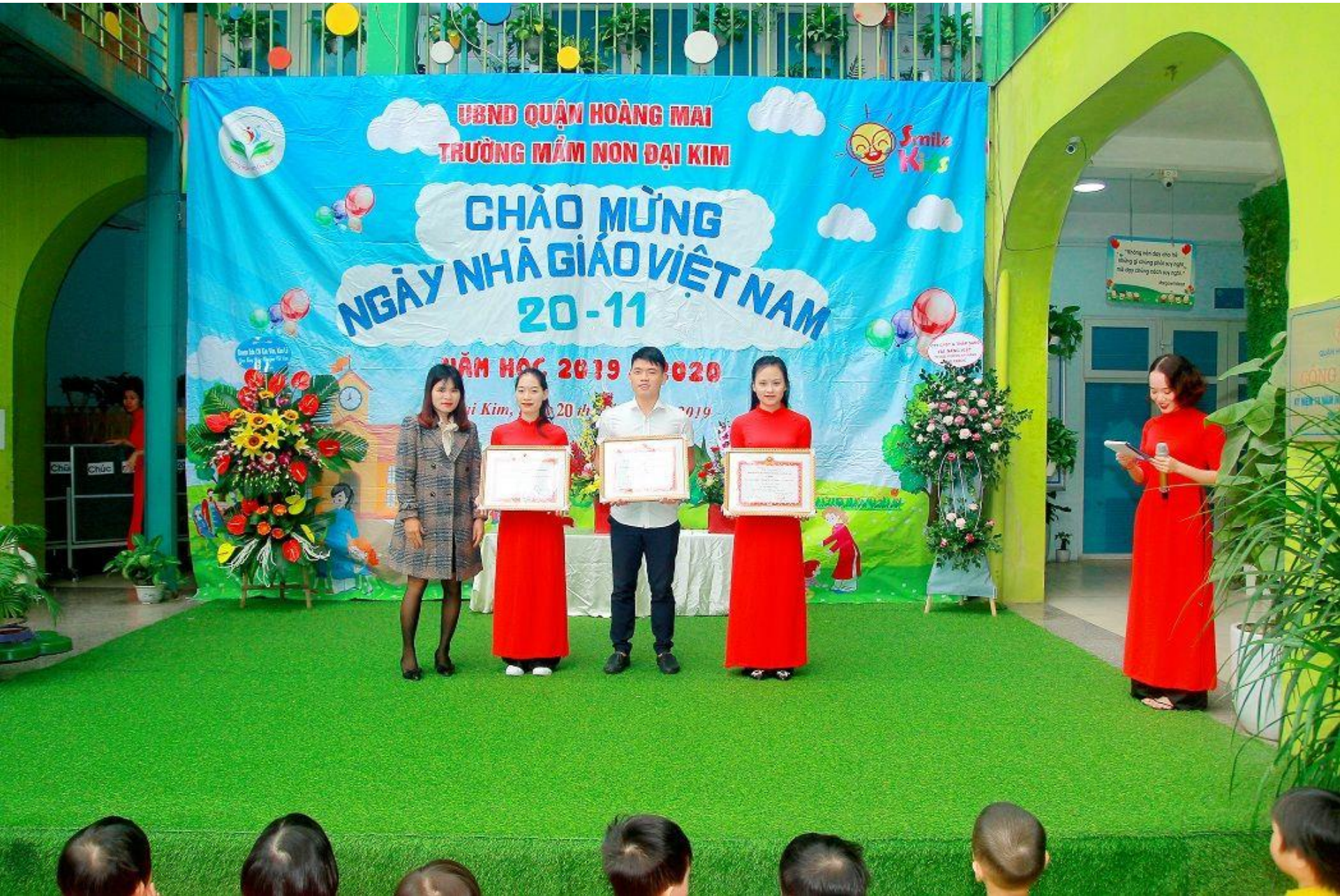
Vinh danh các thầy cô giáo có thành tích tốt trong công việc