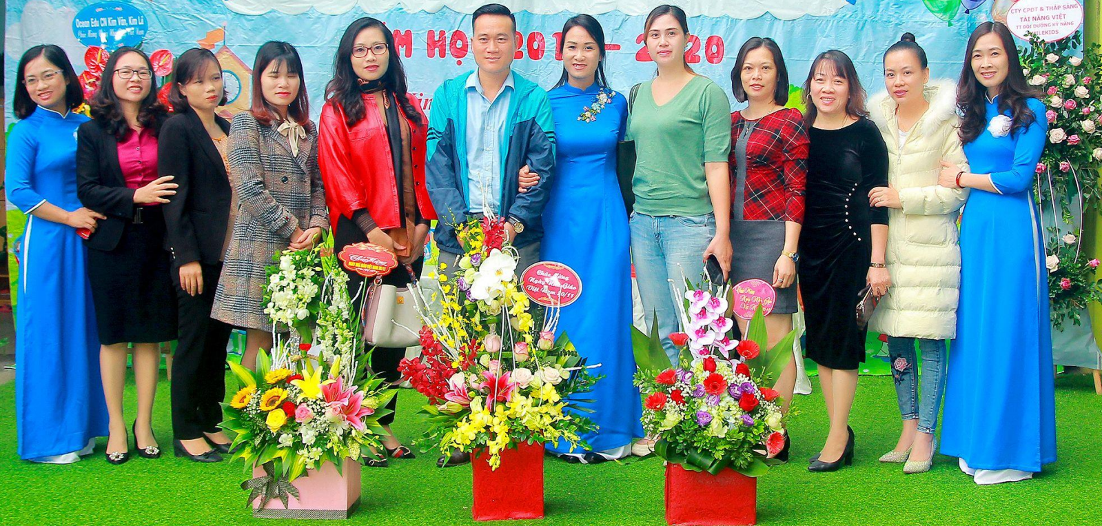
Ban phụ huynh trường lên tặng hoa nhân ngày 20/11