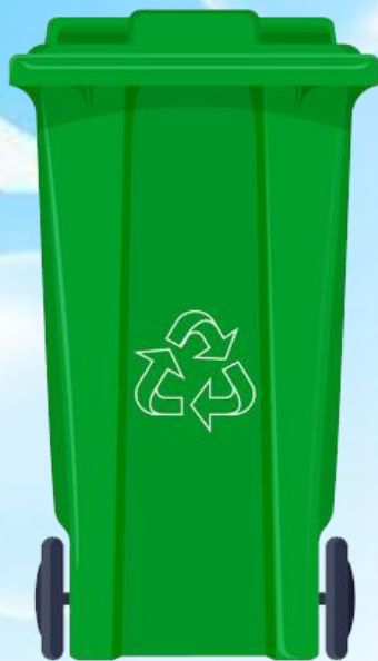
Rác hữu cơ