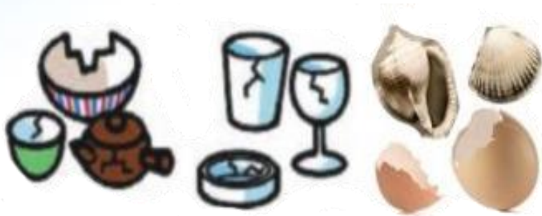
Đồ gốm, sứ, thủy tinh, vỏ sò, vỏ trứng...