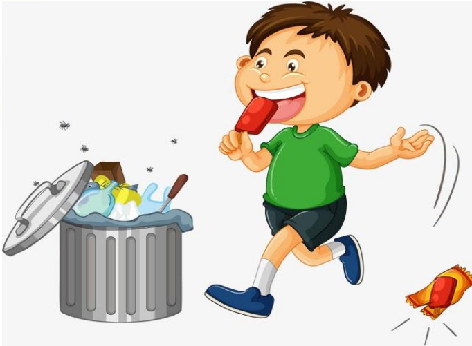
1. Vứt rác bừa bãi