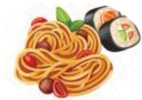
2. Thức ăn thừa