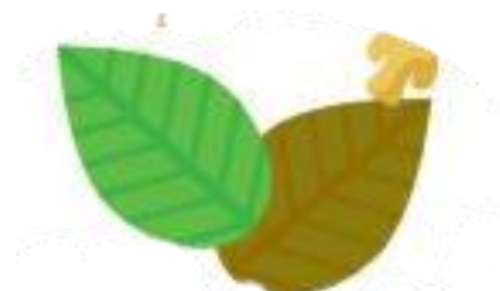
5. Lá cây, cỏ, rơm...