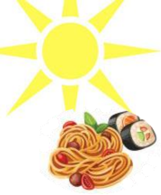
1. Thức ăn thừa