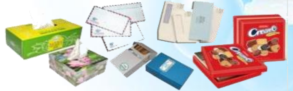
Hộp giấy, bì thư, bưu thiếp, vỏ bao thuốc lá...