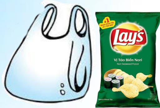
Vỏ bimbim, vỏ kẹo bánh, túi nilong các loại...