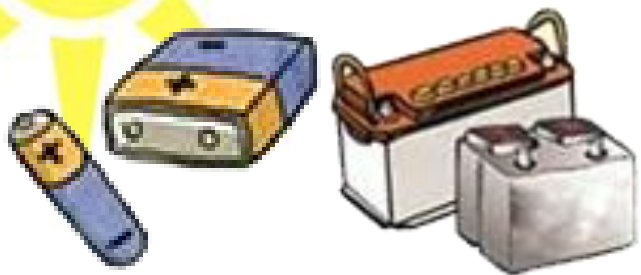
1. Pin, acquy đã qua sử dụng...