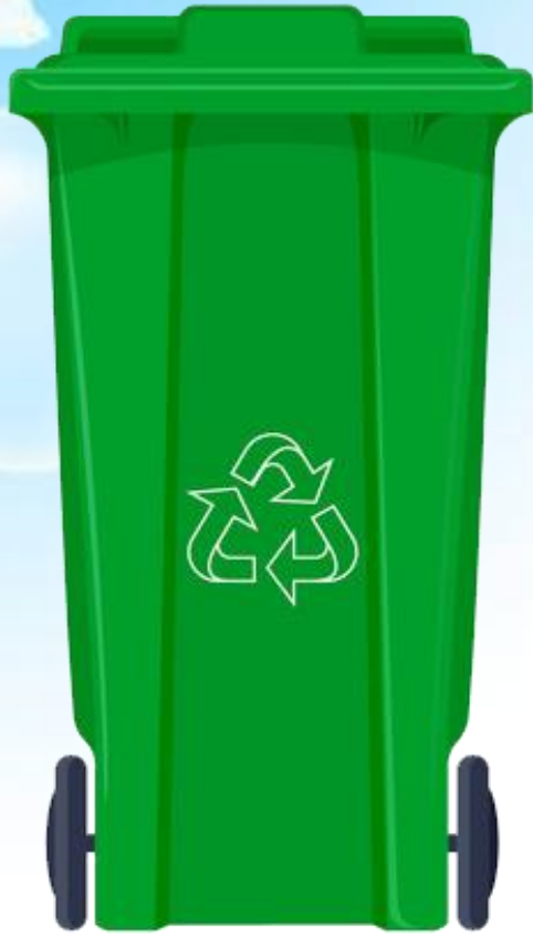
Rác hữu cơ