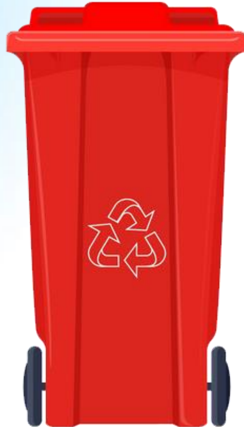
Rác vô cơ