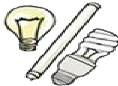
2. Bóng đèn cũ, hỏng...