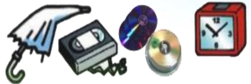
Ô, đồng hồ, băng video, đĩa CD...