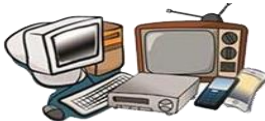
4. Tivi, máy tính, điều khiển cũ, hỏng...