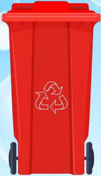
Rác vô cơ