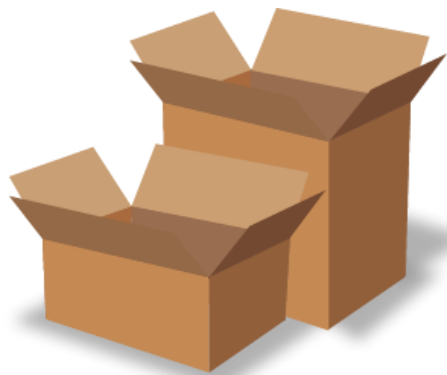
1. Thùng carton