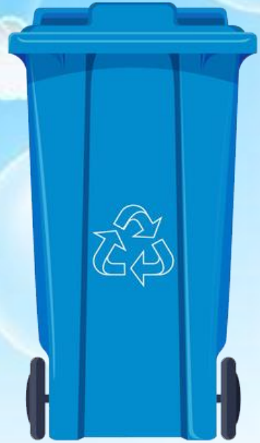
Rác tái chế

➔ Nhóm chất thải có khả năng tái sử dụng: