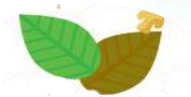
Lá cây, cỏ, rơm...