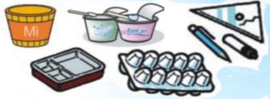
Hộp, vỉ đựng trứng, vỏ hộp cơm, kem, văn phòng phẩm...