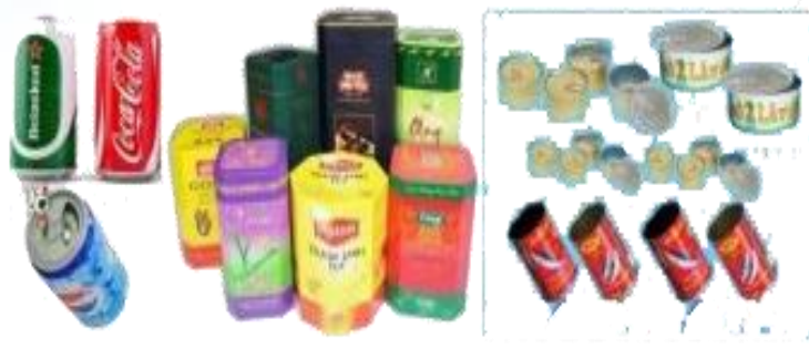
Các loại vỏ lon, hộp đựng trà...