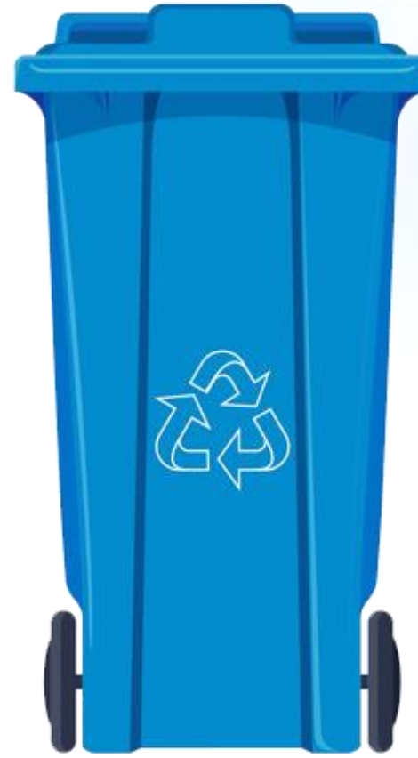
Rác tái chế