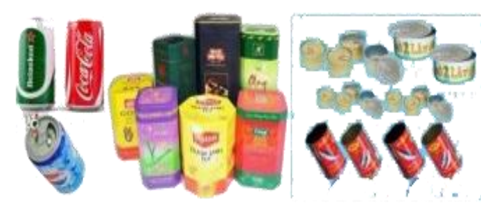
4. Các loại vỏ lon, hộp đựng trà...