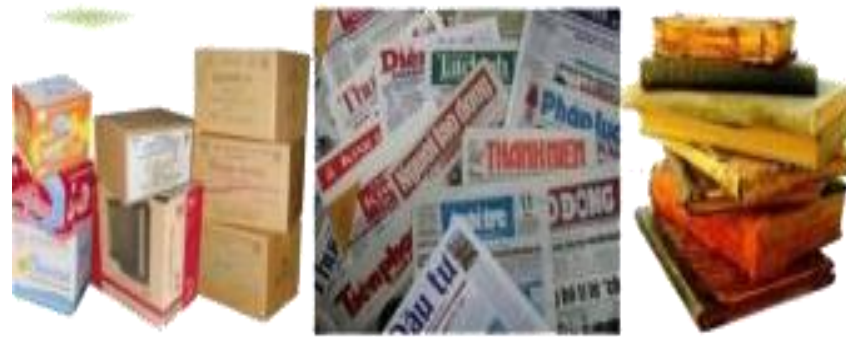
2. Thùng carton, sách báo cũ...