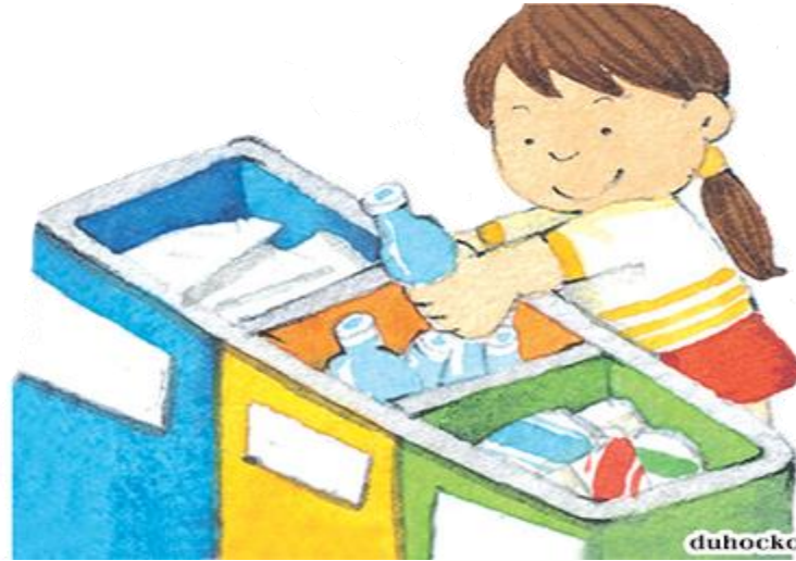
2. Phân loại rác đúng cách