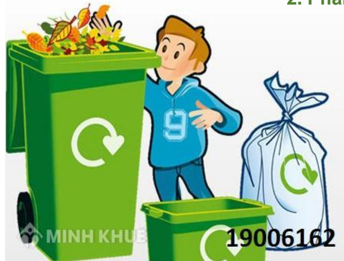
3. Đổ rác đúng nơi quy định