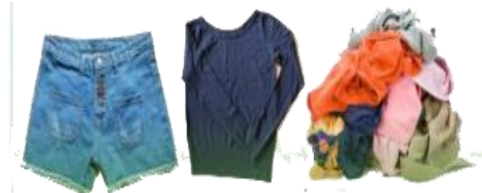
6. Các loại vải, quần áo cũ...