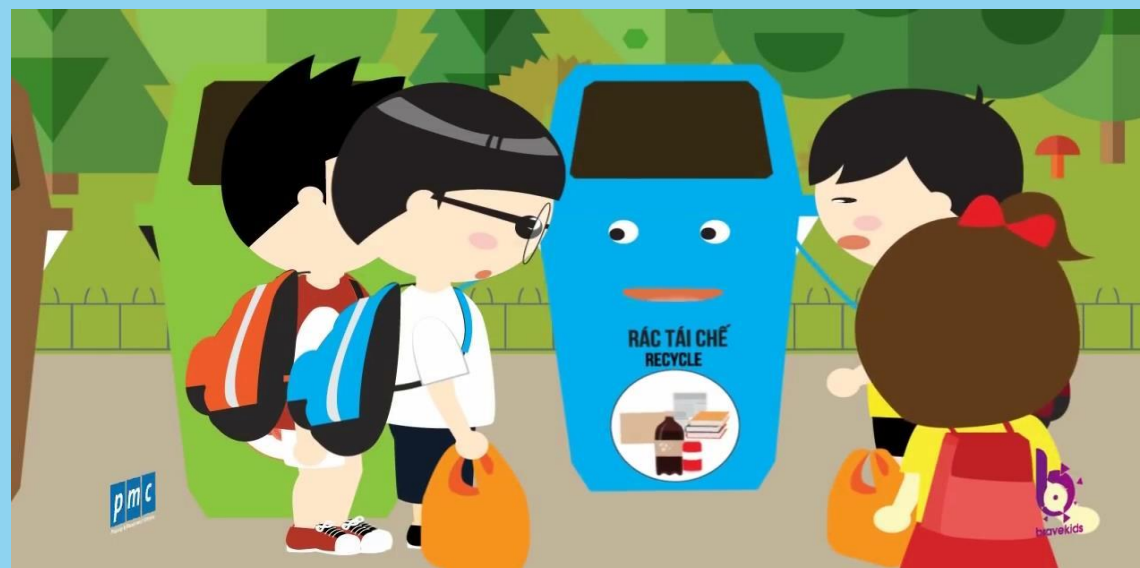
Thùng rác tái chế