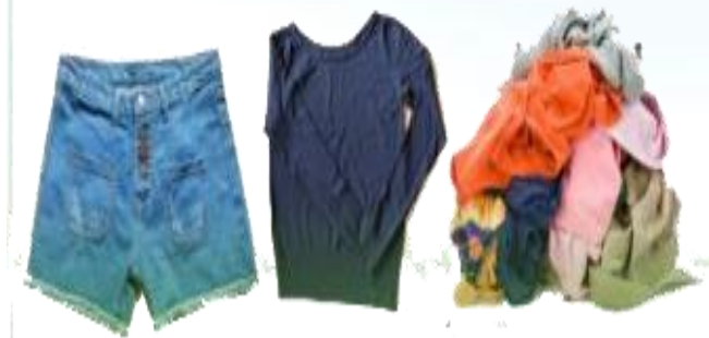
Các loại vải, quần áo cũ...