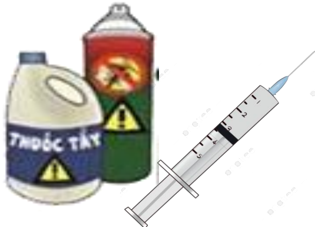
3. Thuốc tẩy, bình xịt côn trùng, kim tiêm đã sử dụng