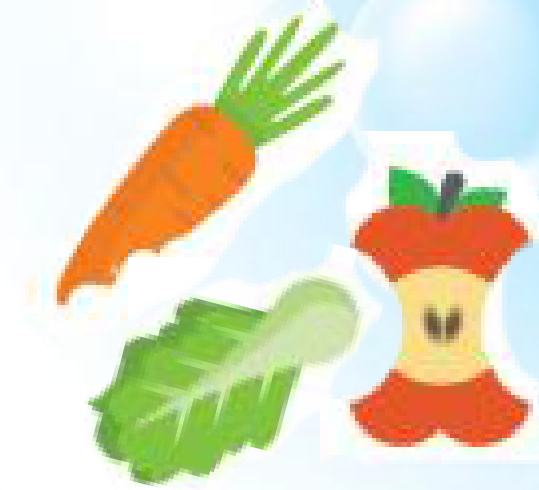
Rau, củ, quả thừa, hỏng