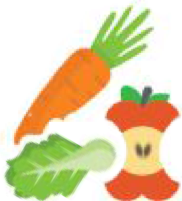
3. Rau, củ, quả thừa, hỏng