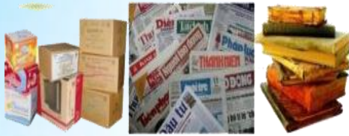
Thùng carton, sách báo cũ...

Xử lý: Tái sử dụng hoặc tái chế thành vật dụng khác