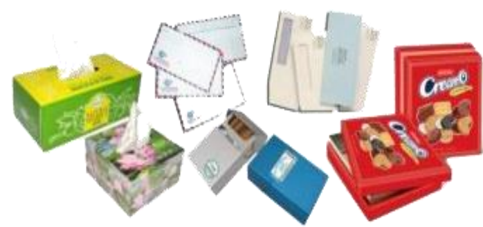
3. Hộp giấy, bì thư, bưu thiếp, vỏ bao thuốc lá...