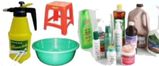
Các loại đồ nhựa, chai nhựa, bình xịt...