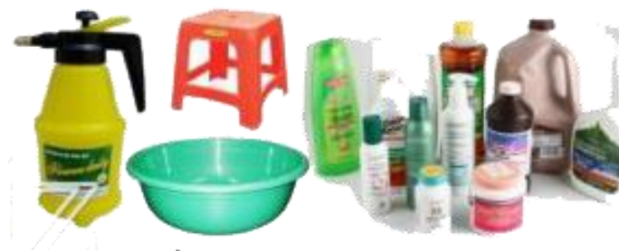
5. Các loại đồ nhựa, chai nhựa, bình xịt...