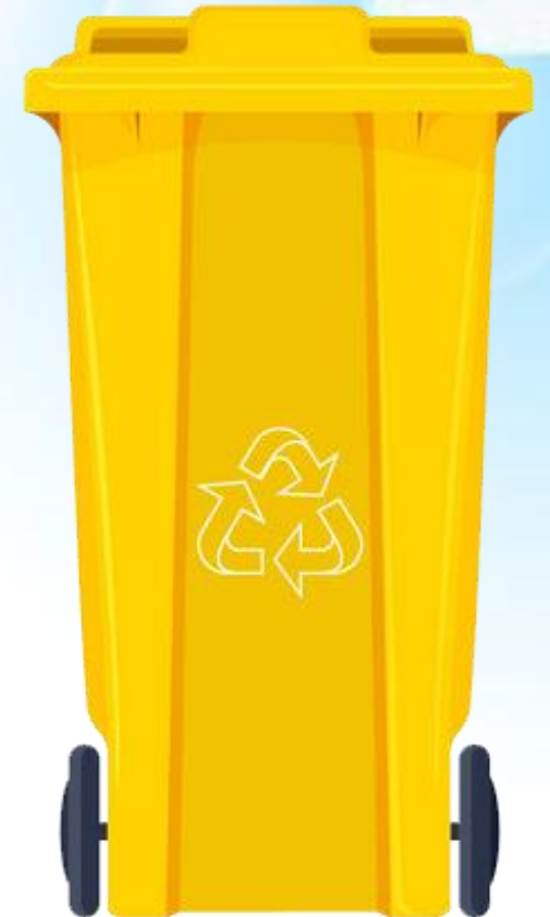
Rác thải nguy hại