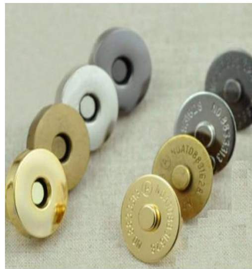
NAM CHÂM KHUY