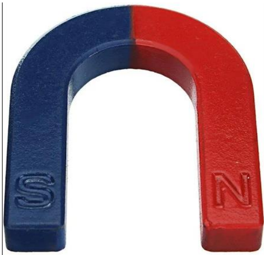
NAM CHÂM CHỮ U