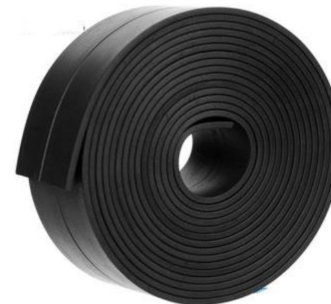
NAM CHÂM DẼO