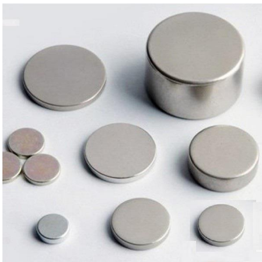
NAM CHÂM TRẮNG