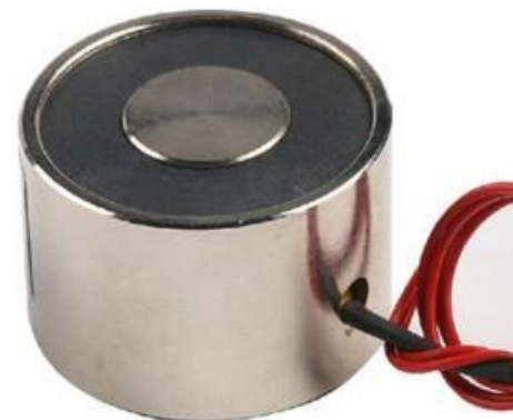
NAM CHÂM ĐIỆN