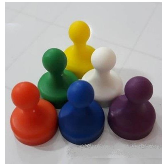
NAM CHÂM NÚM