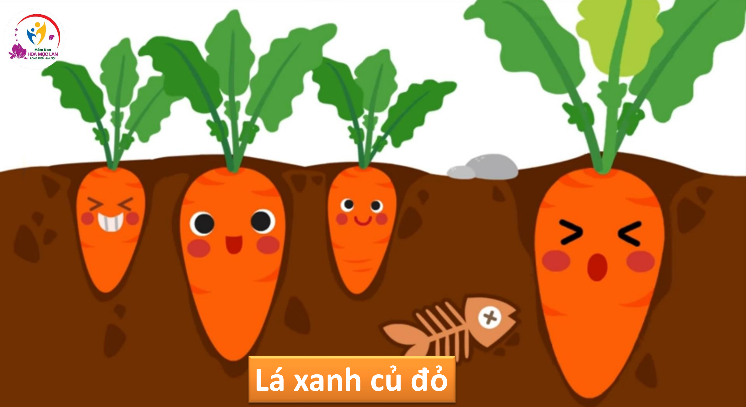
Lá xanh củ đỏ