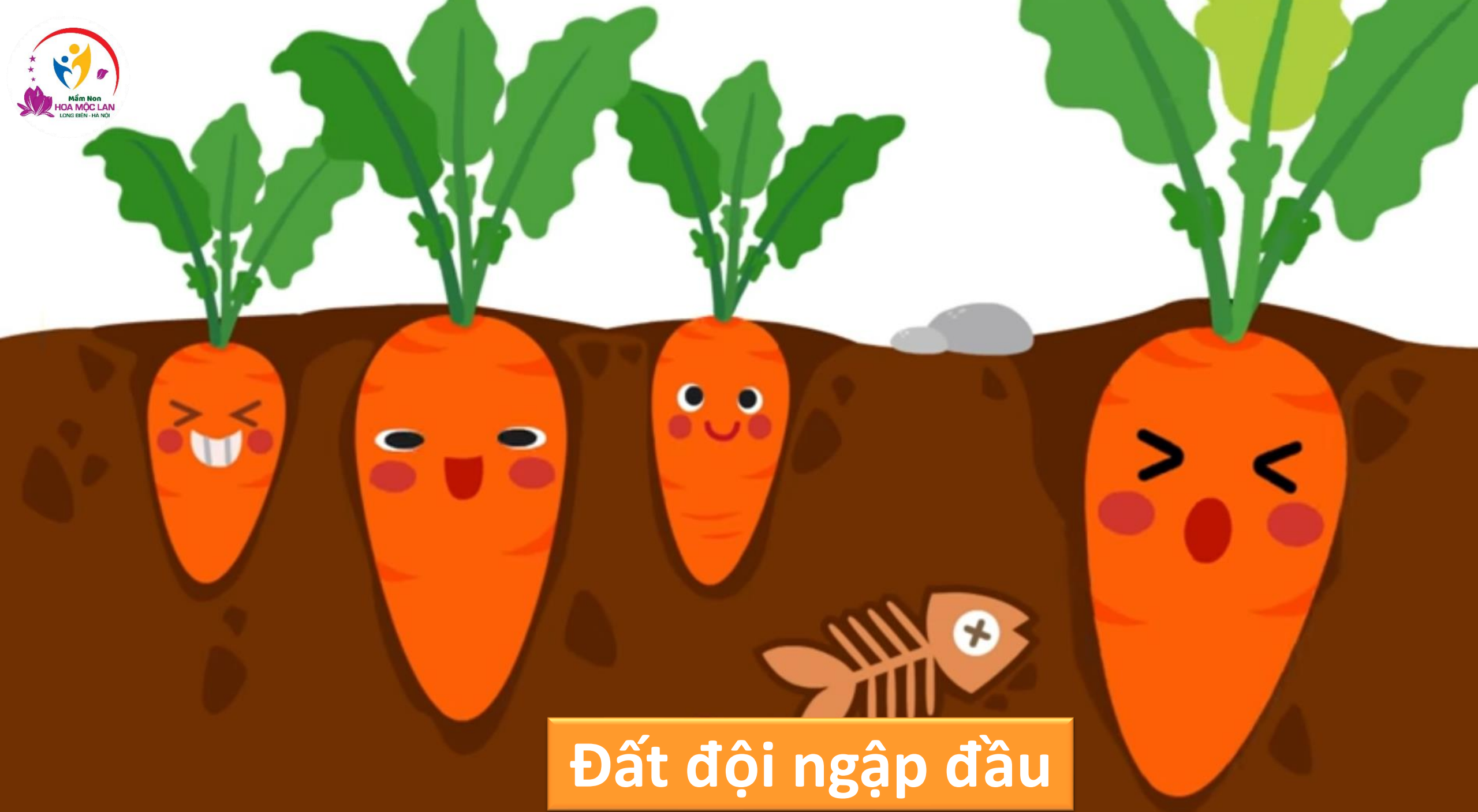
Đất đội ngập đầu