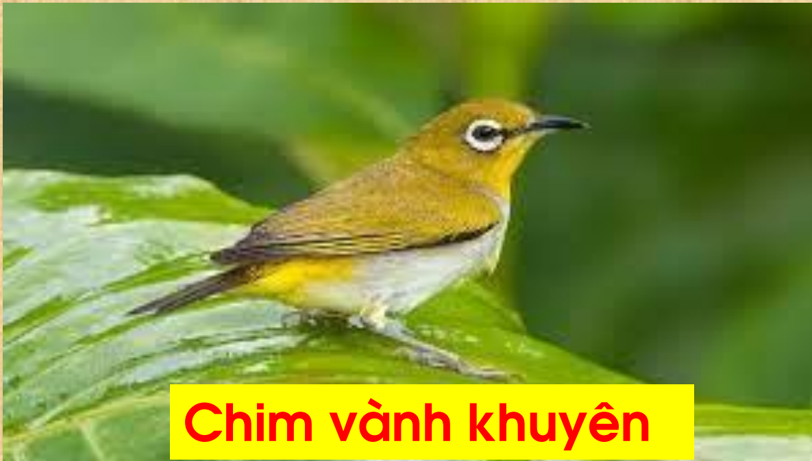
Chim vành khuyên