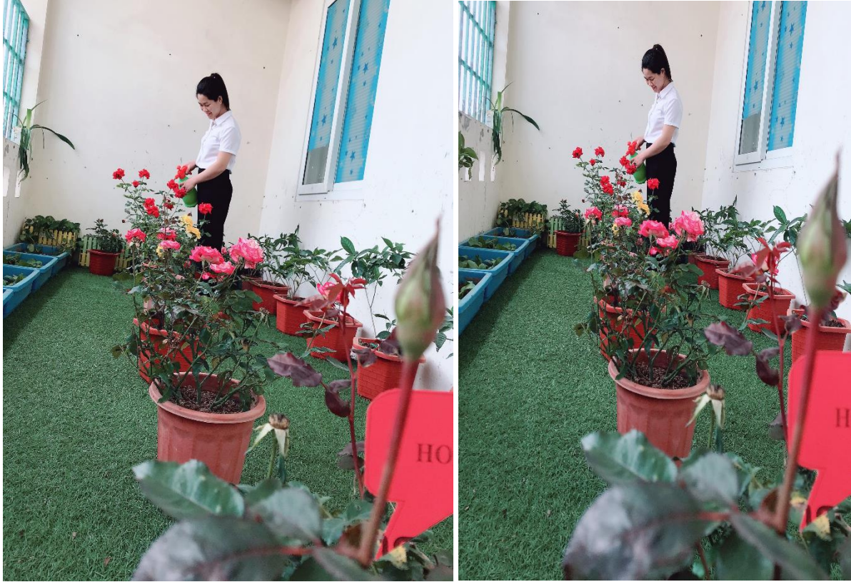
Ảnh 14,15: Góc thiên nhiên của lớp