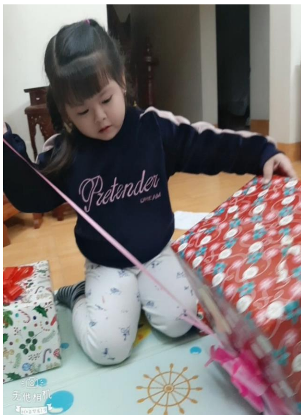
Ảnh 6,7: Học sinh chúc mừng, gói quà tặng nhân các ngày lễ ý nghĩa