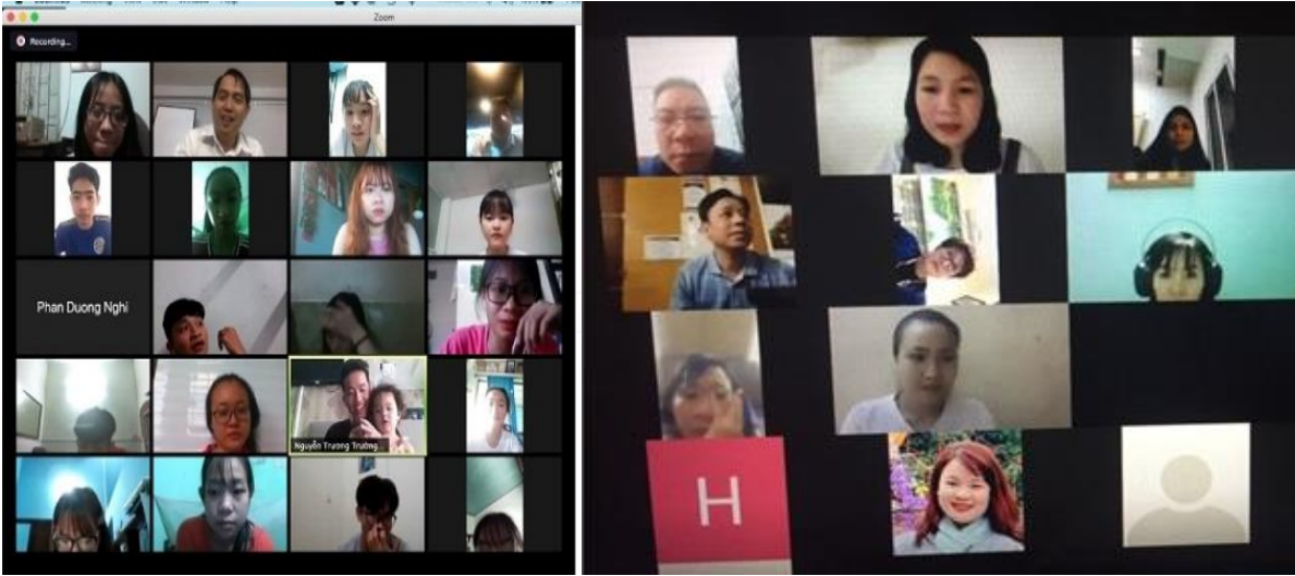
Ảnh 18,19: Họp trực tuyến với Phụ huynh học sinh của lớp.