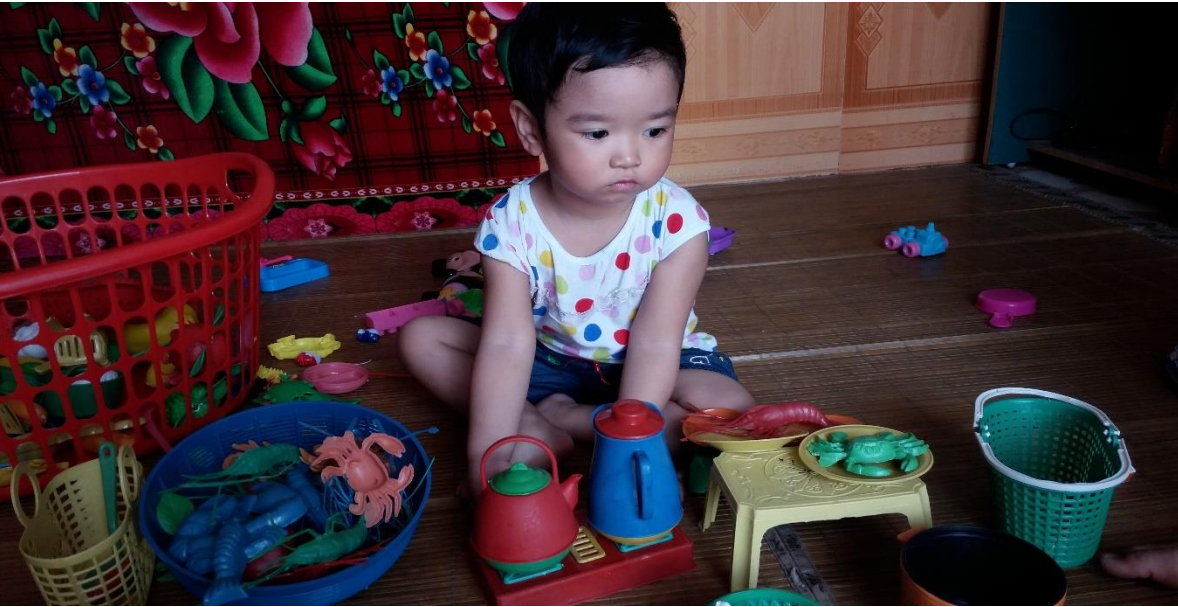
Ảnh 10,11: Trẻ chơi bán hàng