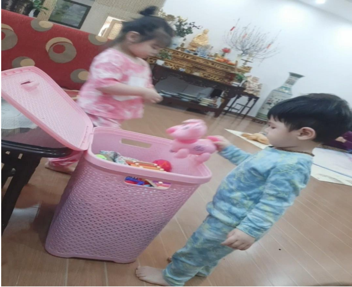
Ảnh 3: Học sinh tự cất đồ chơi gọn gàng sau khi chơi