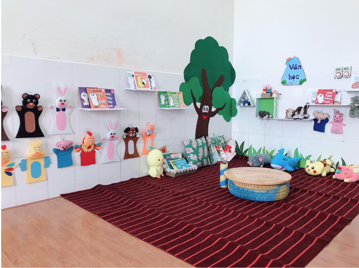
Ảnh 12,13: Trang trí môi trường lớp học