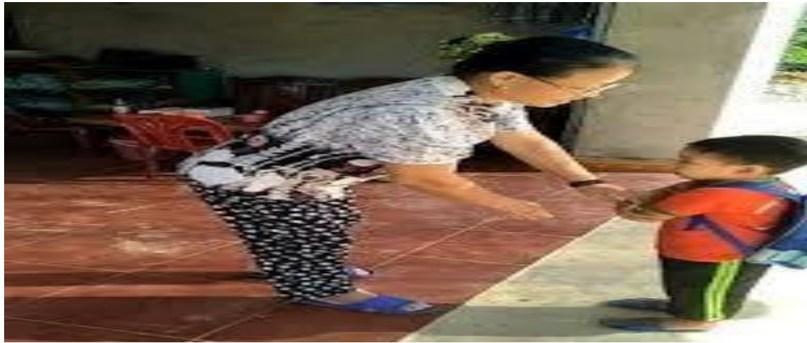
Ảnh 1,2: Học sinh được giáo dục lễ giáo chào hỏi, cầm 2 tay khi nhận quà.