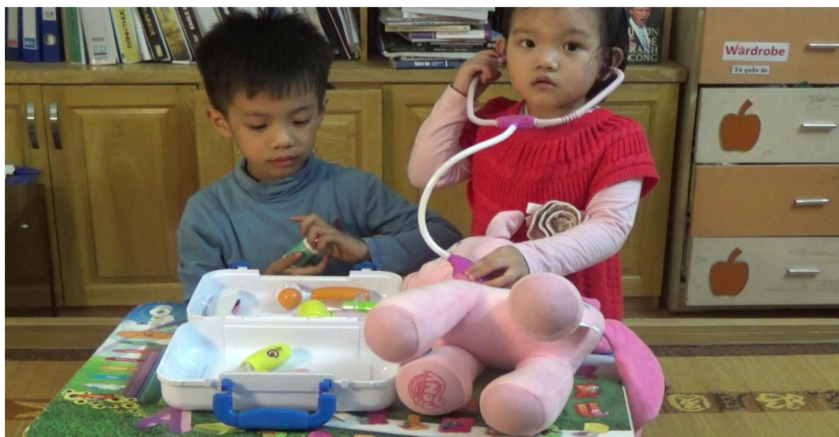
Ảnh 8,9: Trẻ chơi đóng vai bác sĩ