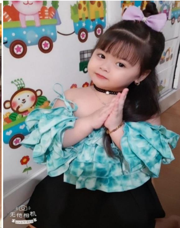
Ảnh 4,5: Học sinh biểu diễn hát, múa trong các dịp lễ hội