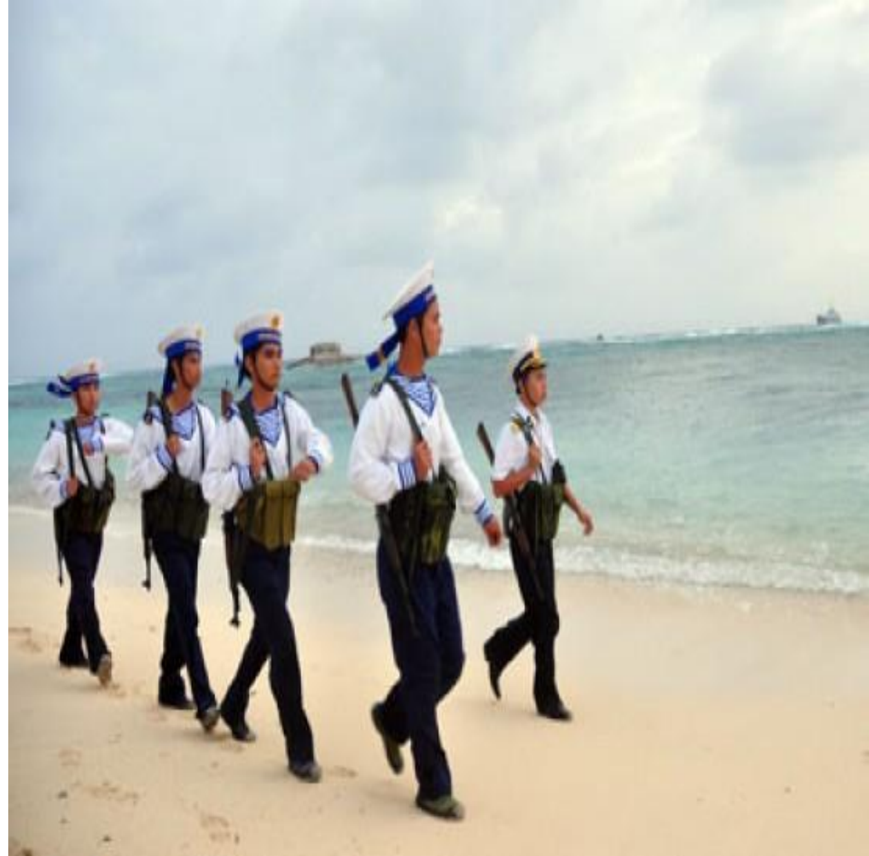
Nơi công tác: Biển đảo.