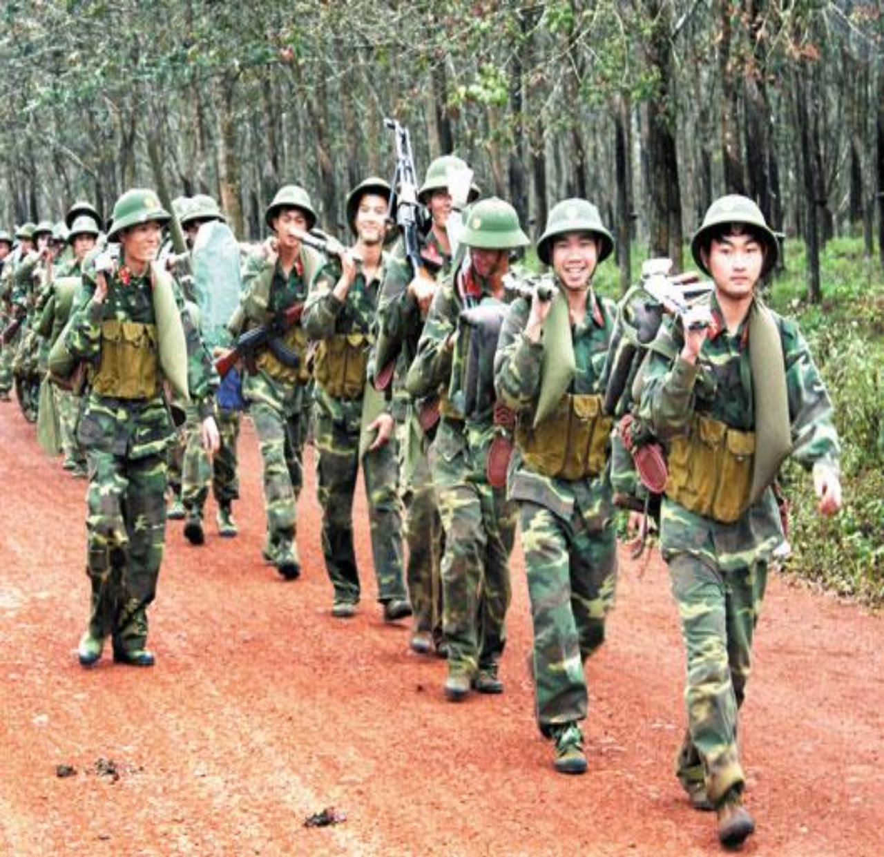
Nơi công tác: Trên bộ, đất liền.