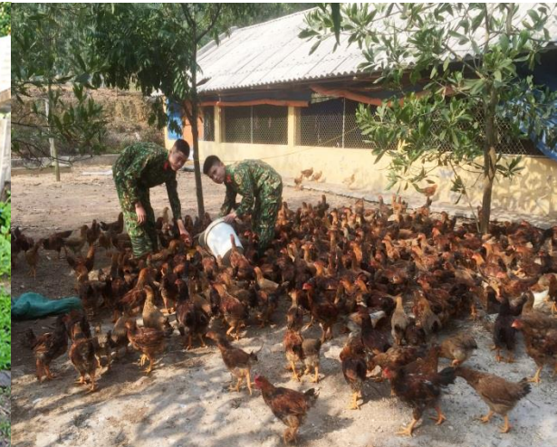
Tăng gia nuôi, trồng