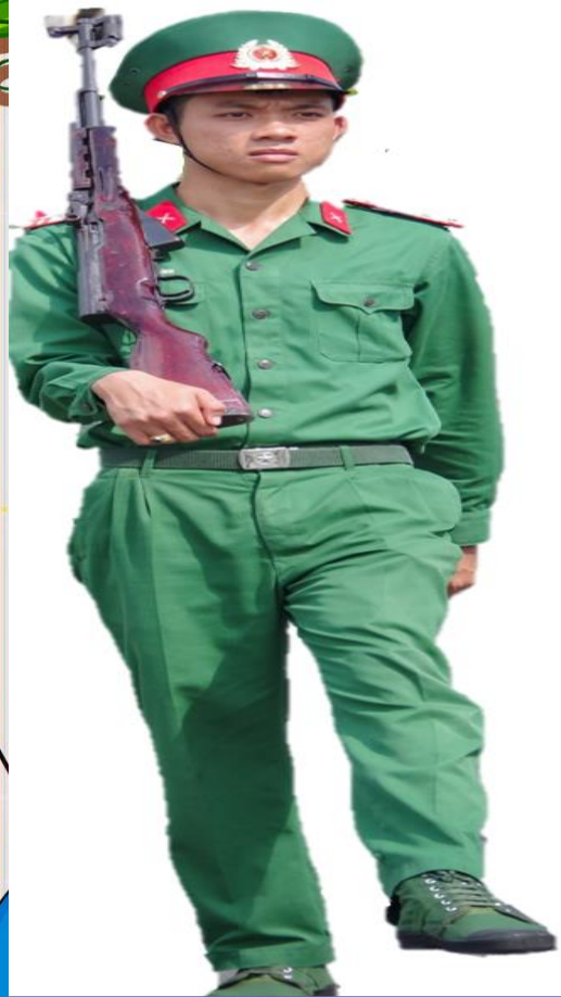
CHÚ BỘ ĐỘI BỘ BINH