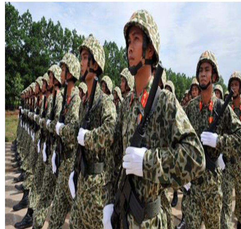
C. Quân phục màu rằn ri