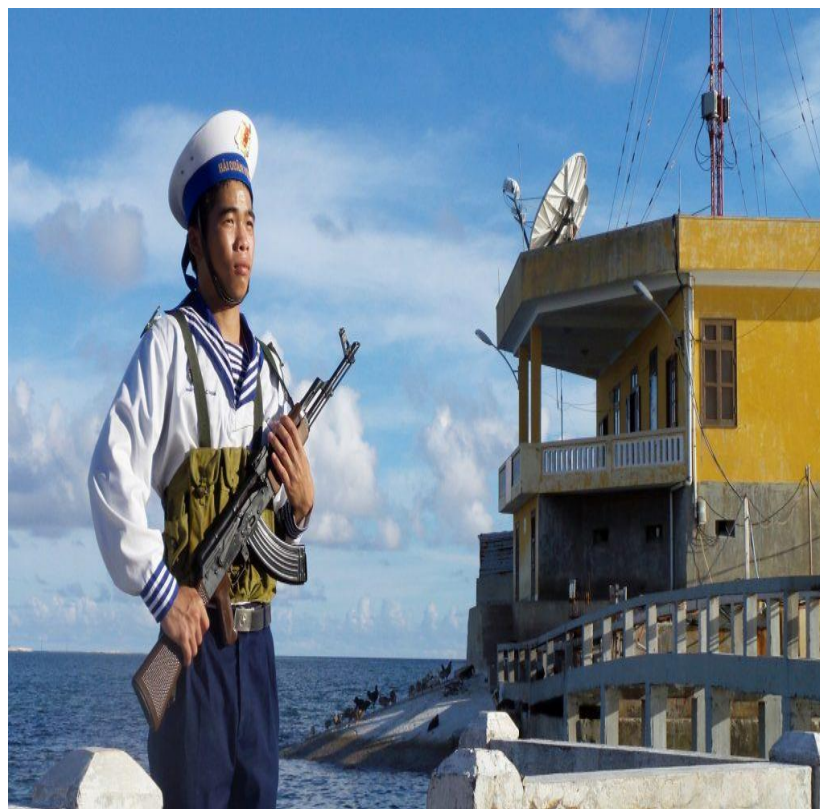
B. Chú bộ đội hải quân