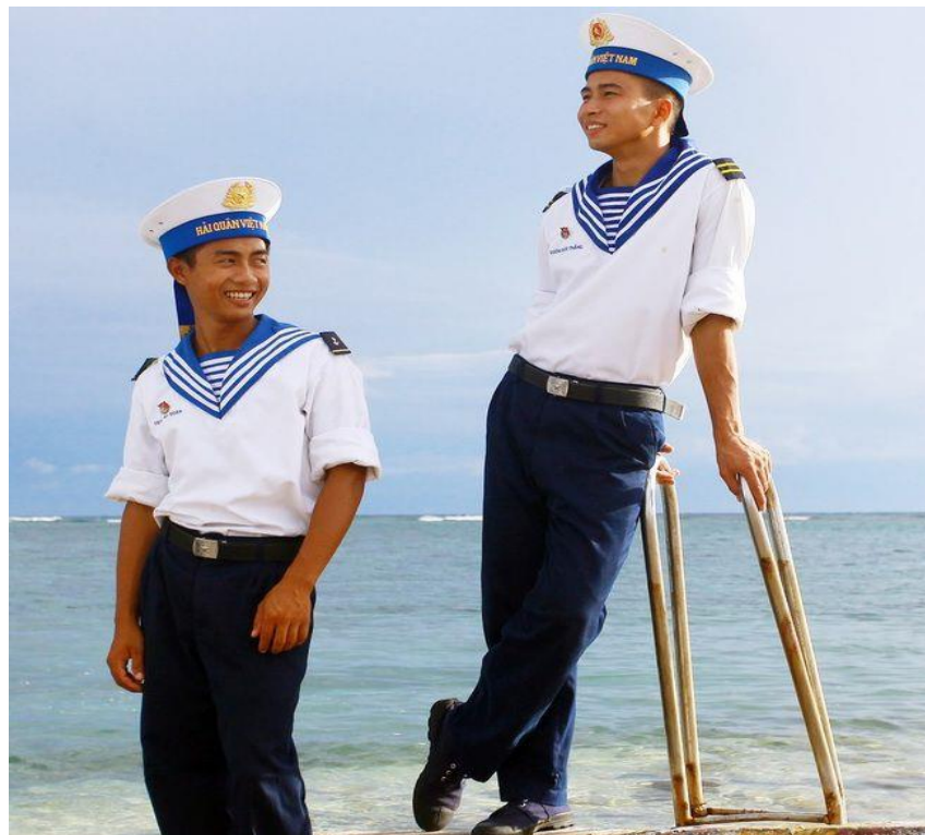
B. Áo trắng, cổ áo và ống tay có màu xanh kẻ trắng, quần xanh lam