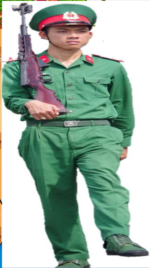
CHÚ BỘ ĐỘI BỘ BINH