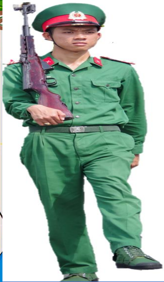
CHÚ BỘ ĐỘI BỘ BINH