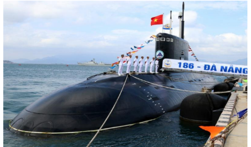
Tập luyện với vũ khí, phương tiện chiến đấu