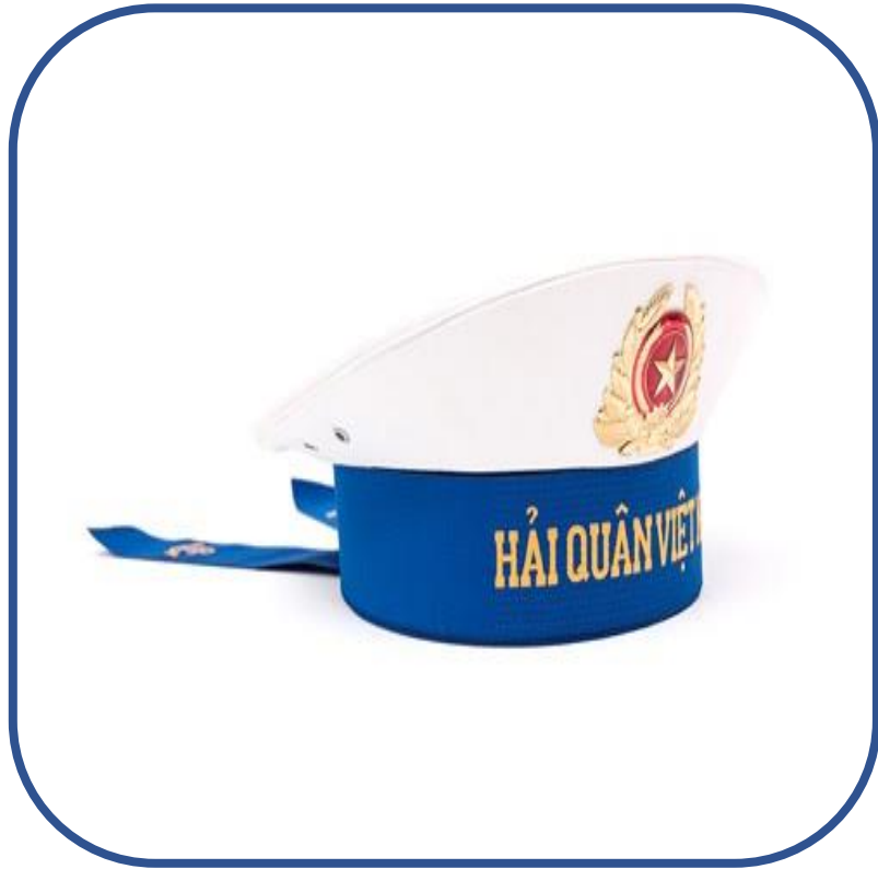
A. Mũ kê pi

Câu 6: Các con hãy lựa chọn quân trang cho các chú bộ đội?