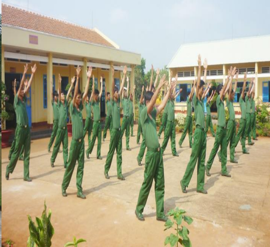
Rèn luyện thể lực