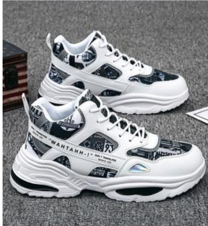
B. Giày thể thao