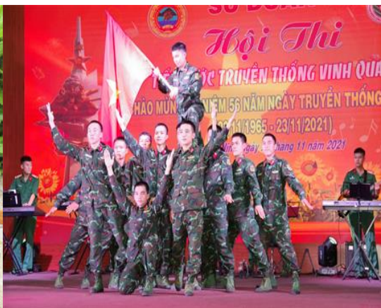
Tham gia văn hóa, văn nghệ