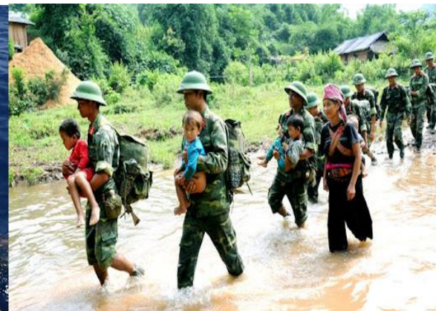
Giúp đỡ người dân