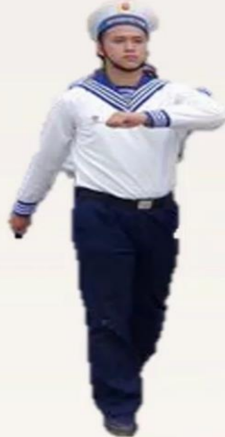
CHÚ BỘ ĐỘI HẢI QUÂN