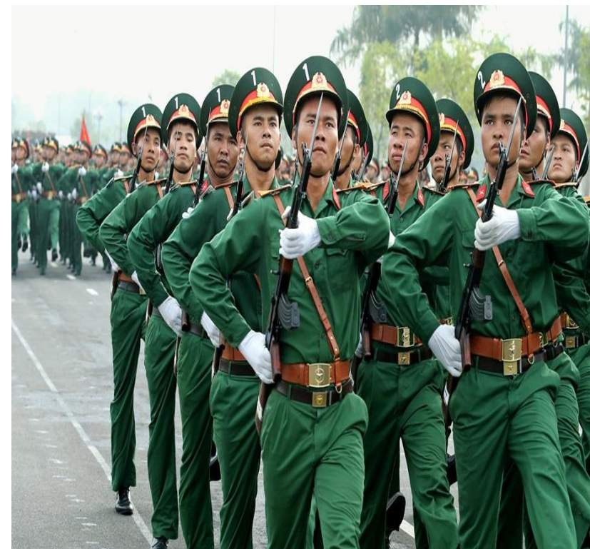
A. Quân phục màu xanh lá