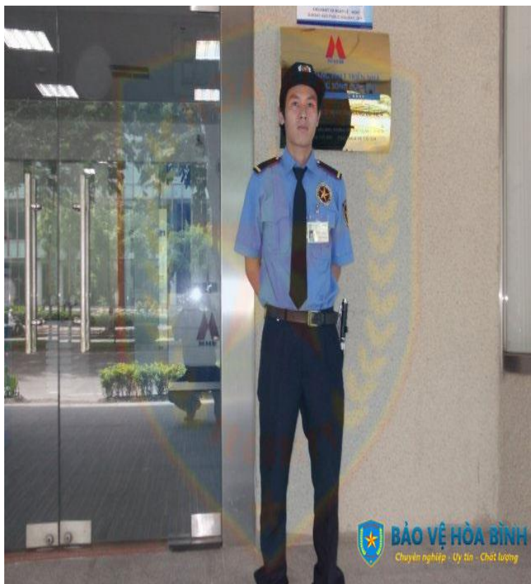
A. Chú bảo vệ