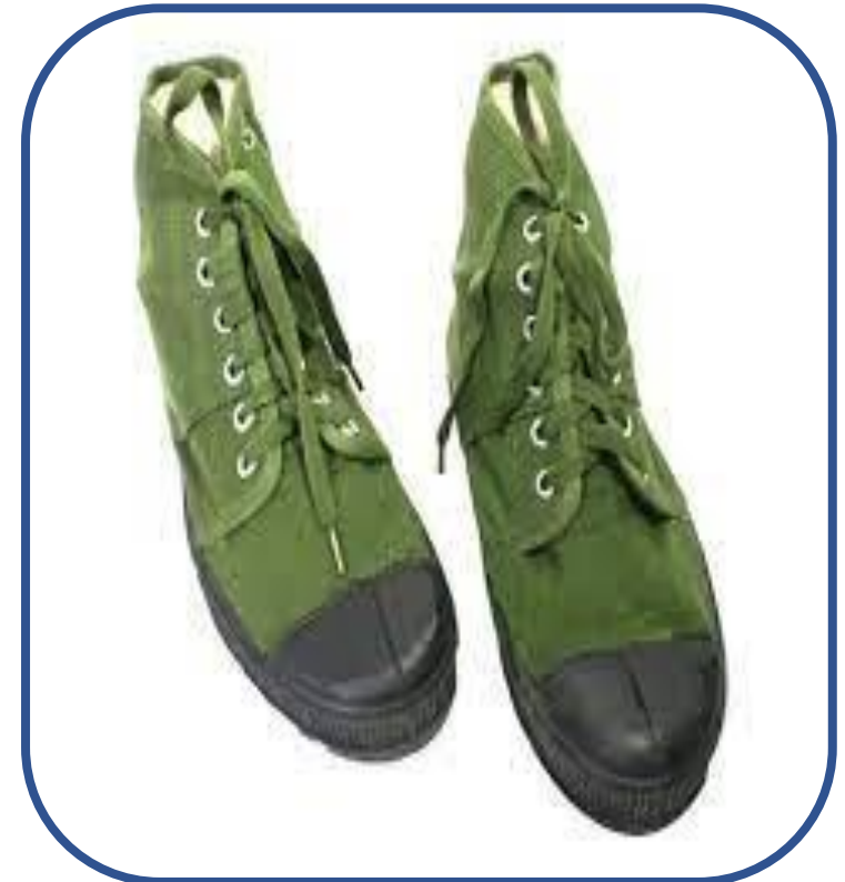
C. Giày vải