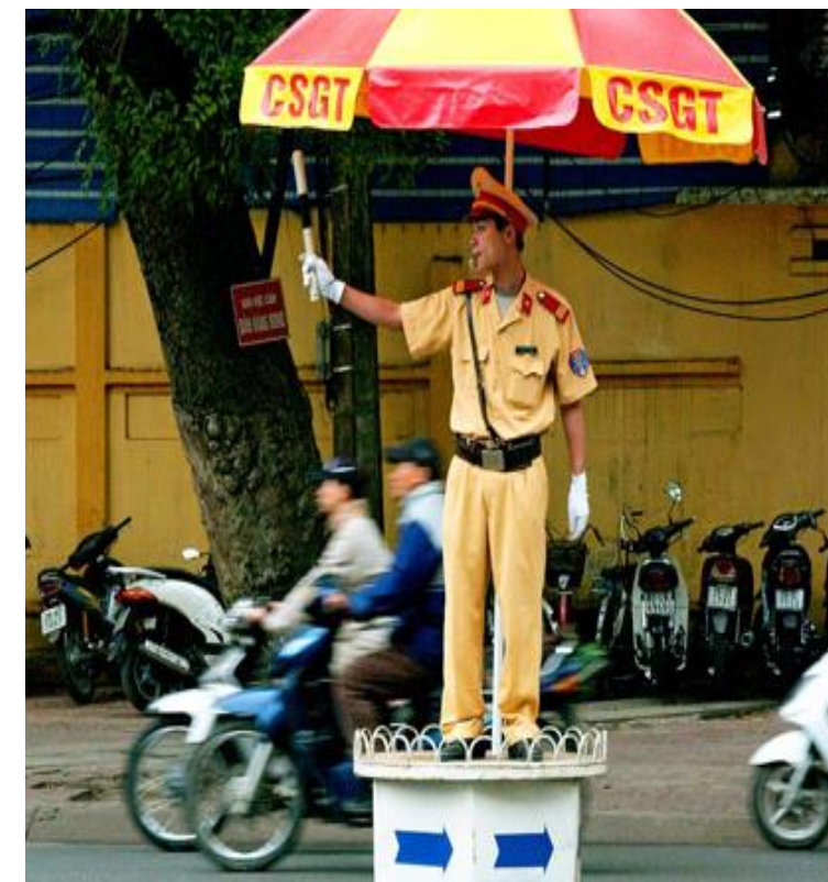
C. Cảnh sát giao thông