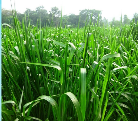
Các loại cỏ