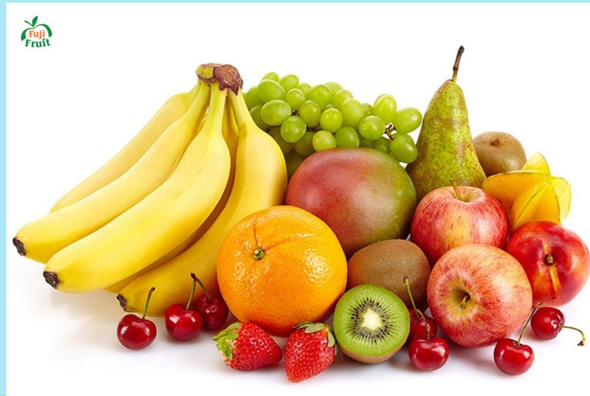
Các loại hoa quả