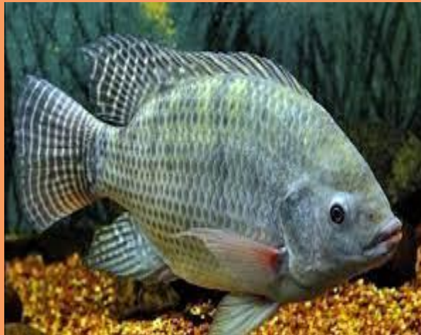
Cá rô phi