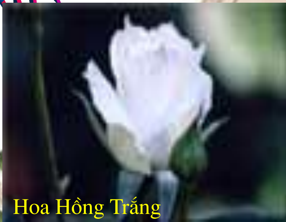
Hoa Hồng Trắng