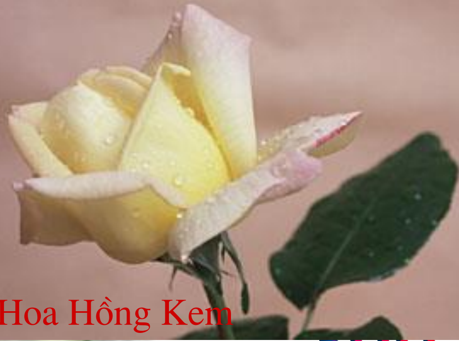
Hoa Hồng Kem