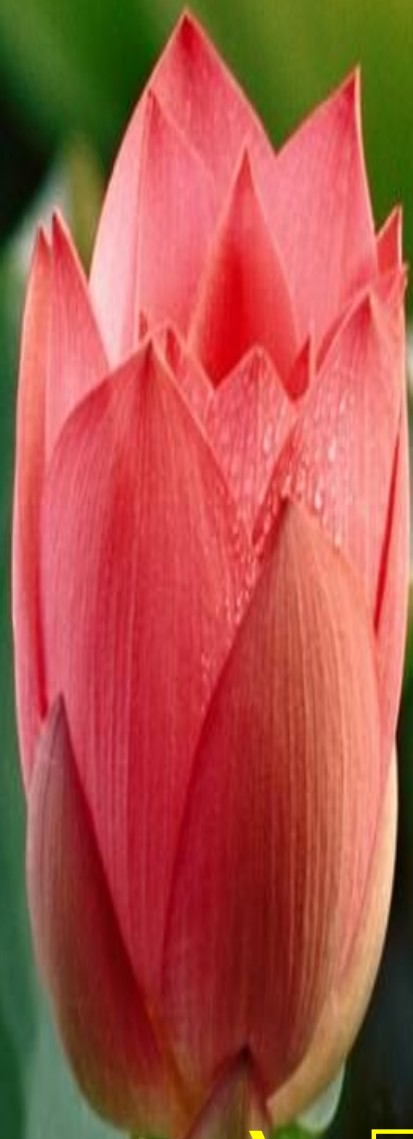
Hoa sen màu