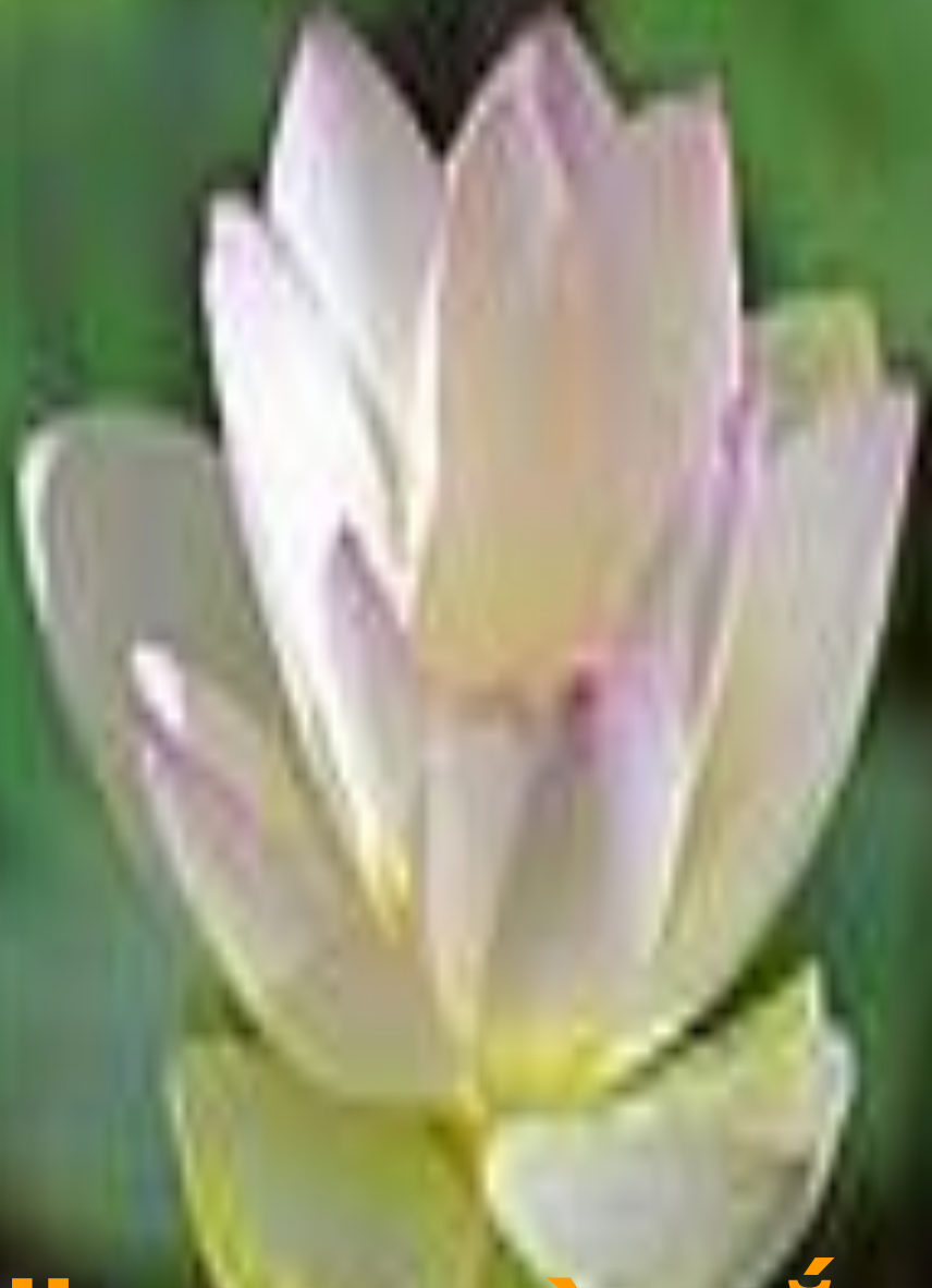
Hoa sen màu trắng