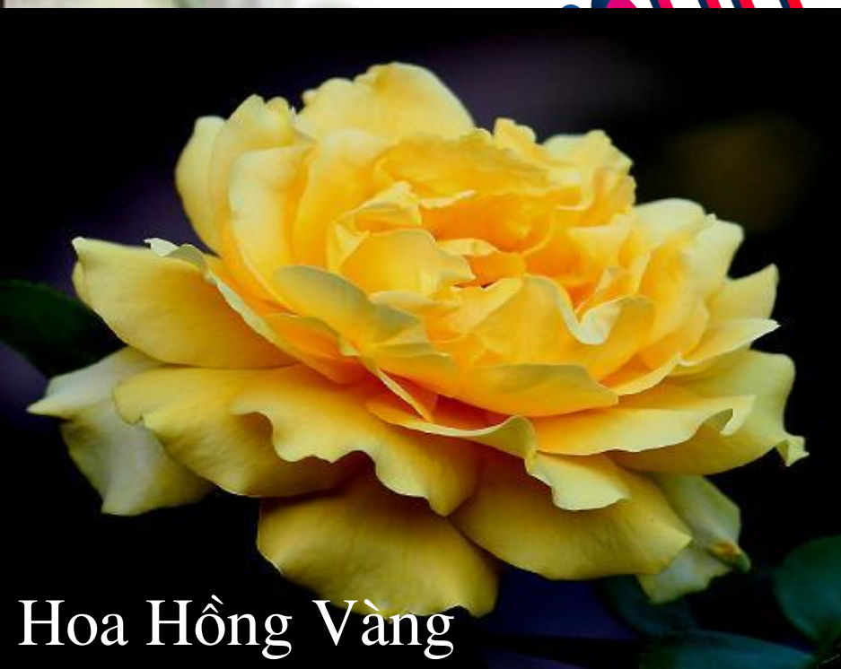
Hoa Hồng Vàng