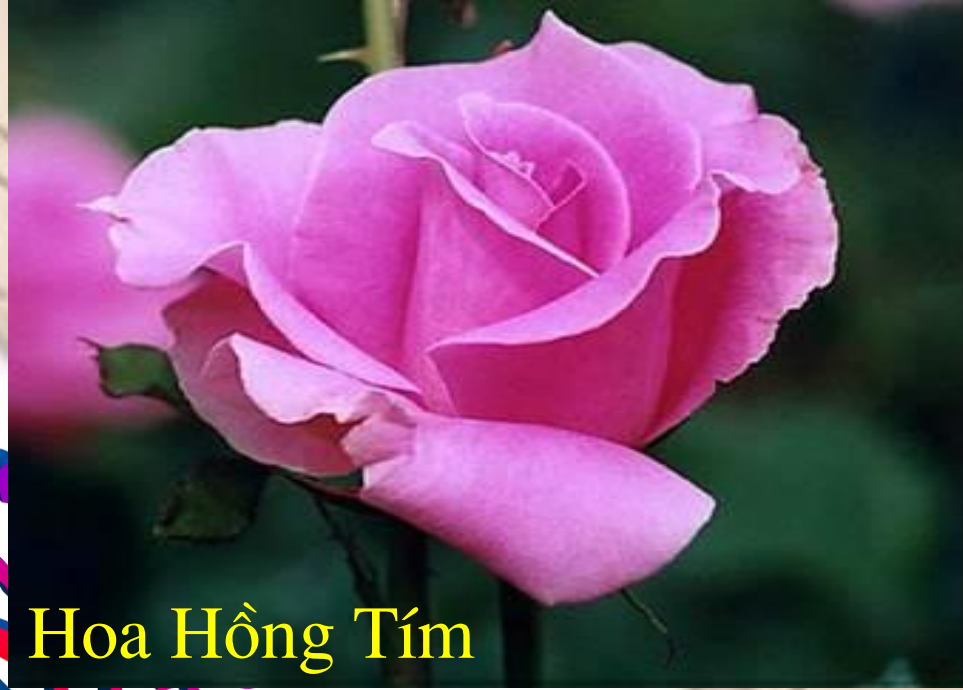
Hoa Hồng Tím