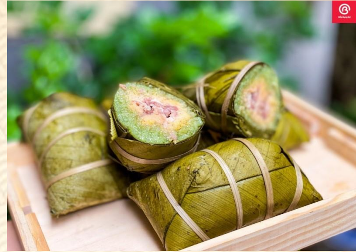
Bánh chưng gù Hà Giang