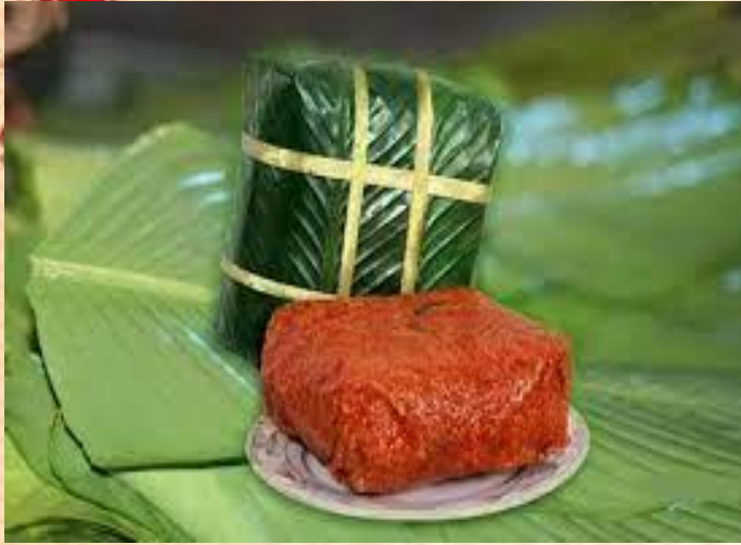
Bánh chưng gấc