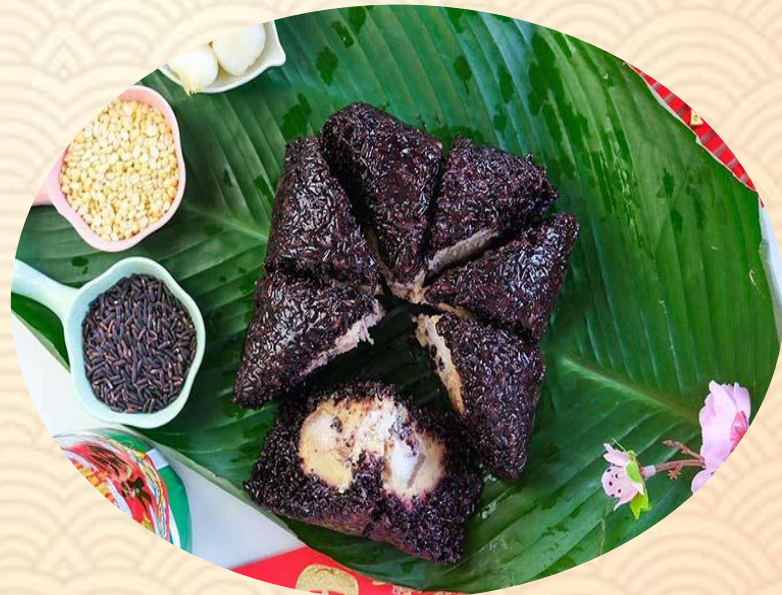
Bánh chưng nếp cẩm