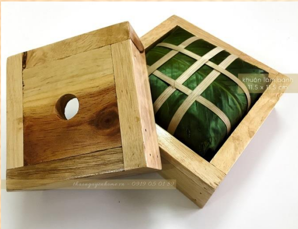
Khuôn gói bánh