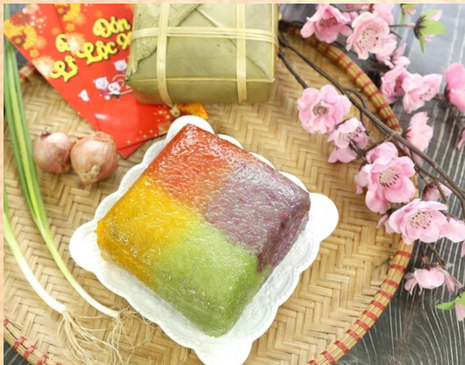
Bánh chưng ngũ sắc