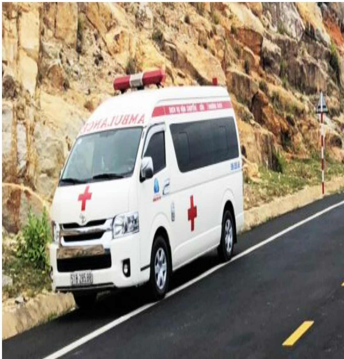
Xe cứu thương