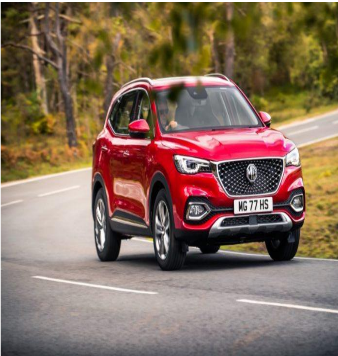
Ô tô con