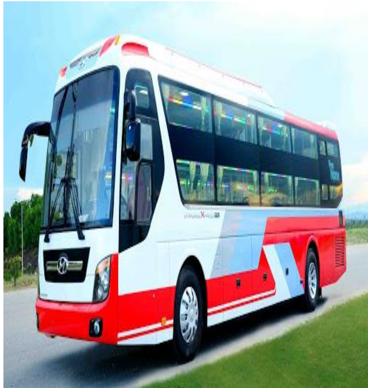
Ô tô khách