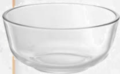
Bát thủy tinh