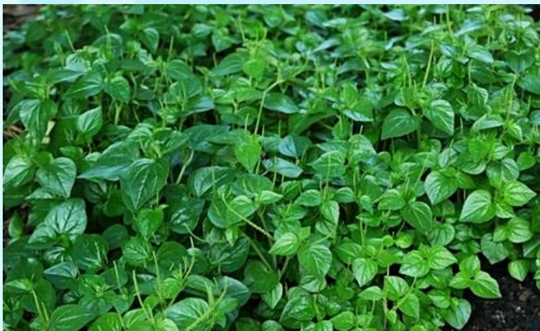
3. Ăn các loại rau dại, lúa hoang nhặt được.