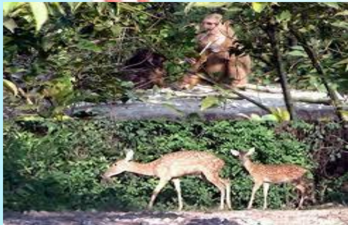
1. Ăn thịt thú rừng

Câu 1: Thuở xưa, nhân dân chưa biết cày cấy làm ra thóc gạo để ăn, nhân dân đã ăn gì?