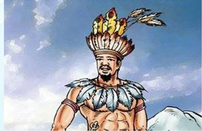
2. Vua Hùng