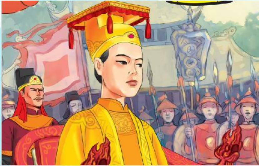
1. Vua Lê