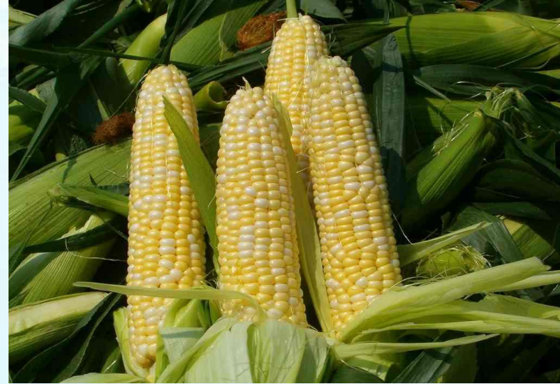
2. Vua Hùng dạy dân cách trồng ngô.