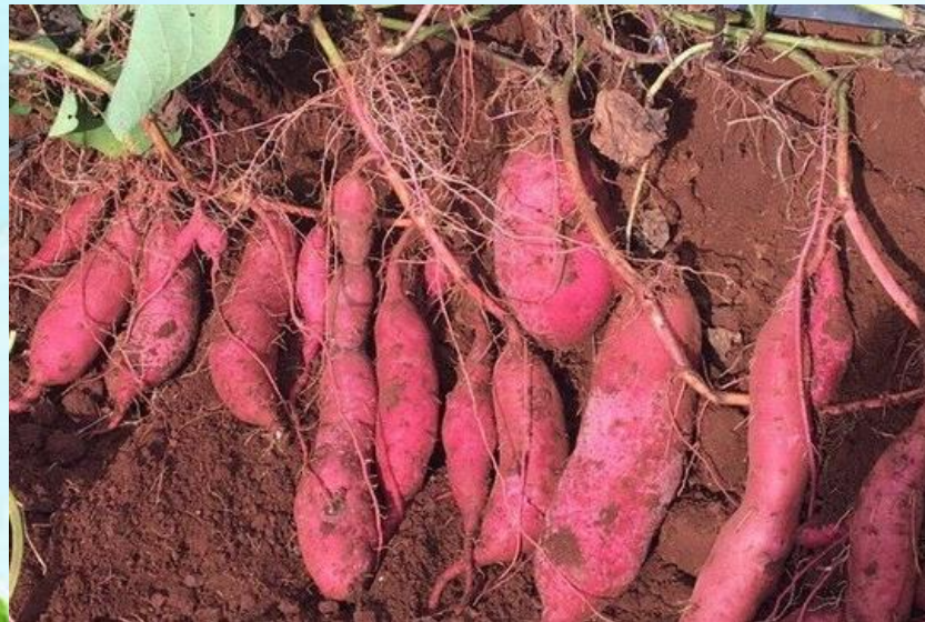
3. Vua Hùng dạy dân cách trồng khoai.