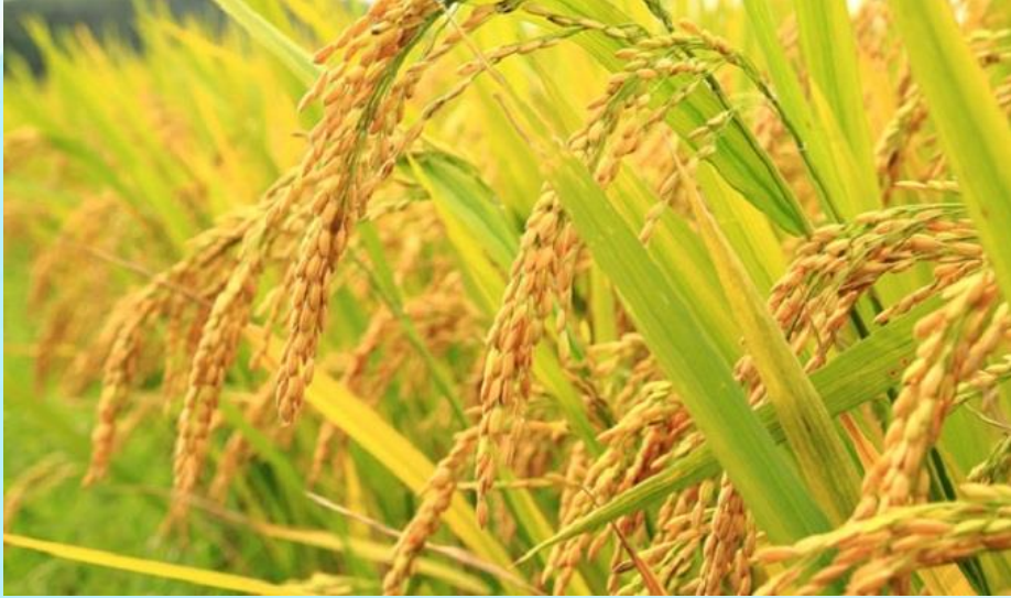
1. Vua Hùng dạy dân cách cấy lúa.