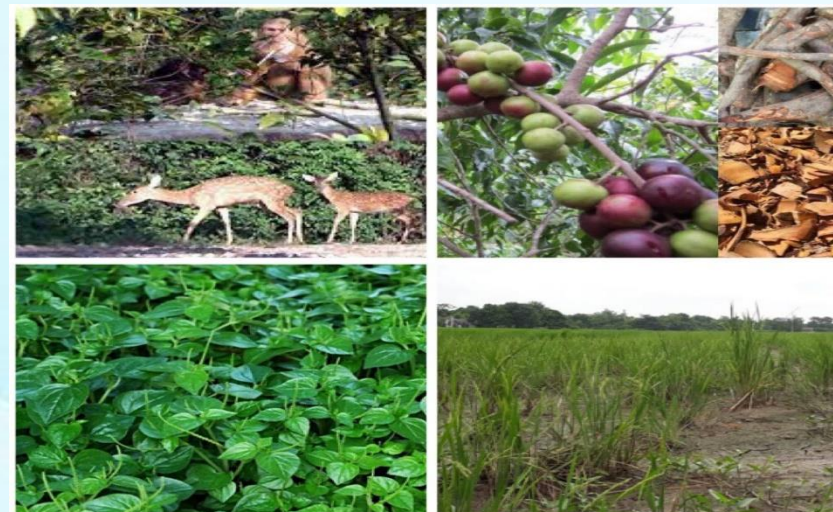
4. Cả 4 đáp án trên