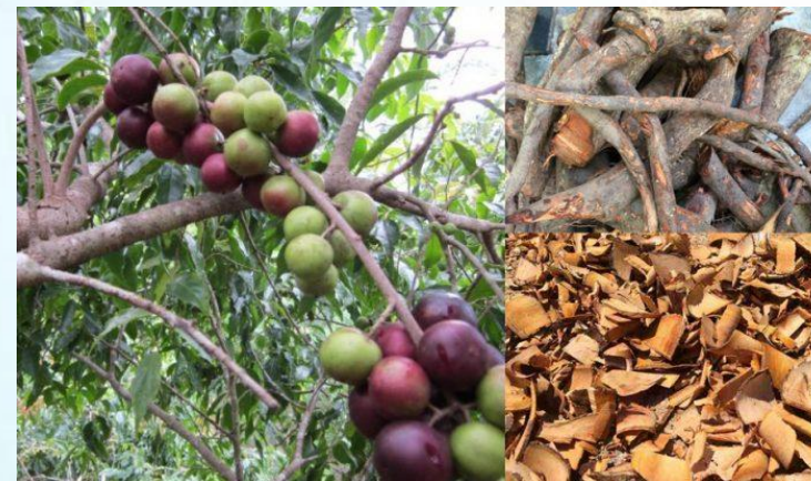
2. Ăn rễ cây, quả cây