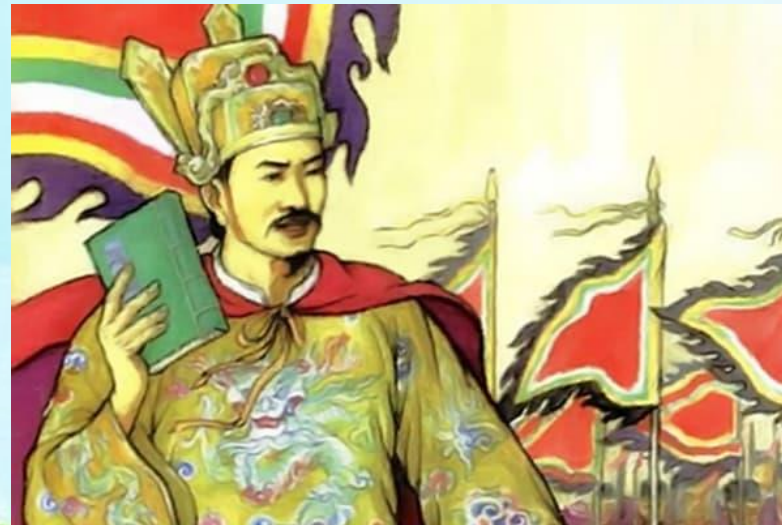
3. Vua Trần