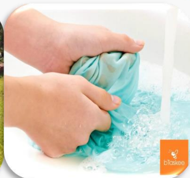
Nước dùng trong sinh hoạt hằng ngày