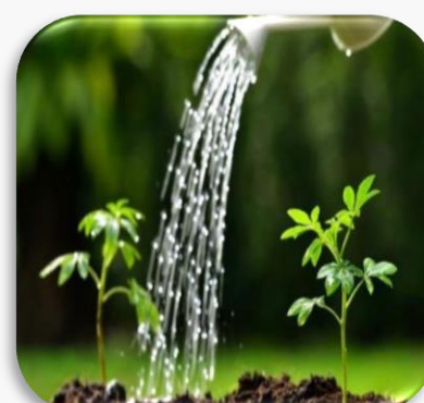
Nước cần cho sự phát triển của cây