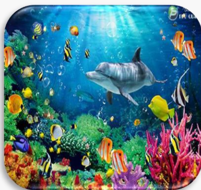
Nước là môi trường sống