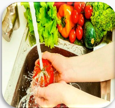
Nước dùng trong ăn uống