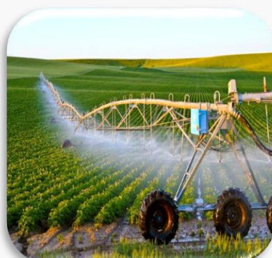
Nước dùng trong sản xuất