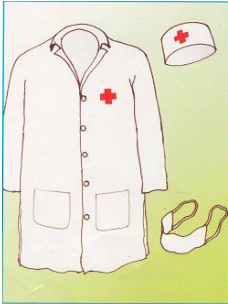
áo, mũ, khẩu trang