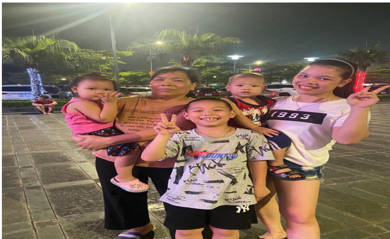
Ảnh cô Phương bên con cháu

Ngoài niềm vui trong công việc, sau những giờ làm việc về nhà cô lại có niềm vui quay quần bên con cháu. Tuy hai cô con gái của cô lấy chồng xa nhưng vẫn thường xuyên gọi điện và thăm hỏi. Thịnh thoảng lại đưa các cháu lên chơi với bà, tiếng cười nói của trẻ thơ khiến cô quên đi những nhọc nhằn của cuộc sống. Hàng xóm láng giềng ai cũng yêu quý cô bởi sự giản dị, gần gũi, thân thiện hết lòng vì mọi người.