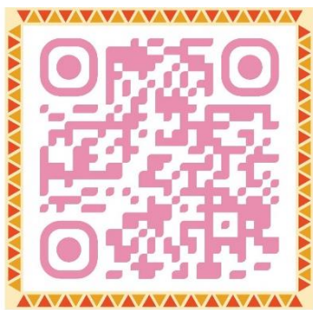
Mã QR cuốn sách

Xin trân trọng giới thiệu cuốn sách " Lịch sử Đảng bộ quận Long Biên (2013-2023) "