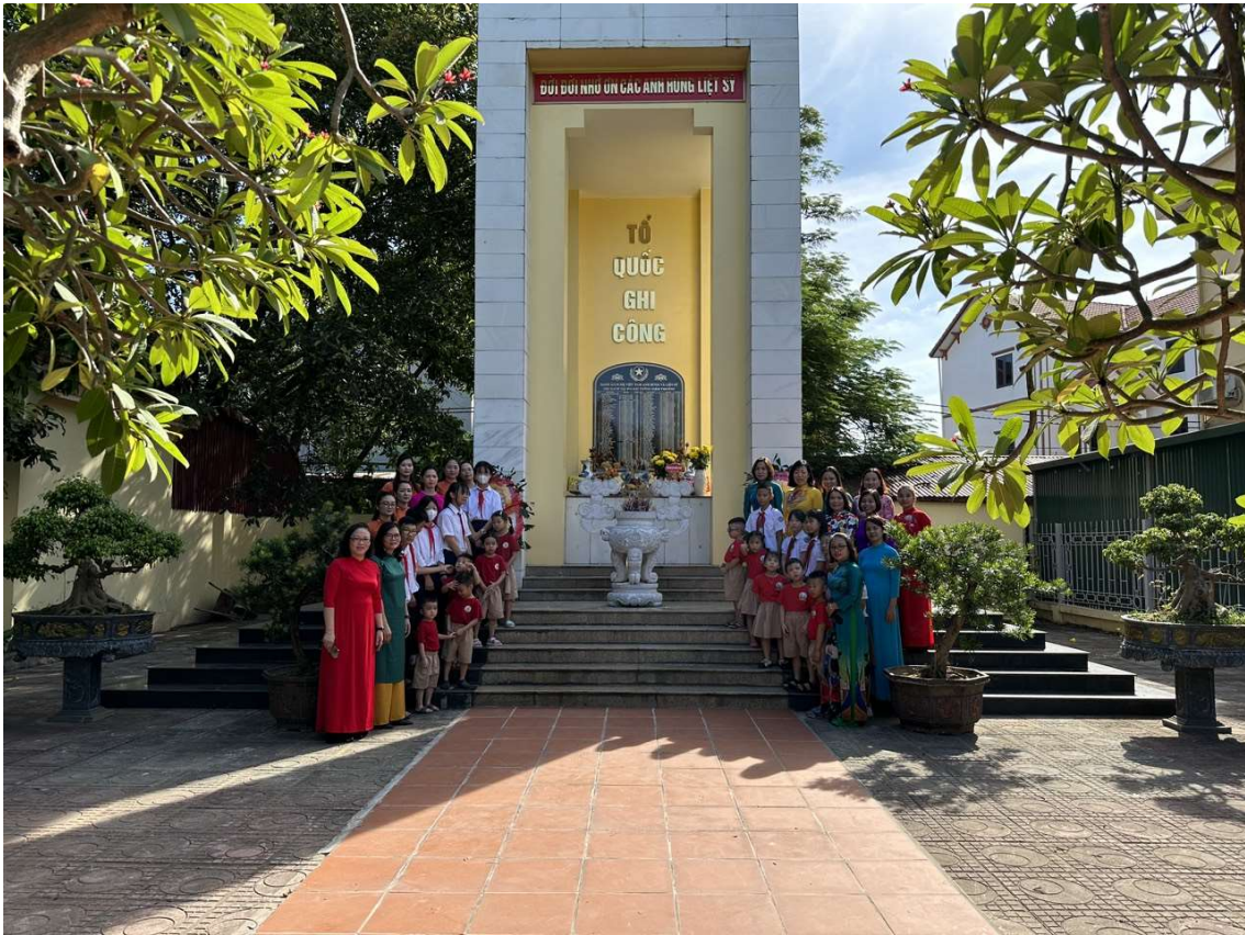
Hình ảnh đại diện các nhà trường tổ chức Lễ dâng hương tại Đài tưởng niệm phường Cự Khối nhân dịp 27//7

Thực hiện Chương trình công tác Đoàn và phong trào thanh thiếu nhi quận Long Biên năm 2023, kế hoạch số 33 - KH/ĐTN ngày 23/6/2023 về việc tổ chức các hoạt động kỷ niệm 76 năm Ngày thương binh - Liệt sỹ; phát huy truyền thống đền ơn đáp nghĩa, uống nước nhớ nguồn dân tộc, nhằm thể hiện tình cảm, trách nhiệm, sự quan tâm đối với người có công với cách mạng. Sáng ngày 24/7/2023, đại diện các nhà trường Mầm non, Tiểu học và THCS phường Cự Khối (bao gồm: Trường Mầm non Cự Khối, trường Mầm non Hoa Phượng, trường Tiểu học Cự Khối và trường THCS Cự Khối) tổ chức Lễ dâng hương nhằm tri ân các Thương binh Liệt sỹ, bà mẹ Việt Nam Anh hùng tại Đài tưởng niệm phường Cự Khối.