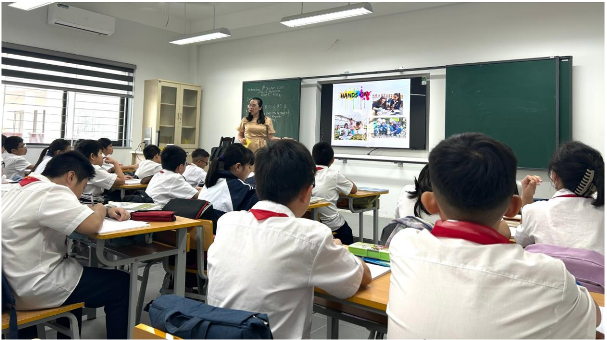
Hình ảnh: Cô và trò say sưa trong tiết học