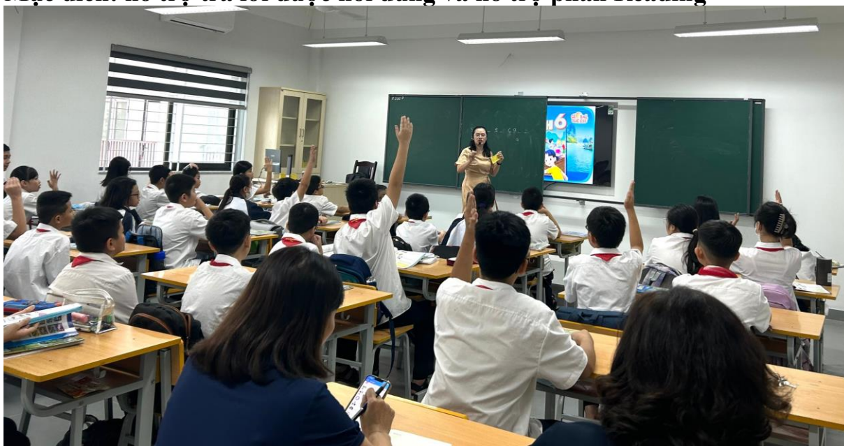
Hình ảnh các em học sinh nhiệt tình, sôi nổi trong các giờ học

Mục đích: hỗ trợ trả lời được nội dung và hỗ trợ phần Reading