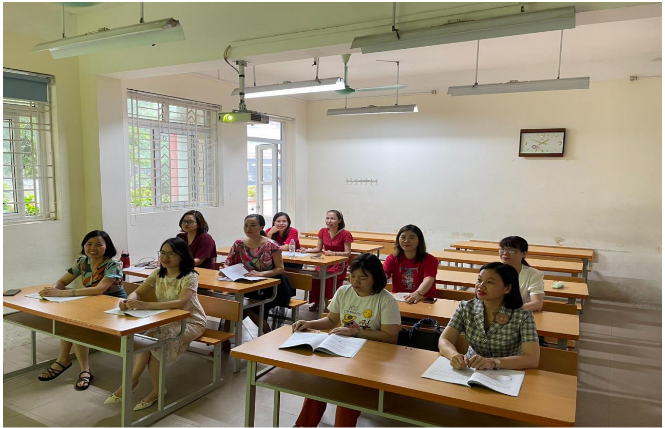
Hình ảnh các thầy cô giáo tập huấn môn Ngữ văn