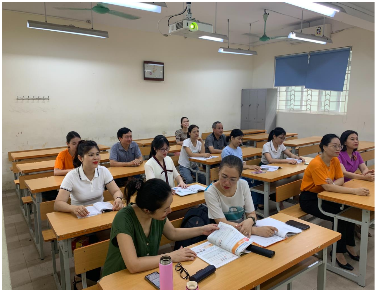
Hình ảnh các thầy cô giáo tập huấn môn Khoa học tự nhiên