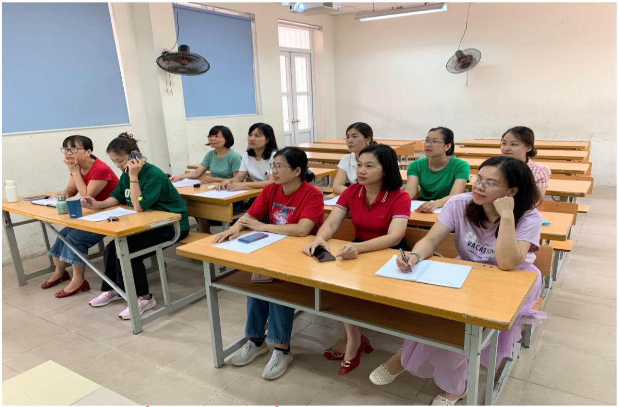
Hình ảnh các thầy cô giáo tập huấn môn Hoạt động trải nghiệm - hướng nghiệp