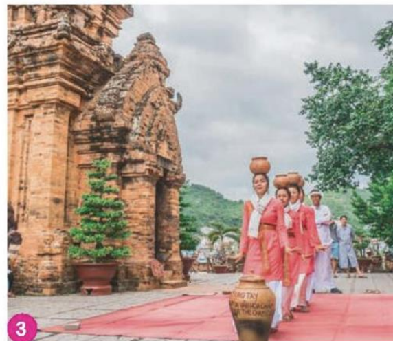
Điệu múa truyền thống của người Chăm ở Khánh Hoà

THEO EM, NHỮNG HÌNH ẢNH TRÊN NÓI VỀ NHỮNG TT NÀO CỦA QUÊ HƯƠNG?