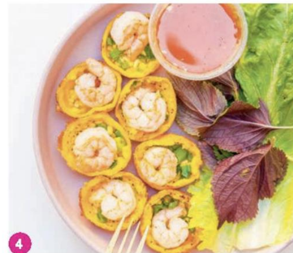
Bánh khọt – món ăn truyền thống ở Nam Bộ