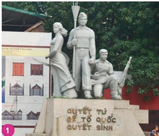
Tượng đài Quyết tử để Tổ quốc quyết sinh, Hà Nội