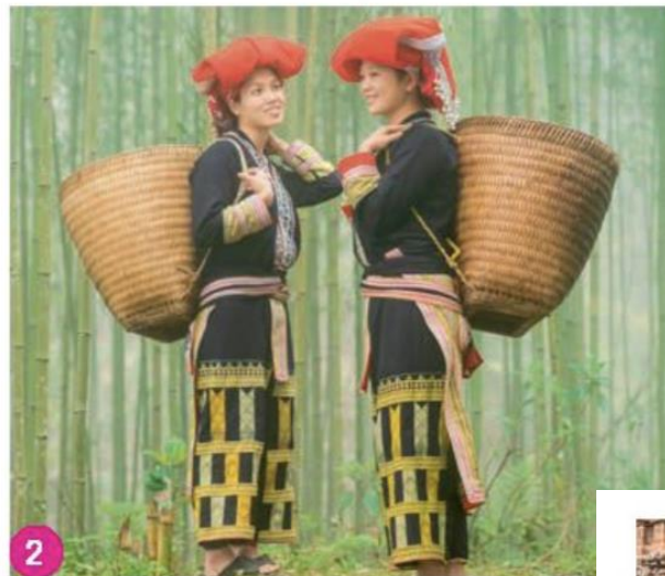
Người Dao Đỏ ở Lào Cai trong trang phục truyền thống