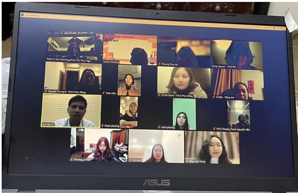
Nhóm Anh văn