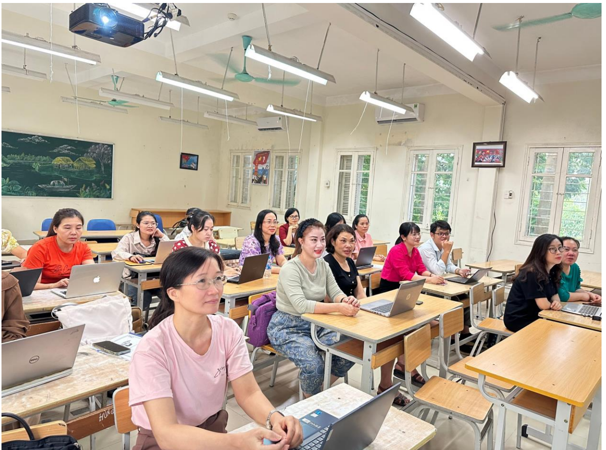
100% CBGV tham dự tập huấn