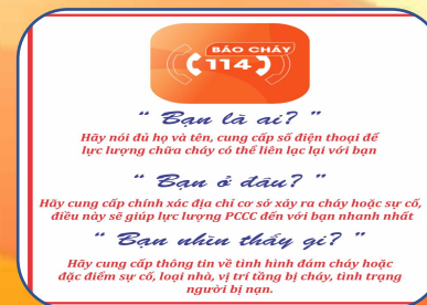
Quy trình gọi 114