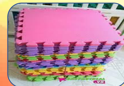
05 tấm thảm xốp