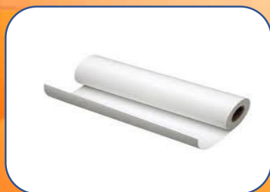
08 tờ giấy A0