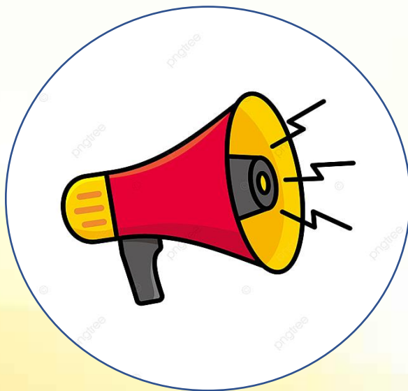
Nhạc báo cháy