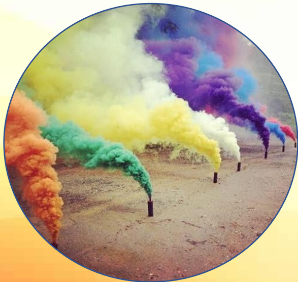
20 quả pháo khói