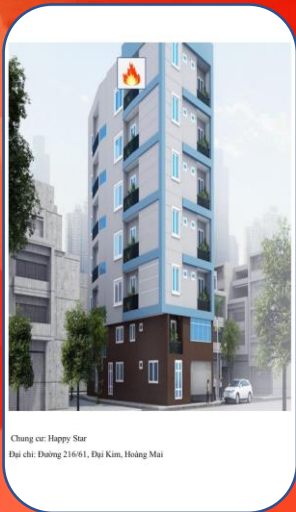
Chung cư Happy Star Địa chỉ: Đường 216/61, Đại Kim, Hoàng Mai