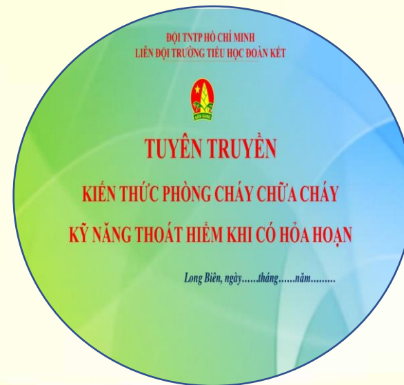
Phông sân khấu