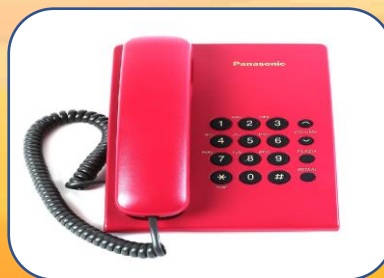
Điện thoại bàn