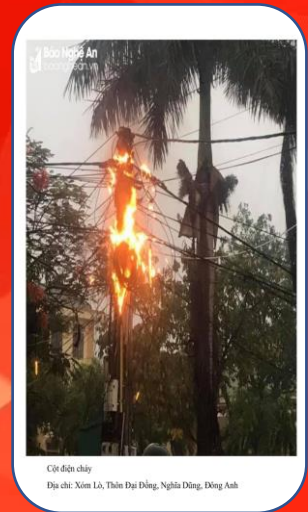
Cột điện cháy Địa chỉ: Xóm Lò, Thôn Đại Đồng, Nghĩa Dũng, Đống Anh