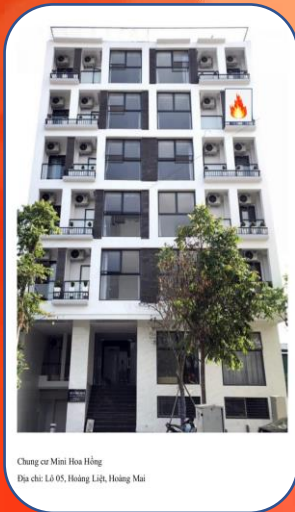
Chung cư Mini Hoa Hồng Địa chỉ: Lô 05, Hoàng Liệt, Hoàng Mai