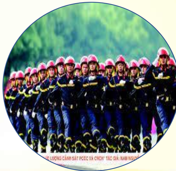
Nhạc bài hát