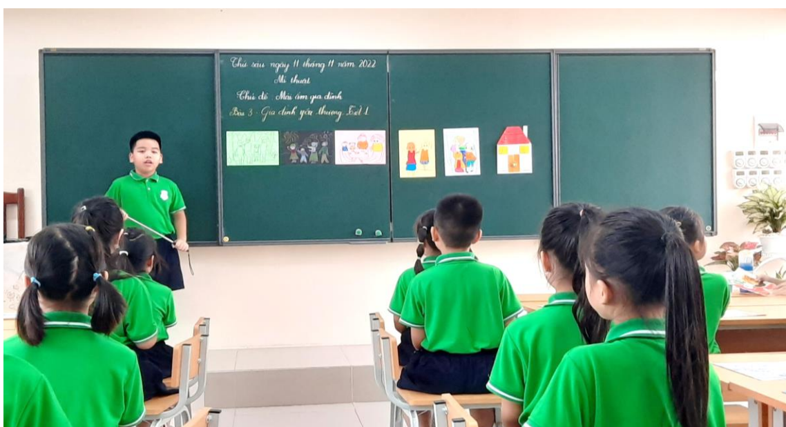
Học sinh tự tin giới thiệu bức tranh gia đình

Sau khi hoàn thành được những sản phẩm đẹp, các em rất mạnh dạn tự tin chia sẻ về bức tranh của mình, của bạn. Quan sát và nêu được cảm nhận về nội dung tranh, hình ảnh, màu sắc của bức tranh. Trong tiết học, học sinh học tập sôi nổi, chủ động, tích cực hợp tác và hoàn thành tốt mục tiêu tiết học.