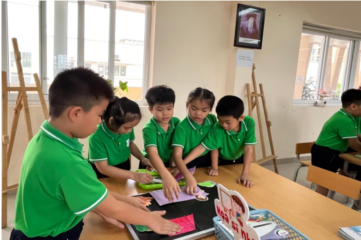
Học sinh hoạt động nhóm tích cực