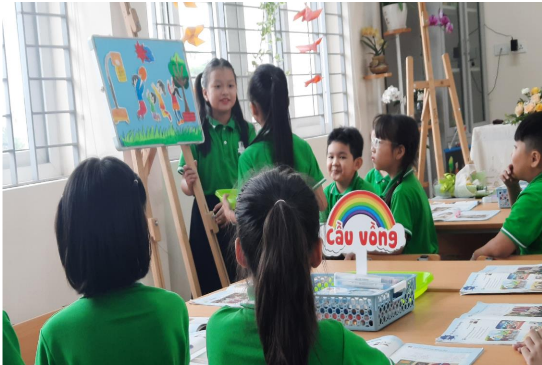
Học sinh rất mạnh dạn tự tin chia sẻ về bức tranh của nhóm mình