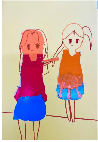
Tác giả: Giáo viên tổ Mỹ thuật