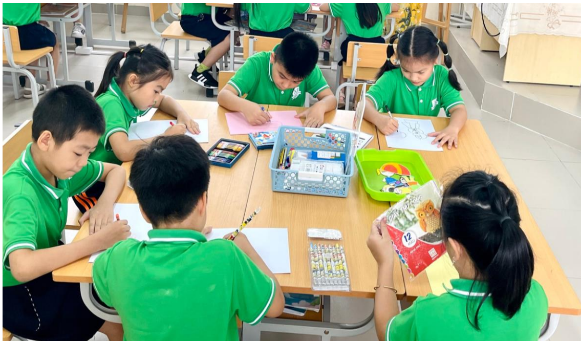
Học sinh luyện tập – sáng tạo

Học sinh luyện tập – sáng tạo với những bức tranh về các hoạt động trong gia đình rất ý nghĩa, sáng tạo khi thực hành, sử dụng đa dạng các chất liệu và tạo hình sản phẩm phong phú.