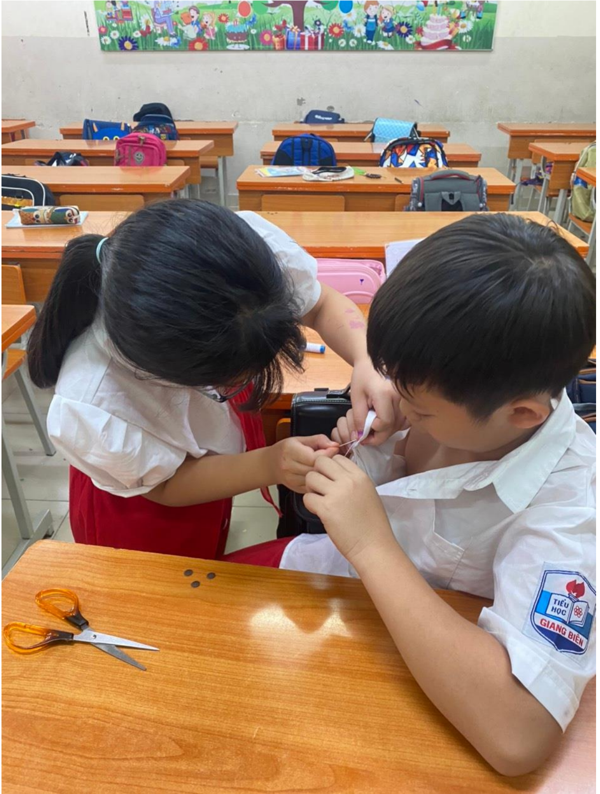
Khâu áo khi bạn đứt khuy trong giờ Thể dục