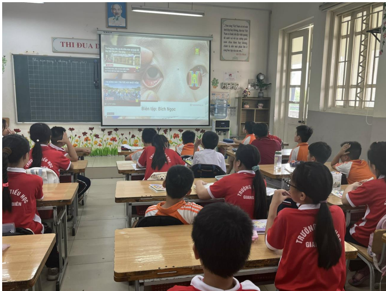
Hình ảnh: Học sinh lớp 5A2 trong buổi tuyên truyền.

Trong bối cảnh dịch đau mắt đỏ đang hoành hành, trường Tiểu học Giang Biên đã thực hiện một chiến dịch tuyên truyền về cách phòng chống bệnh đau mắt đỏ tới toàn thể các em học sinh, nhằm giúp các em học sinh hiểu rõ hơn về căn bệnh này và biết cách bảo vệ sức khỏe của mình cũng như cả cộng đồng.