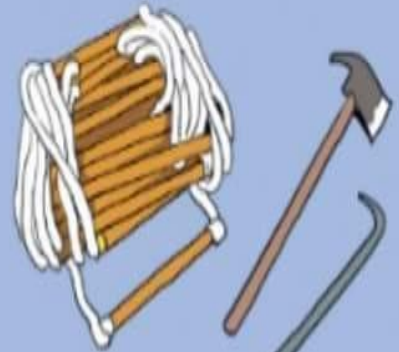
THANG DÂY, DỤNG CỤ PHÁ RỠ