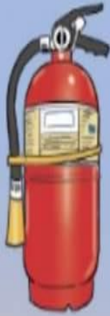
BÌNH CHỮA CHÁY