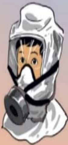
MẶT NẠ PHÒNG ĐỘC

TRANG BỊ PHƯƠNG TIỆN, DỤNG CỤ BẢO CHÁY, CHỮA CHÁY, THOÁT NẠN