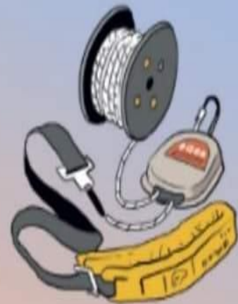
BỘ DÂY HẠ CHẠM

TRANG BỊ PHƯƠNG TIỆN, DỤNG CỤ BẢO CHÁY, CHỮA CHÁY, THOÁT NẠN