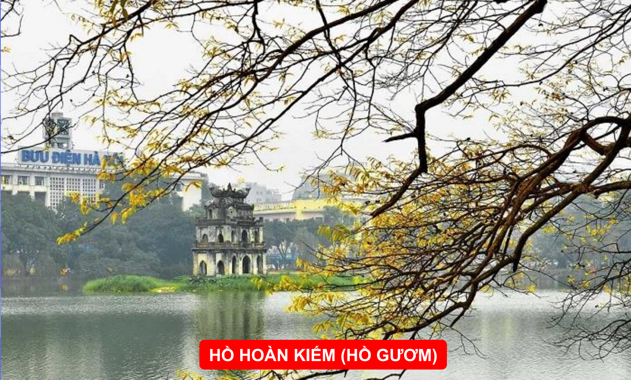
HỒ HOÀN KIẾM (HỒ GƯƠM)