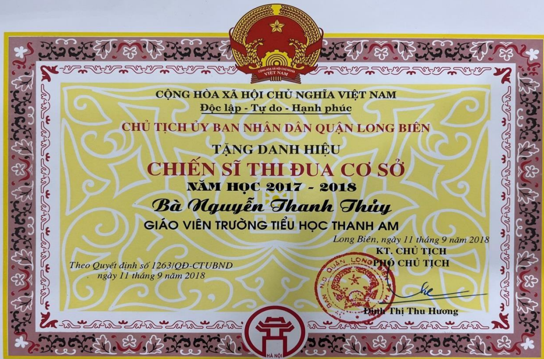
Giấy chứng nhận danh hiệu Chiến sĩ thi đua cấp cơ sở năm học 2017-2018