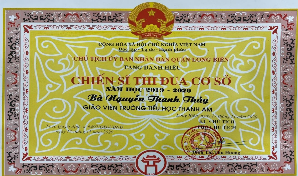
Giấy chứng nhận danh hiệu Chiến sĩ thi đua cấp cơ sở năm học 2019-2020