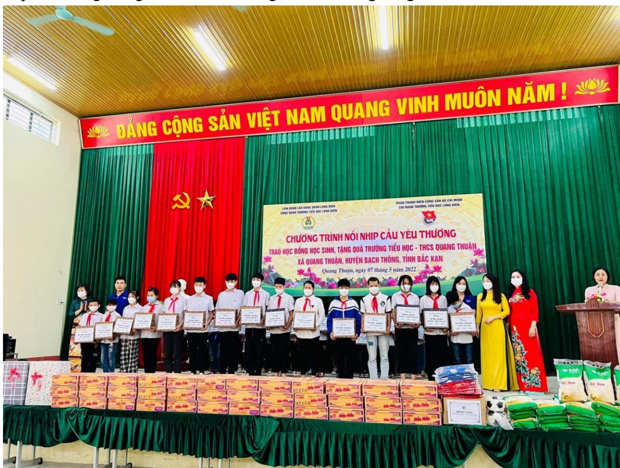
Đ/c CTCD và đ/c Hiệu trưởng trao quà cho HS có hoàn cảnh khó khăn tại trường Tiểu học – THCS Quang Thuận xã Quang Thuận huyện Bạch Thông Bắc Kạn