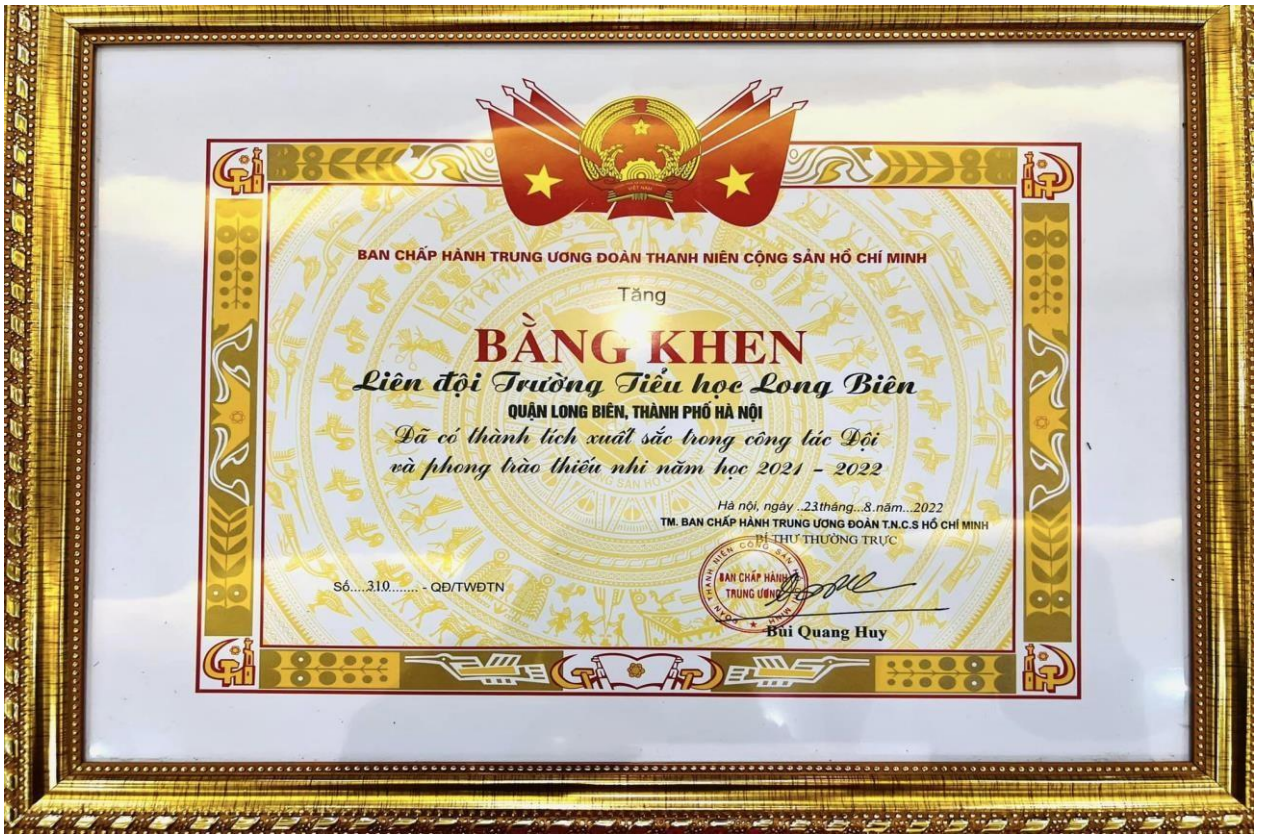
Liên đội nhận Bằng khen của Trung ương đoàn năm học 2021-2022