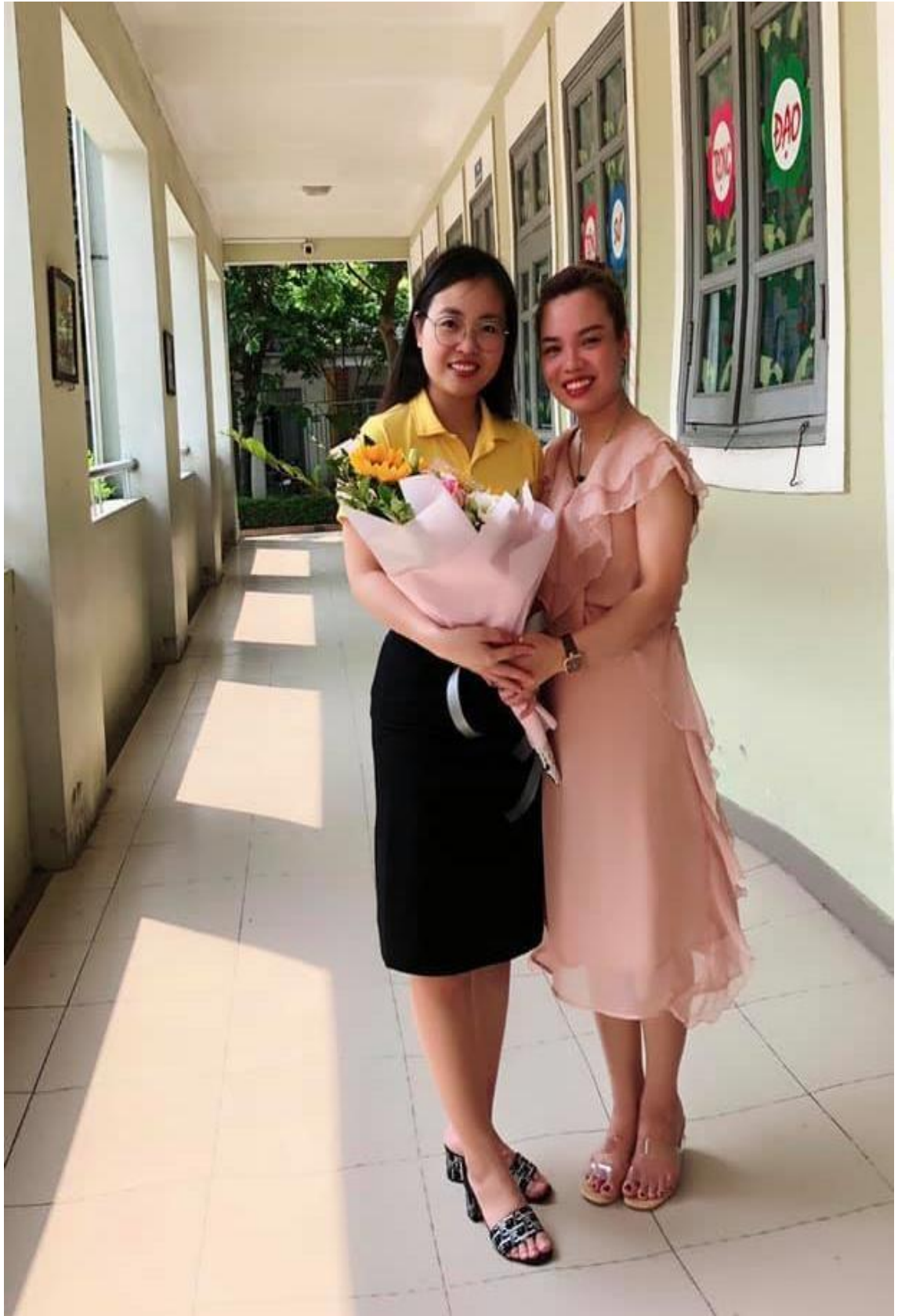
Được phụ huynh tin tưởng và mến mộ