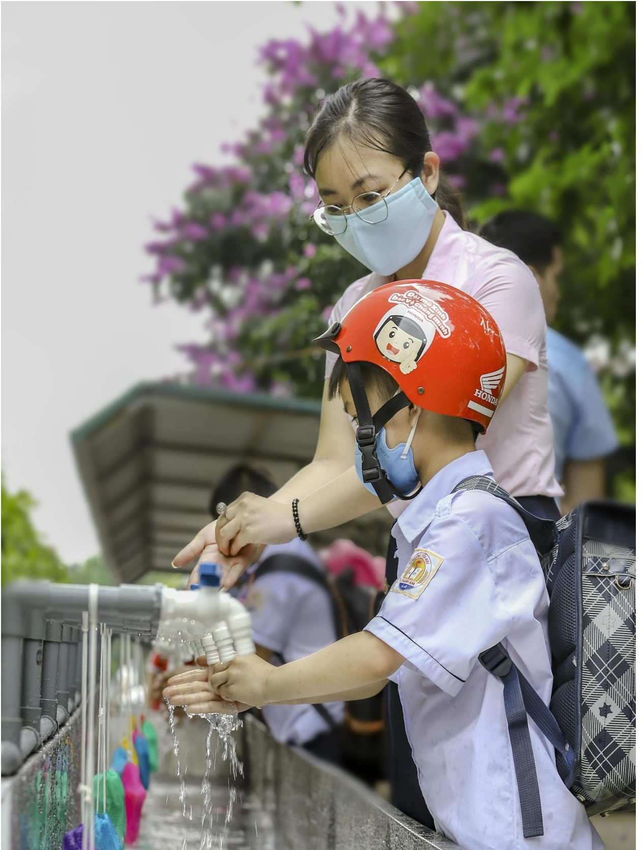
Quan tâm học sinh từ những điều nhỏ nhất.