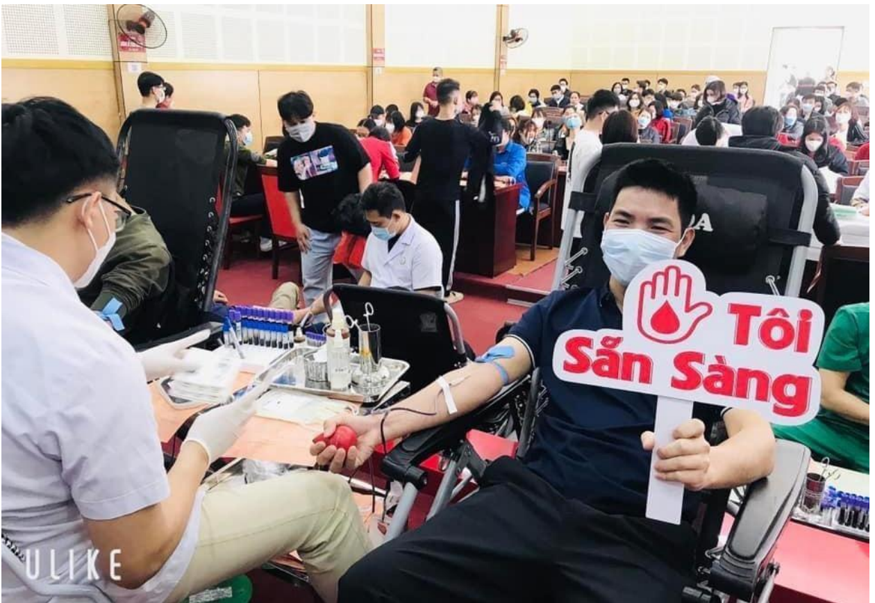
Cũng là lần hiến máu đầu tiên của bạn em