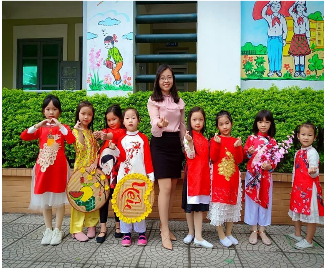
Đồng hành cùng học sinh trong mọi hoạt động