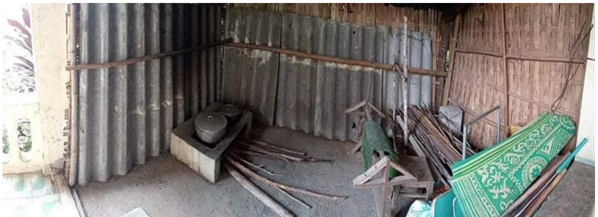
Căn bếp điểm trường Nà Hin trước khi được xây mới