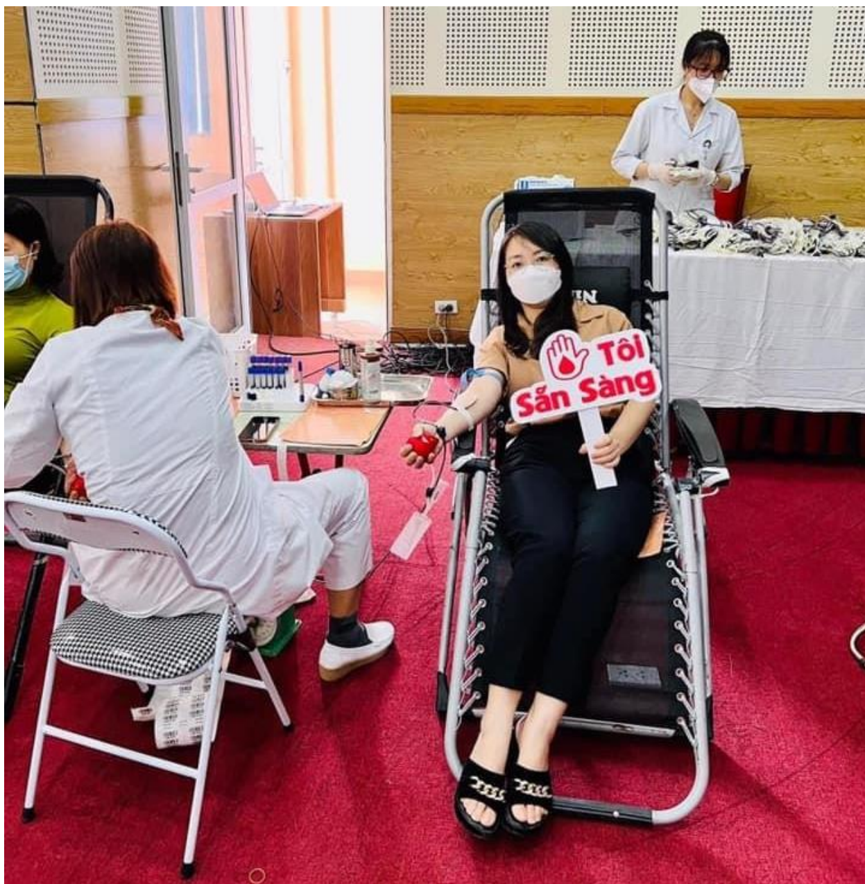
Lần hiến máu thứ 8 của em tại Ngày hội hiến máu của phường Long Biên

Em còn tích cực, đi đầu trong mọi hoạt động công đoàn, em đã hiến máu 10 lần và luôn kêu gọi bạn bè, người thân tham gia hiến máu. Trong dịp 26 tháng 3 năm 2022, tại Ngày hội Giọt hồng Long Biên do UBND phường Long Biên phối hợp với trường Tiểu học Long Biên tổ chức, em đã vận động được 24 đoàn viên công đoàn nhà trường và 195 phụ huynh học sinh tham gia hiến máu. Nhờ vậy, ngày hội đã diễn ra tốt đẹp, thu được hơn 300 đơn vị máu.