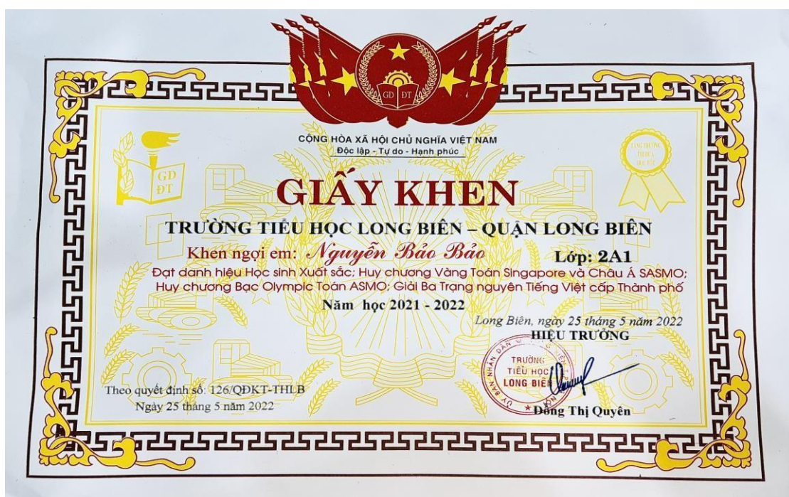
Giấy khen của 2 cháu Bảo Phúc và Bảo Bảo