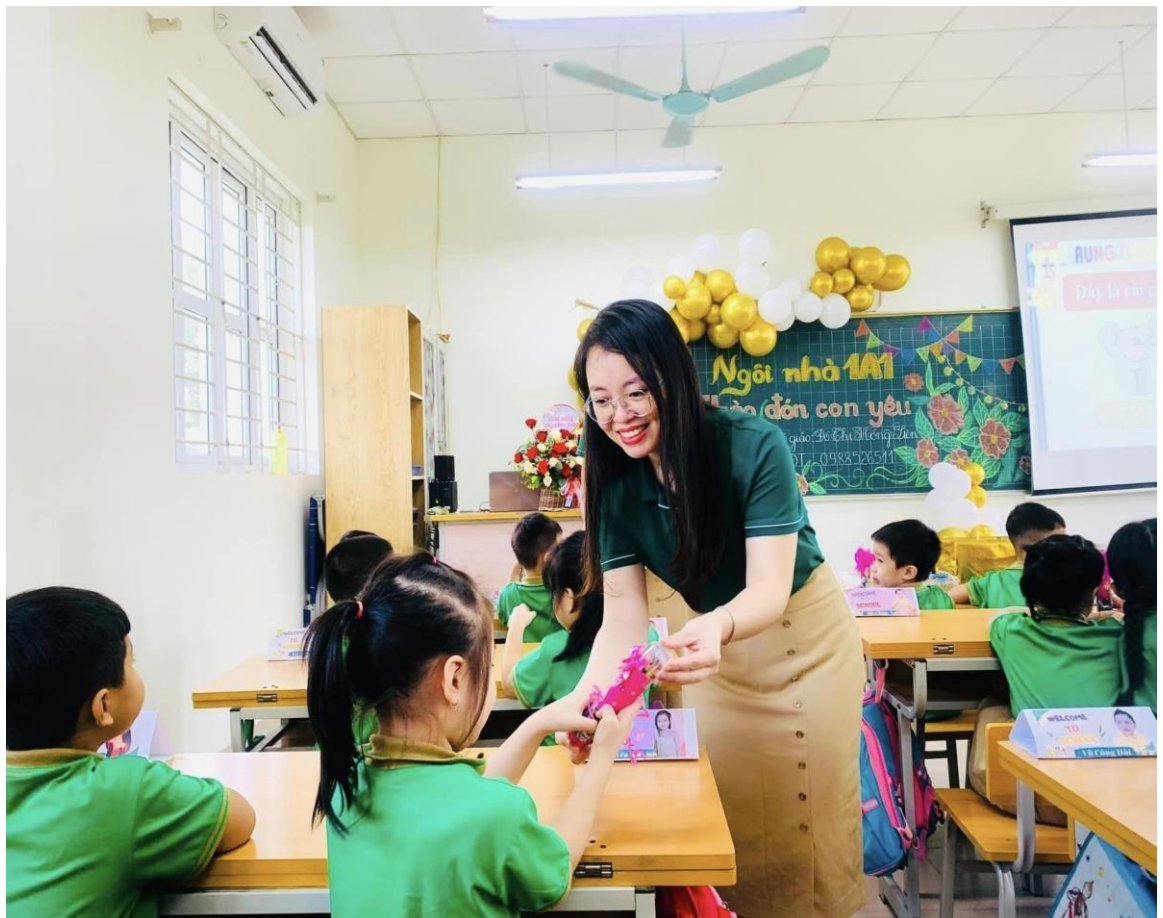
Nụ cười thể hiện tình yêu thương