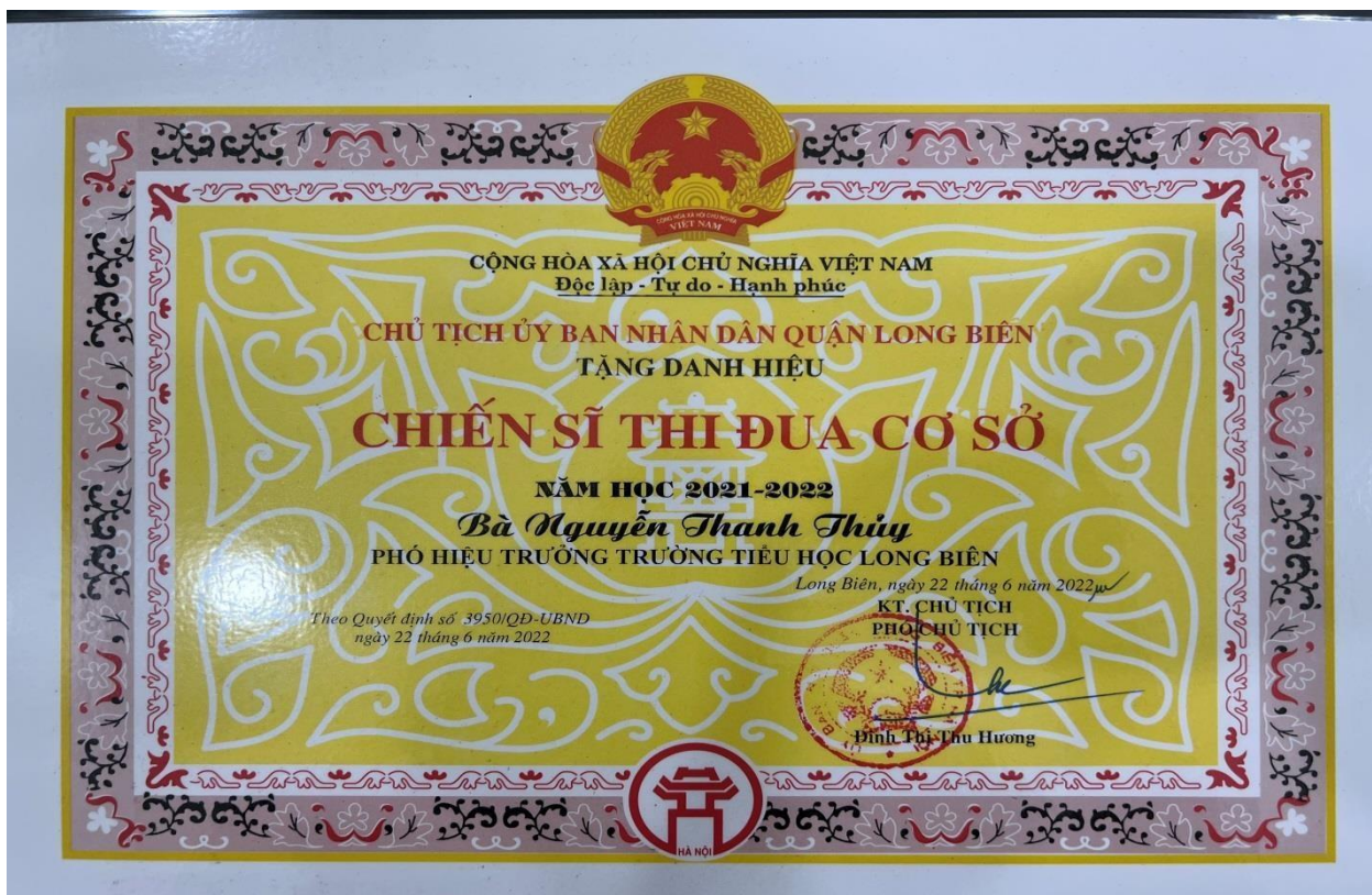
Giấy chứng nhận danh hiệu Chiến sĩ thi đua cấp cơ sở năm học 2021-2022