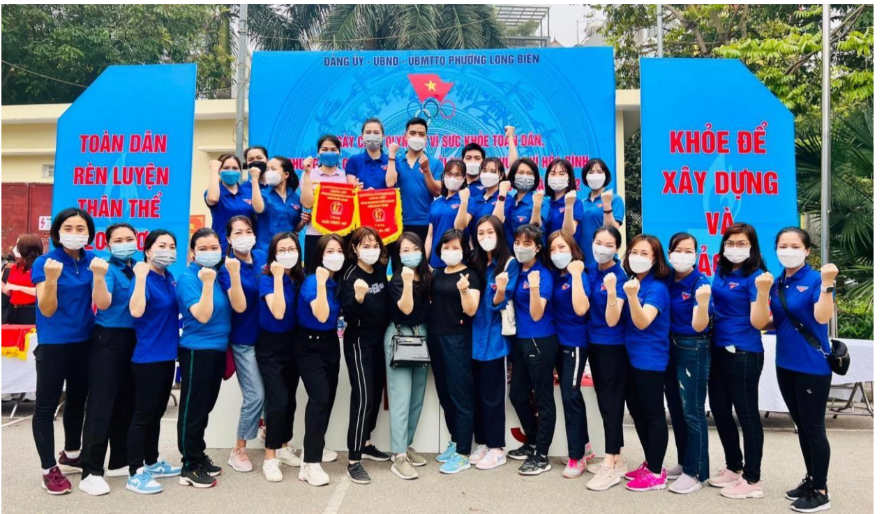
Động viên đoàn thanh niên thi chạy giải báo Hà Nội mới

Đồng chí Chủ tịch công đoàn của Tiểu học Long Biên của chúng tôi luôn có mặt kịp thời để động viên, cổ vũ cho công đoàn viên nhà trường trong mọi hoạt động.