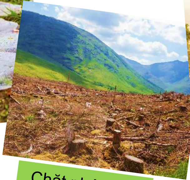
Chặt phá rừng