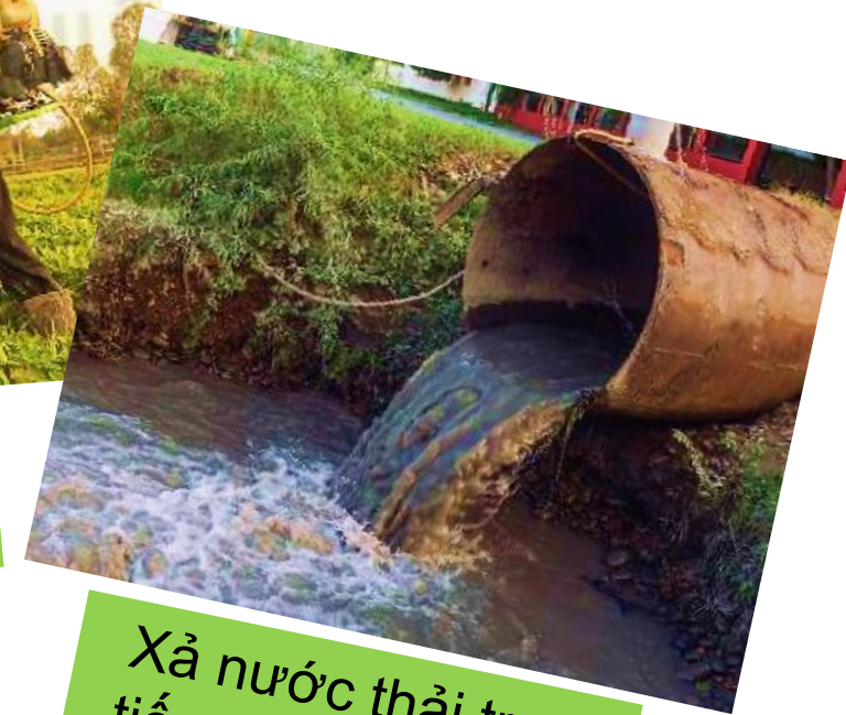
Xả nước thải trực tiếp ra môi trường