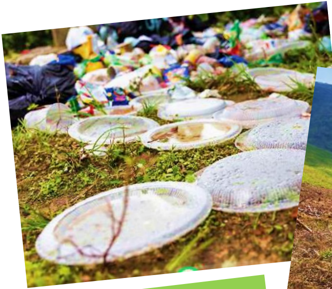
Vứt rác bừa bãi