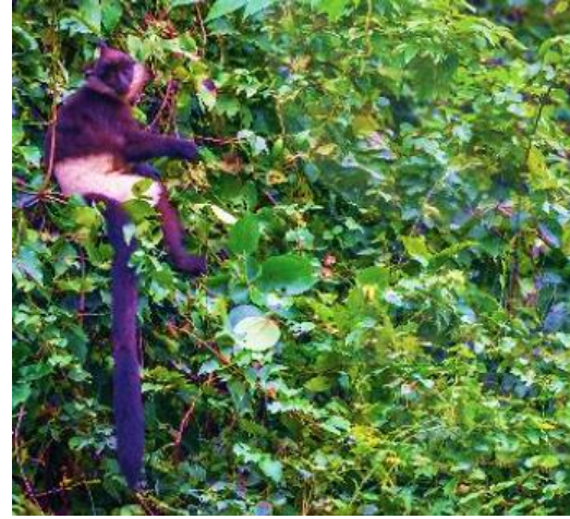
Bảo tồn thiên nhiên