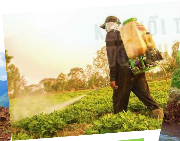
Sử dụng thuốc trừ sâu