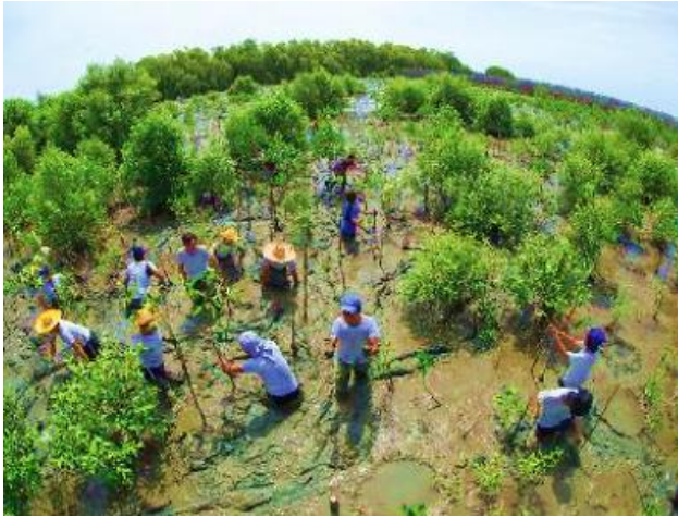
Trồng và chăm sóc rừng

Quan sát và kể tên việc làm trong mỗi hình sau. Những việc làm đó mang lại lợi ích gì cho môi trường sống của thực vật và động vật?