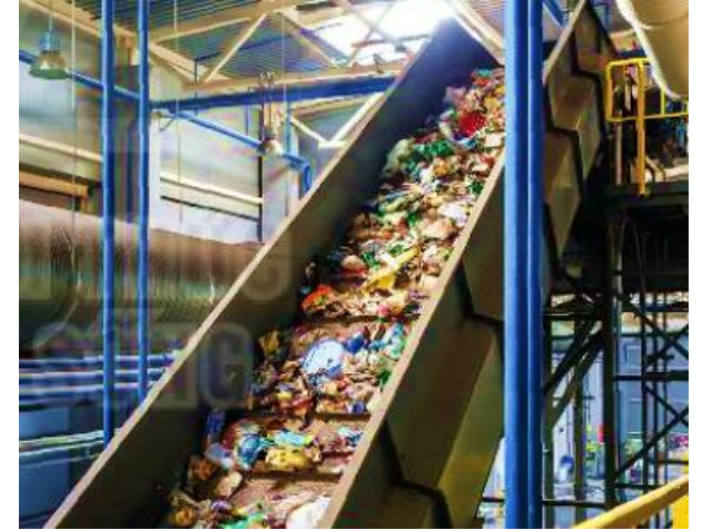
Xử lý rác thải

→ Các việc làm trên giúp cho môi trường sống của thực vật và động vật được xanh sạch đẹp hơn, bảo vệ sức khỏe của động vật, thực vật cũng như bảo vệ thiên nhiên, trái đất.