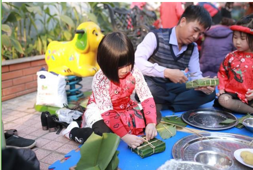
Gói bánh chưng