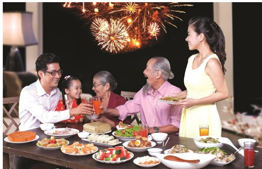
Đón giao thừa