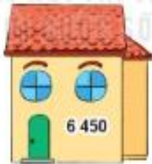
Nhà của Mai