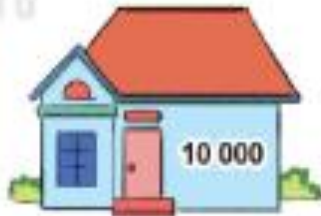
Nhà của Nam