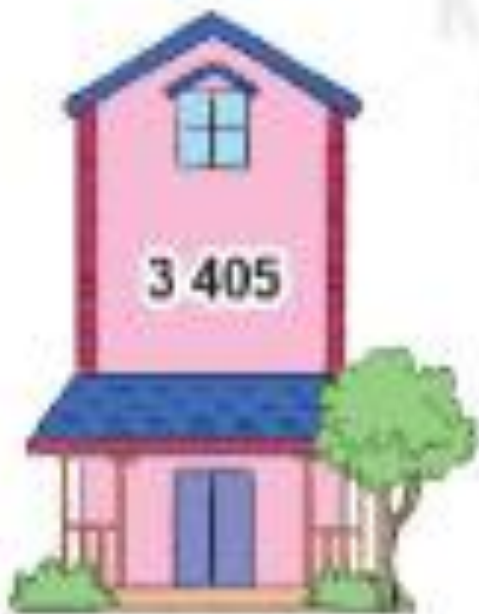
Nhà của Việt