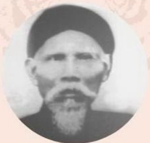
Lương Văn Can (1854-1927)

Danh sỹ triều Nguyễn. Có bộ Lịch triều hiến chương loại chí, đến nay được hầu hết giới học thuật khen ngợi là công trình bách khoa.