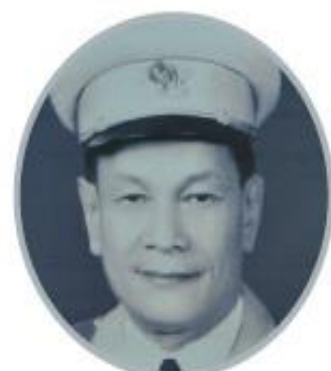
Phạm Quang Thanh

Nhà thơ, bút danh Hàn Mặc Tử. Ông để lại cho đời nhiều tập thơ xuất sắc.