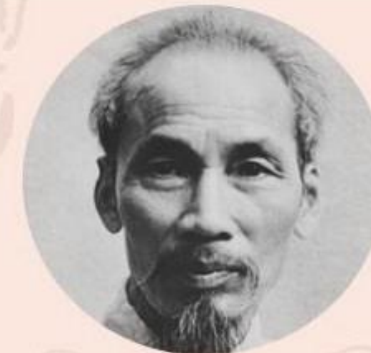
Hồ Chí Minh (1890-1969)

Một trong số người sáng lập ra trường Đông Kinh Nghĩa Thục năm 1907