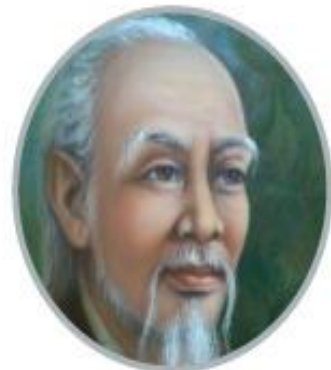
Hải Thượng Lãn Ông

Lý Thái Tông là vị hoàng đế thứ hai của triều đại nhà Lý, lên ngôi hoàng đế năm 1028