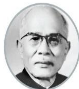
Tôn Đức Thắng

Chí sĩ, Danh sĩ, Kiến trúc sư, quê Nghệ An. Ông để lại hơn 14 bản trần tình khá về quốc kế dân sinh và khá nhiều bài thơ hay được truyền tụng.