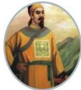
Lý Thái Tông