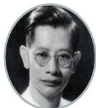
Trần Duy Hưng

Là nhà cách mạng lớn của Việt Nam. Từ 9/1969-1980 ông giữ chức Chủ tịch nước cho đến khi từ trần.