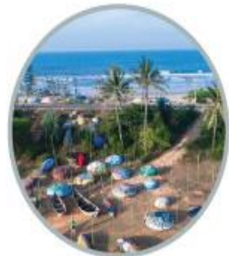
Nguyễn Trường Tộ

Chí sĩ yêu nước, tự Quang Viễn, hiệu Tinh Trai, quê làng Xuân Đài, huyện Diên Phước, tỉnh Quảng Nam.