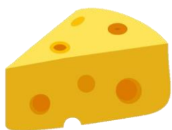
A. Pho mát