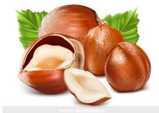
B. Hạt dẻ