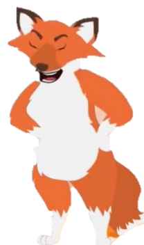
C. Cáo già