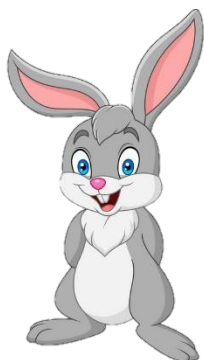
A. Thỏ xám

Ai đã ăn gần hết miếng pho mát của anh em gấu?