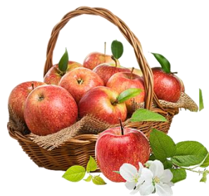
C. Trái cây

Ai đã ăn gần hết miếng pho mát của anh em gấu?