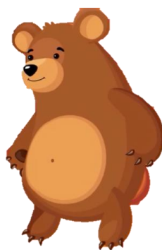
B. Gấu mẹ