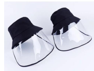
Mũ chống giọt bắn