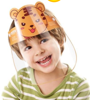
Kính chắn giọt bắn