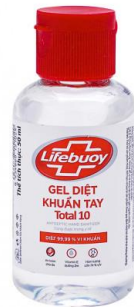
Nước rửa tay khô