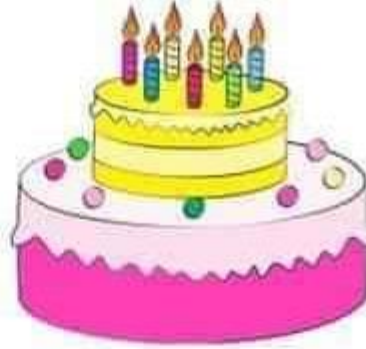
Một cái bánh sinh nhật