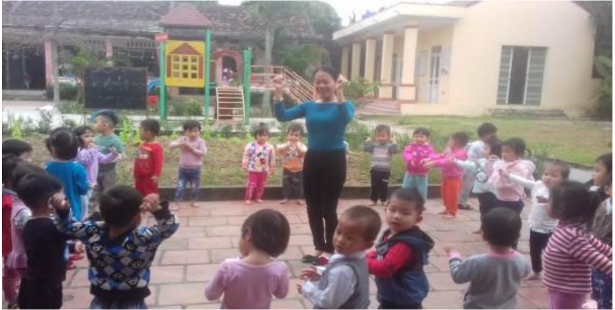
Hình ảnh 10: Trẻ hát giờ dạo chơi ngoài trời.