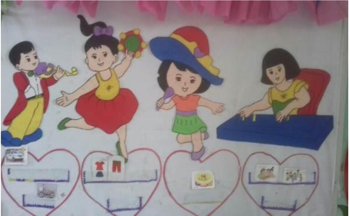
Hình ảnh 6: Khu vực hoạt động âm nhạc