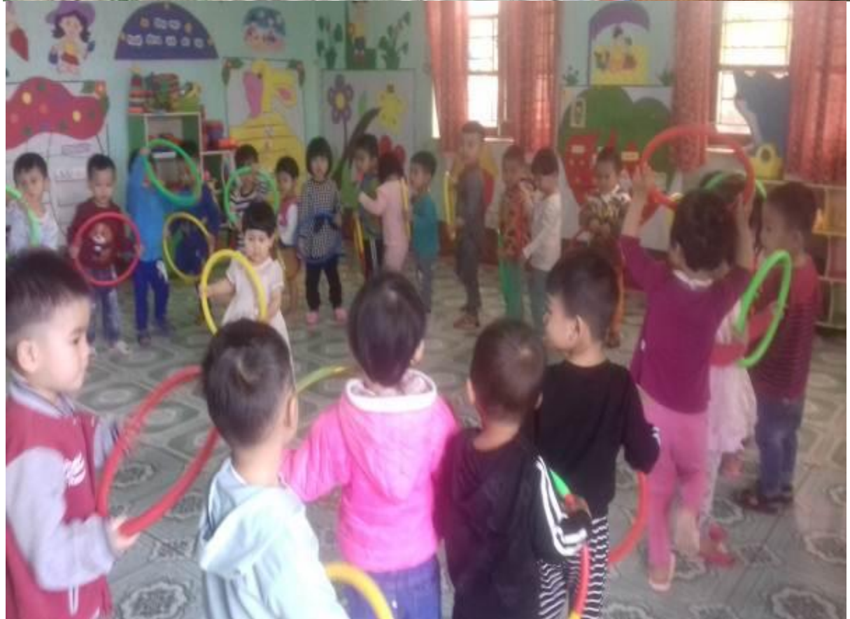
Hình ảnh 5: Trẻ hoạt động dưới nhiều hình thức