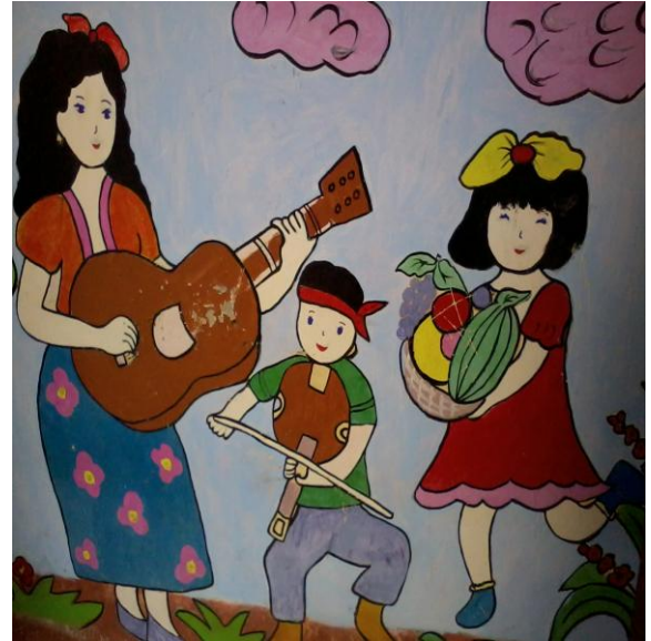
Hình ảnh 8: Hình ảnh âm nhạc ngoài lớp học