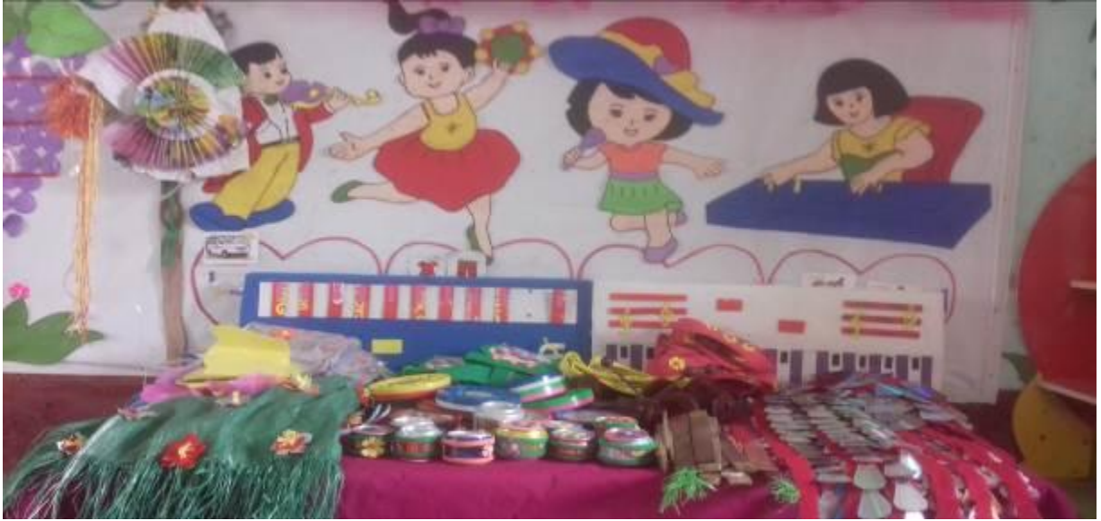
Hình ảnh 1: dụng cụ âm nhạc