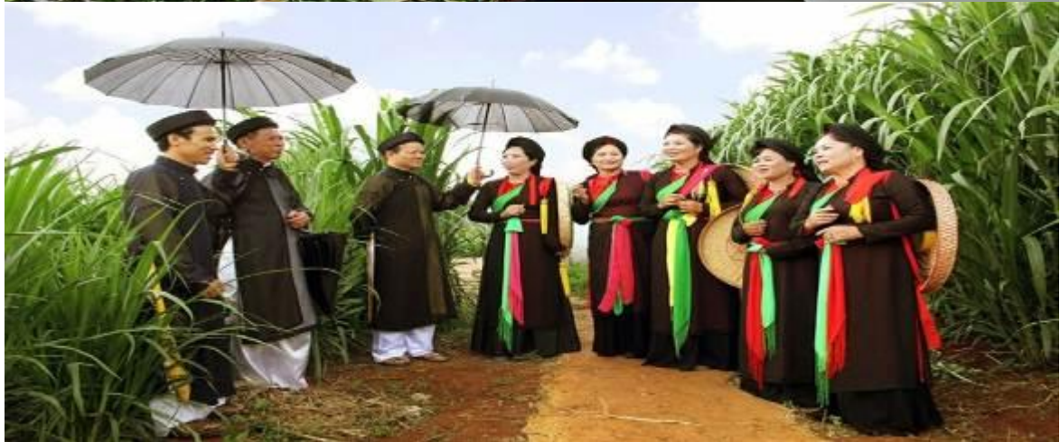
Hình ảnh 2: Hát dân ca quan họ Bắc Ninh