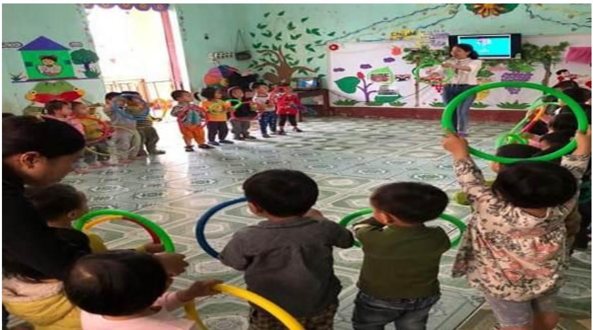
Hình ảnh 4: Trẻ cầm vòng hát vận động “Em tập lái ô tô”