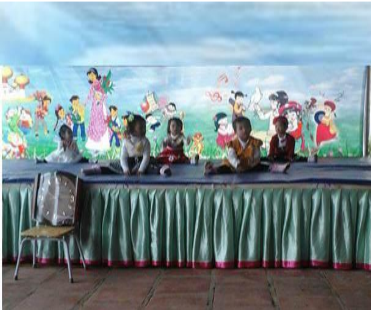
Hình ảnh 11: Trẻ biểu diễn văn nghệ