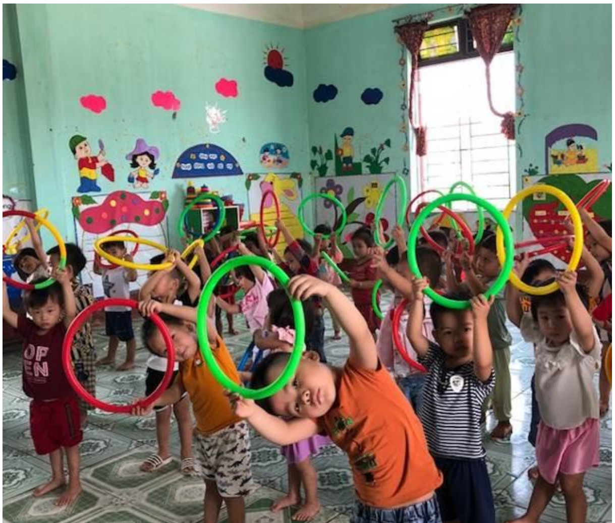
Hình ảnh 9: Trẻ tập thể dục theo nền nhạc