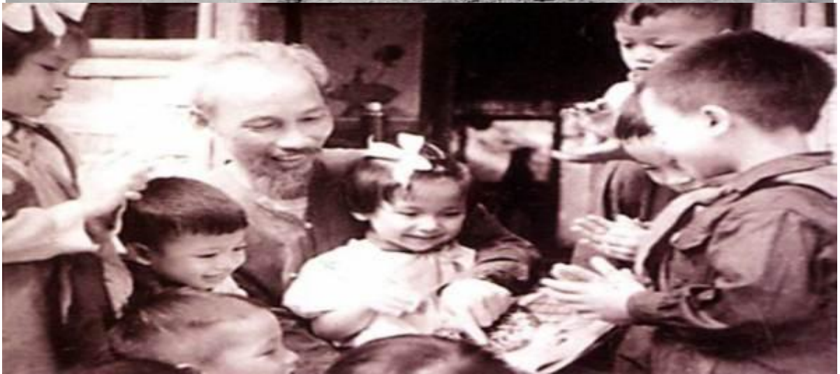
Hình ảnh 3: Bác Hồ với các cháu thiếu nhi.