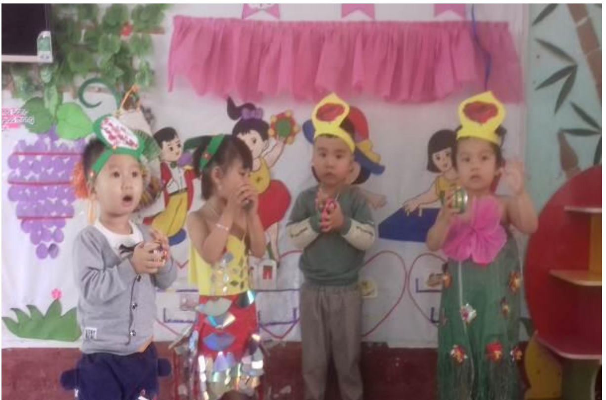
Hình ảnh 7: Trẻ biểu diễn ở khu vực âm nhạc