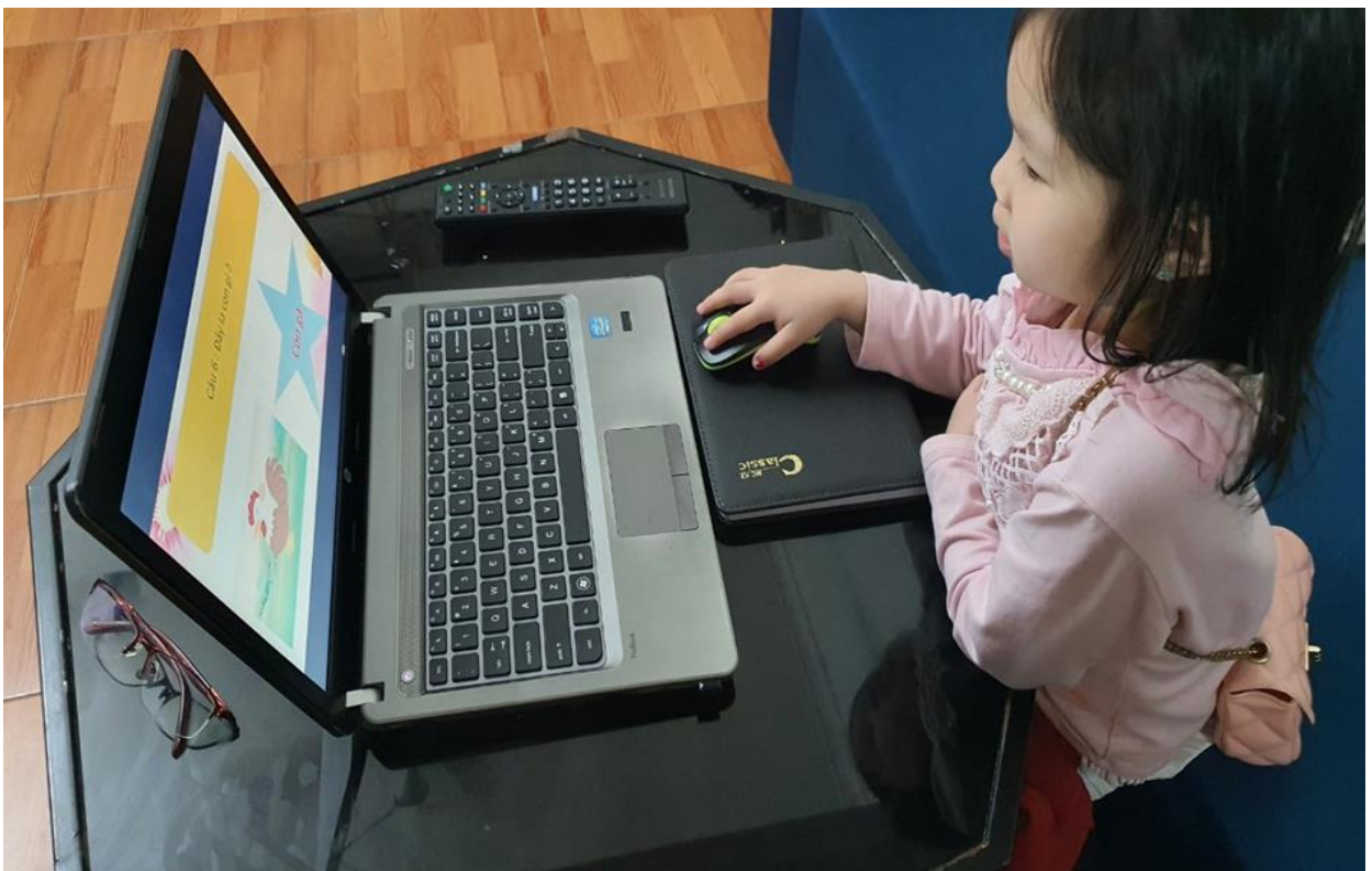
Hình ảnh 6: Trẻ tham gia trò chơi “Ô cửa bí mật” tại nhà