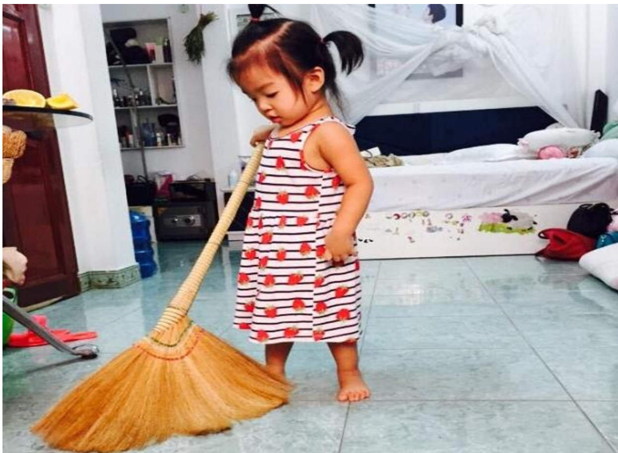
Hình ảnh 1: Trẻ biết phụ giúp bố mẹ các công việc nhà