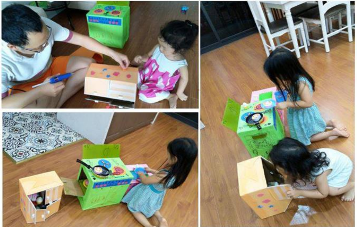
Hình ảnh 8-9: Hình ảnh phụ huynh làm đồ chơi và chơi cùng con