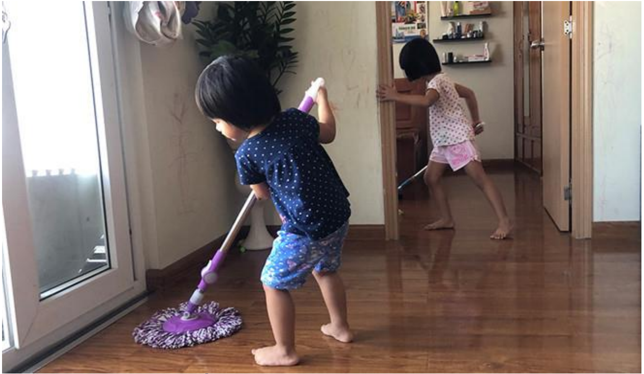
Hình ảnh 3: Trẻ biết làm các công việc tự phục vụ vừa sức với bản thân