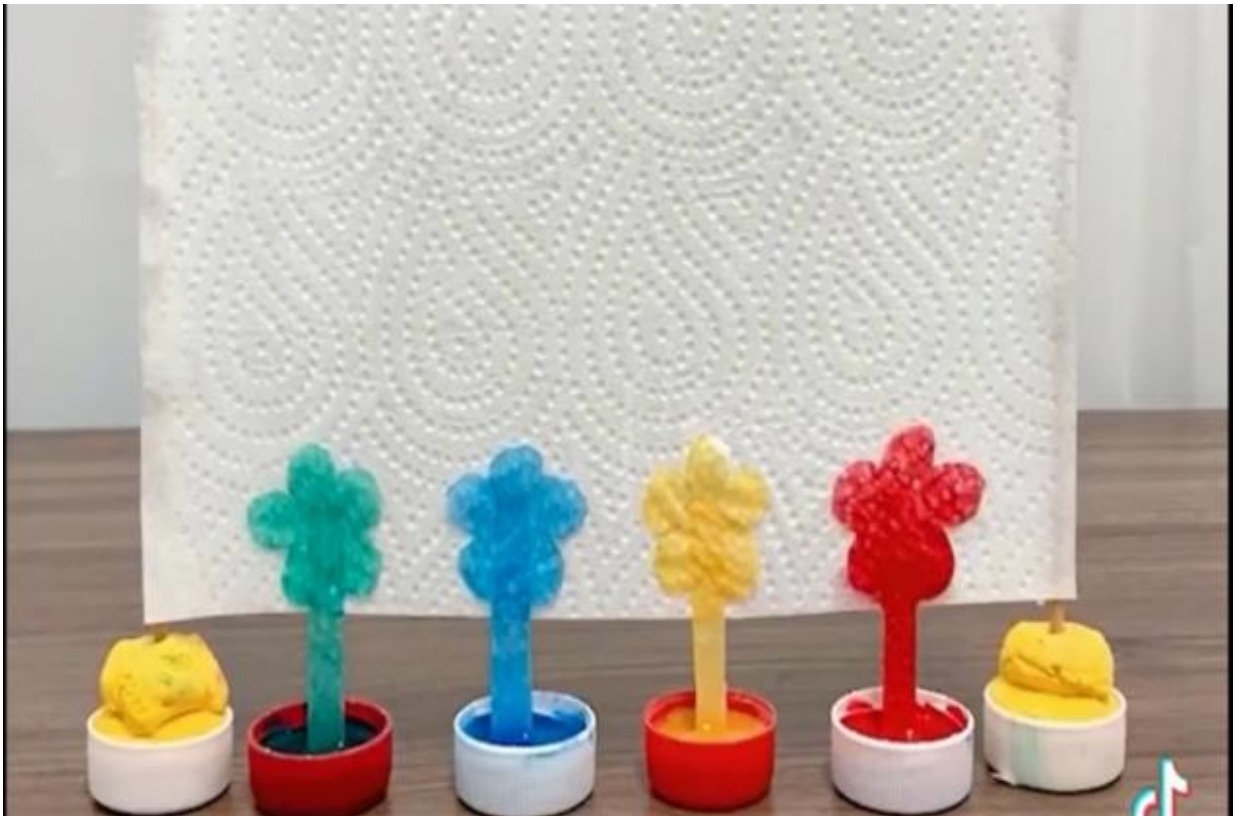
Hình ảnh 5: Thí nghiệm “Giấy thấm màu”