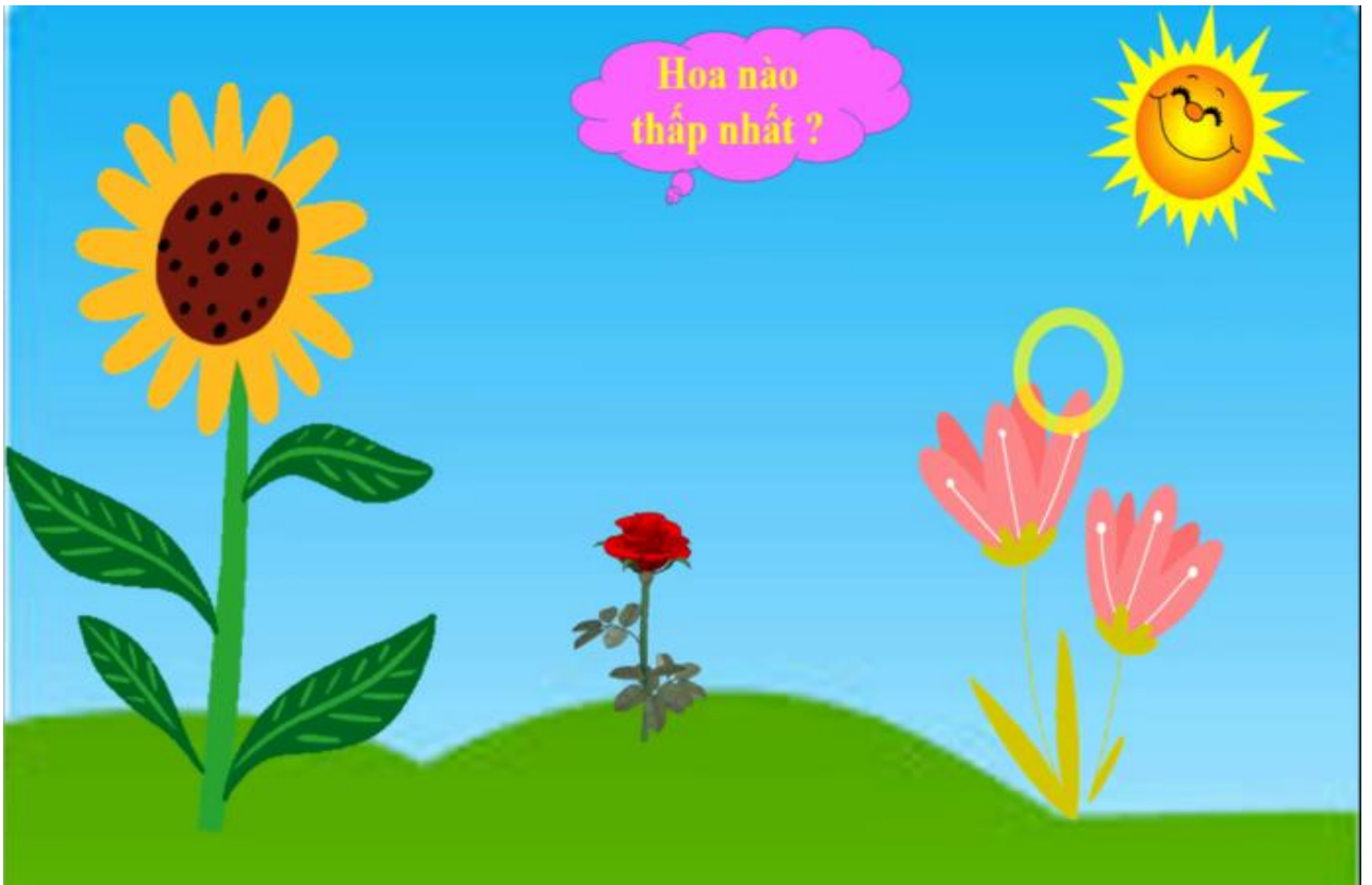
Hình ảnh 4: “Trò chơi cây cao - cây thấp