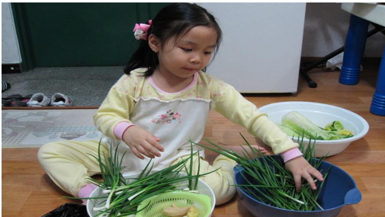
Hình ảnh 2: Trẻ biết giúp bố mẹ các công việc phù hợp với bản