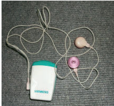
Máy trợ thính hộp