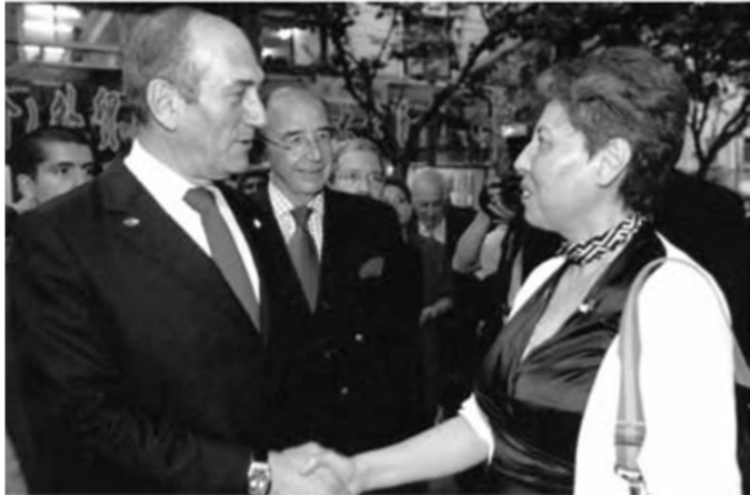
Của cái của tôi là sự hiểu biết.

Chính vì vậy, người Do Thái rất chú trọng bồi dưỡng kỹ năng sinh tồn và quán triệt tư tưởng “không làm không hưởng” đối với con cái ngay từ khi chúng còn nhỏ. Khi mới đến Israel, tôi cho rằng, chỉ có các gia đình có điều kiện kinh tế kém mới giương cao khẩu hiệu: Muốn tiêu tiền thì hãy tự kiếm! Sau này, khi làm thuê cho một gia đình rất giàu có, tôi mới hiểu rằng, hóa ra các vị phụ huynh Do Thái càng giàu có lại càng chú trọng giáo dục sinh tồn cho con. Gia đình mà tôi làm thuê có một cậu con trai đang học tiểu học, mặc dù trong nhà không thiếu gì siêu xe, nhưng những chiếc ô tô đó không hề được dùng để đưa đón cậu bé tới trường. Bất luận mưa gió thế nào, nó cũng tự đi xe buýt về nhà. Nếu cậu bé muốn thay đôi giày đá bóng đã cũ, cha mẹ sẽ đề nghị mỗi buổi tối cậu bé rửa bát đĩa để lấy tiền mua giày. Họ nói rằng, làm vậy mới khiến con cái cảm nhận được những đắng cay ngọt bùi của cuộc sống.