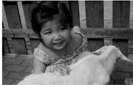
Cô cháu gái ngây thơ trong sáng.

Tôi rất biết ơn cuộc sống, biết ơn sự giao thoa giáo dục giữa người Do Thái và người Trung Quốc, khiến cho các con tôi có những cuộc lột xác kỳ diệu, nó lên men trong tính cách của chúng, giúp chúng đạt được thành tựu trong sự nghiệp từ khi còn trẻ. Đồng thời, điều đó cũng minh chứng cho những giá trị to lớn trong phương pháp giáo dục gia đình của tầng lớp Do Thái trung lưu, mặc dù nó đã bị một bà mẹ Do Thái sinh ra và lớn lên ở Thượng Hải như tôi “Trung Quốc hóa”, nhưng vẫn phát huy hiệu quả.