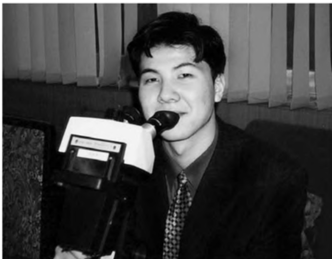
Tài năng mới nổi.

Trước lúc ra về, ông chủ bảo Huy Huy: “Ngày mai nếu cậu không bận thì lại tới đây một chuyến nhé.”