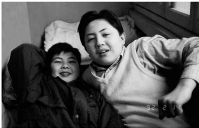
Niềm vui không gì sánh được của hai anh em

Dĩ Hoa thừa hưởng năng khiếu vẽ từ tôi, thẳng bé mau chóng phác họa dáng vẻ của cậu em trai đang nằm bò ra nền nhà, ăn cơm.