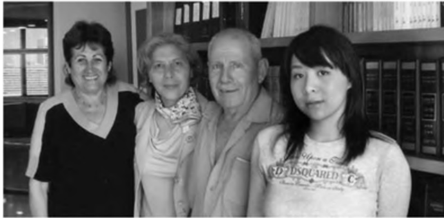
Hội Liên hiệp các gia đình Israel

Từ đó có thể thấy, Maksim Gorky nói rất đúng “sinh con là việc ngay cả gà mái cũng biết làm, nhưng yêu con lại là việc khác”, một khi tình yêu thương cha mẹ dành cho con cái được khoác thêm nhân tố giáo dục, thì tình yêu không còn đơn giản như trước nữa, cha mẹ chỉ biết thỏa mãn vô hạn yêu cầu của con thì không bao giờ là đủ cả, họ cần phải có lý trí và kỹ thuật khi đáp ứng mong muốn của chúng.