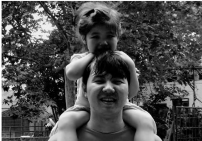
Hai cha con nô đùa vui vẻ.

Người Do Thái có một phương pháp đặc biệt về giáo dục kỹ năng quản lý tài sản cho con cái, họ bắt đầu triển khai các bài học quản lý tài sản gia đình từ khi trẻ ba hoặc bốn tuổi, đó dường như đã thành thông lệ của cả dân tộc.