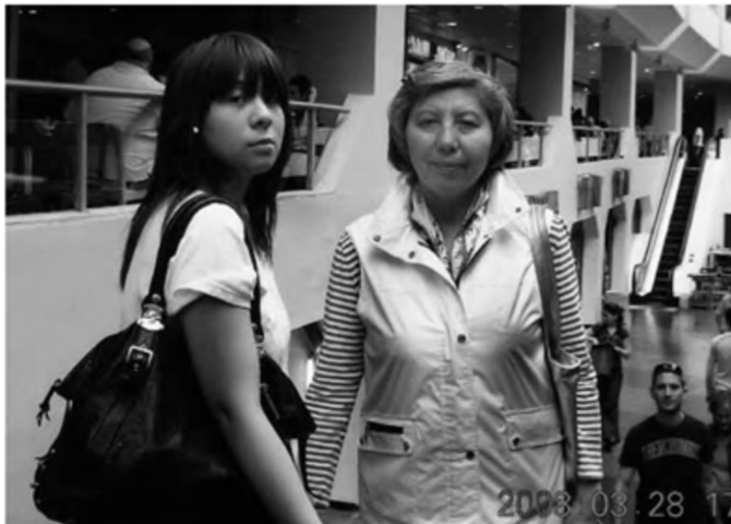
Cô con gái mới lớn nhà tôi.

Người Do Thái cho rằng, ham muốn của con người là vô hạn, nhưng chúng ta chỉ có thể thỏa mãn được rất ít, còn vô số ham muốn khác thì vĩnh viễn không thể đáp ứng được. Chính vì vậy, họ muốn con em mình hiểu: Phạm vi hưởng thụ của mỗi người đều có giới hạn, bỏ ra một đồng thì phải biết phát huy hết giá trị của một đồng ấy. Dù con có bao nhiêu tiền đi nữa cũng tuyệt đối không được mua những thứ không cần thiết và không phù hợp với mình. Còn nếu con muốn thỏa mãn những mong muốn xa xỉ hơn, thì con bắt buộc phải có điều kiện sống tốt hơn nữa dựa vào sự nỗ lực của chính mình, chứ không thể mượn tay người khác.