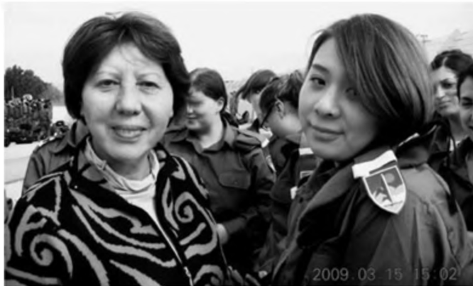
Con gái tôi làm “Hoa Mộc Lan”

Phòng đột lại kèm theo mưa gió suốt mấy đêm liền làm Muội Muội nhà tôi càng sợ khổ, con bé gặp không ít phiền phức. Một sự việc giúp con rút ra được nhiều bài học nhất là, ngày thứ hai con gái tôi tới doanh trại báo cáo có mặt, tối hôm trước, nó chuẩn bị không tốt, vì chỉ mãi cần nhằn oán trách, nên hôm sau đi con bé quên mang theo chăn, trong khi doanh trại quân đội của Israel không có chăn, yêu cầu học viên tự mang đến.