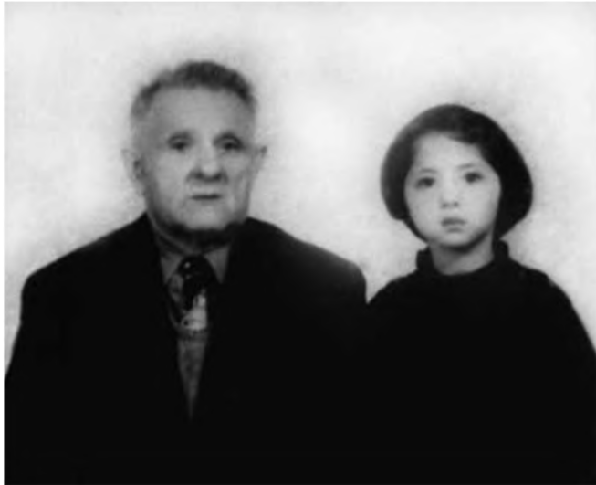
Bức ảnh chụp chung quý giá của hai cha con tôi lúc ông cụ còn sống. .

Dựa vào chính tính cách bền bỉ, chịu khó cùng với sự từng trải của một người Do Thái điển hình, cha tôi đã sống trong sung túc, bình an suốt hơn hai mươi năm làm khách trên đất Thượng Hải. Trong mớ ký ức hỗn độn thời thơ ấu, tôi còn nhớ nhà mình ở giữa một cái sân đẹp như vườn hoa, xung quanh là bãi cỏ xanh mướt, phía trên điểm xuyết những bông hoa dại nhỏ xíu. Tôi thường tung tăng hái hoa đuổi bướm cả ngày trong sân và hay đội lên đầu những vòng hoa giống như thiếu nữ Hy Lạp xa xưa. Nền giáo dục pha trộn là những gì tôi được tiếp nhận khi đó. Ở trường, tôi và những người bạn của mình được dạy theo phương pháp giáo dục tiểu học của chủ nghĩa xã hội, tôn thờ chủ nghĩa cộng sản, chúng tôi nói được tiếng phổ thông, tiếng Thượng Hải, thậm chí cả tiếng Tô Bắc. Còn ở nhà, những người tôi tiếp xúc đều là người Do Thái thuộc Hội Liên hiệp người Do Thái, tôi giao tiếp với họ bằng tiếng Anh. Cha tôi thường dạy tôi một số lễ nghi phong tục và tín ngưỡng tôn giáo của quê hương, ông còn dạy tôi tiếng Hebrew cổ.