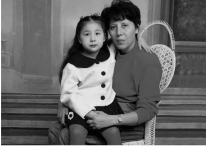
Muội Muội là chiếc áo bông nhỏ của tôi.

tâm thường ”... Nghệ thuật yêu con sâu sắc của người Do Thái không chỉ phát huy tác dụng quan trọng trong bước ngoặt cuộc đời của các con tôi, ngay đến bản thân tôi cũng nhận được lợi ích là làm một bà mẹ yêu con có thành tựu. Từ Vạn Lý Trường Thành đến dãy Alps, tôi cảm ơn sự giao thoa giáo dục giữa hai quốc gia Trung Quốc và Israel làm tôi tỉnh ngộ: Đừng vì chúng ta không biết cách yêu thương con mà biến chúng thành những kẻ tầm thường và khiếm khuyết.