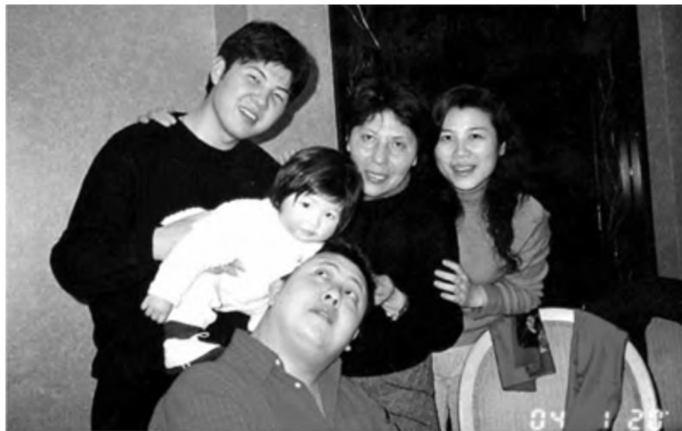
Ba thế hệ của một gia đình cùng yêu thương gắn bó.

“Trì hoãn thỏa mãn” là một trong những phương pháp giáo dục quan trọng của các bậc phụ huynh Israel.