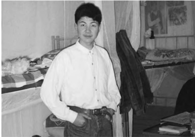
Triệu phú thế giới đi lên từ nghèo khổ.

Trong bầu không khí giáo dục như vậy, nếu con cái của người Do Thái không mấy thông minh, chúng cũng sẽ không ngừng tìm tòi, học hỏi, rèn luyện để hiểu biết cạnh kẽ về một lĩnh vực nào đó và cuối cùng đạt được thành tích cao hơn người khác một bậc, bao gồm cả phương diện học tập. Thành tích học tập của đại đa số học sinh Do Thái đều rất tốt, có một điểm rất quan trọng là các em học sinh bồi dưỡng tinh thần trách nhiệm, kỹ năng quản lý bản thân, sống tích cực và làm việc hiệu quả ngay trong quá trình hun đúc, giáo dục sinh tồn.