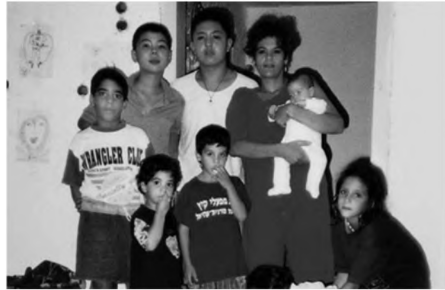
Thế giới vui vẻ của con trai tôi và các bạn nhỏ Israel.

Dù không phải là một người có trình độ học vấn cao nhưng về cơ bản tôi cũng được coi là một người mẹ tri thức.