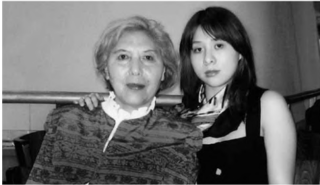
Con gái tôi đã trở thành một thiếu nữ xinh đẹp.

Sau đó hai anh em nó đi bán hàng vặt, chúng ngày càng thích nói chuyện với mọi người và biết quy tắc giao tiếp. Chúng chủ động hỏi các chủ sạp xung quanh có muốn mua một vài món hàng nhỏ của mình hay không và tự biết cân nhắc giá bán cho họ.