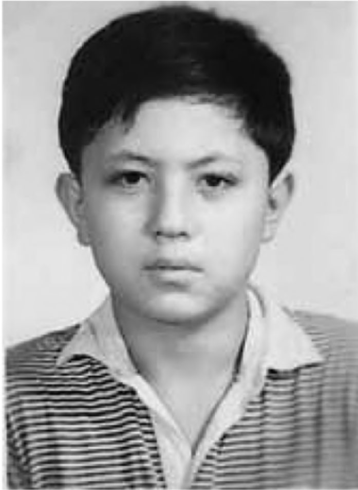
Con trai cả Dĩ Hoa, một thiếu niên khôi ngô.

Hằng ngày, sư tử mẹ đều đưa sư tử em đi săn, sau khi sư tử em ăn no, nó sẽ mang phần thịt còn lại về cho sư tử anh. Từ đó, sư tử anh sống vô cùng sung sướng.