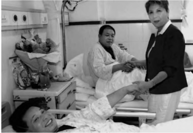
Cuộc sống “tình nguyện” của tôi.

Tại sao ngày nay Trung Quốc lại xuất nhiều nhiều “nô lệ” của con cái đến vậy? Chỉ cần con đưa ra yêu cầu, lúc nào phụ huynh Trung Quốc cũng sẵn lòng đáp ứng nguyện vọng. Khổ nỗi, trẻ con lại chưa có nhận thức đầy đủ về tiền bạc. Những ý nghĩ lệch lạc kiểu như, “bòn tiền từ túi cha”, “tiền là do ngân hàng phát cho” không phải là điều đáng buồn về con trẻ, mà là điều đáng buồn cho cách giáo dục của các bậc cha mẹ Trung Quốc.