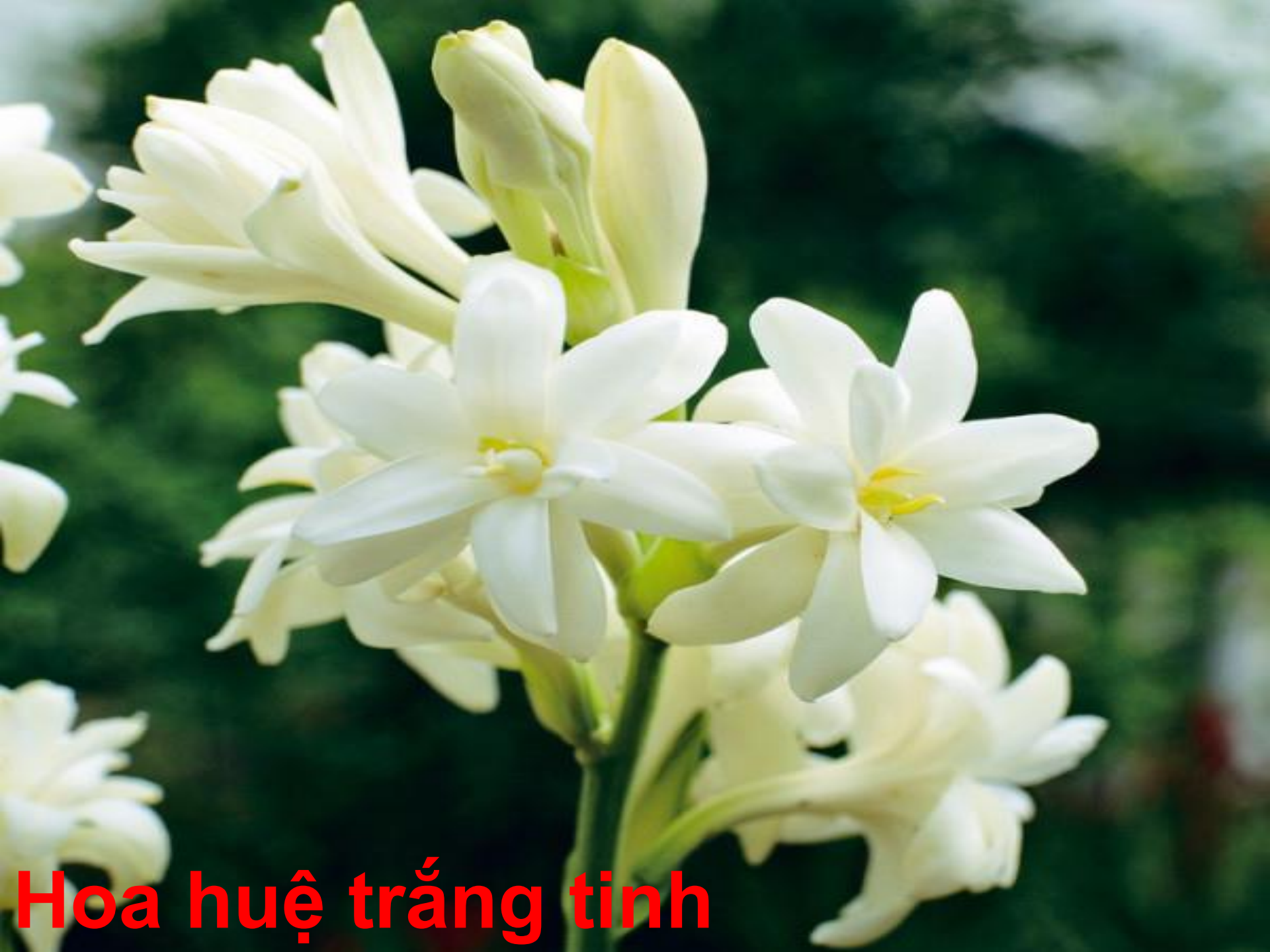
Hoa huệ trắng tinh