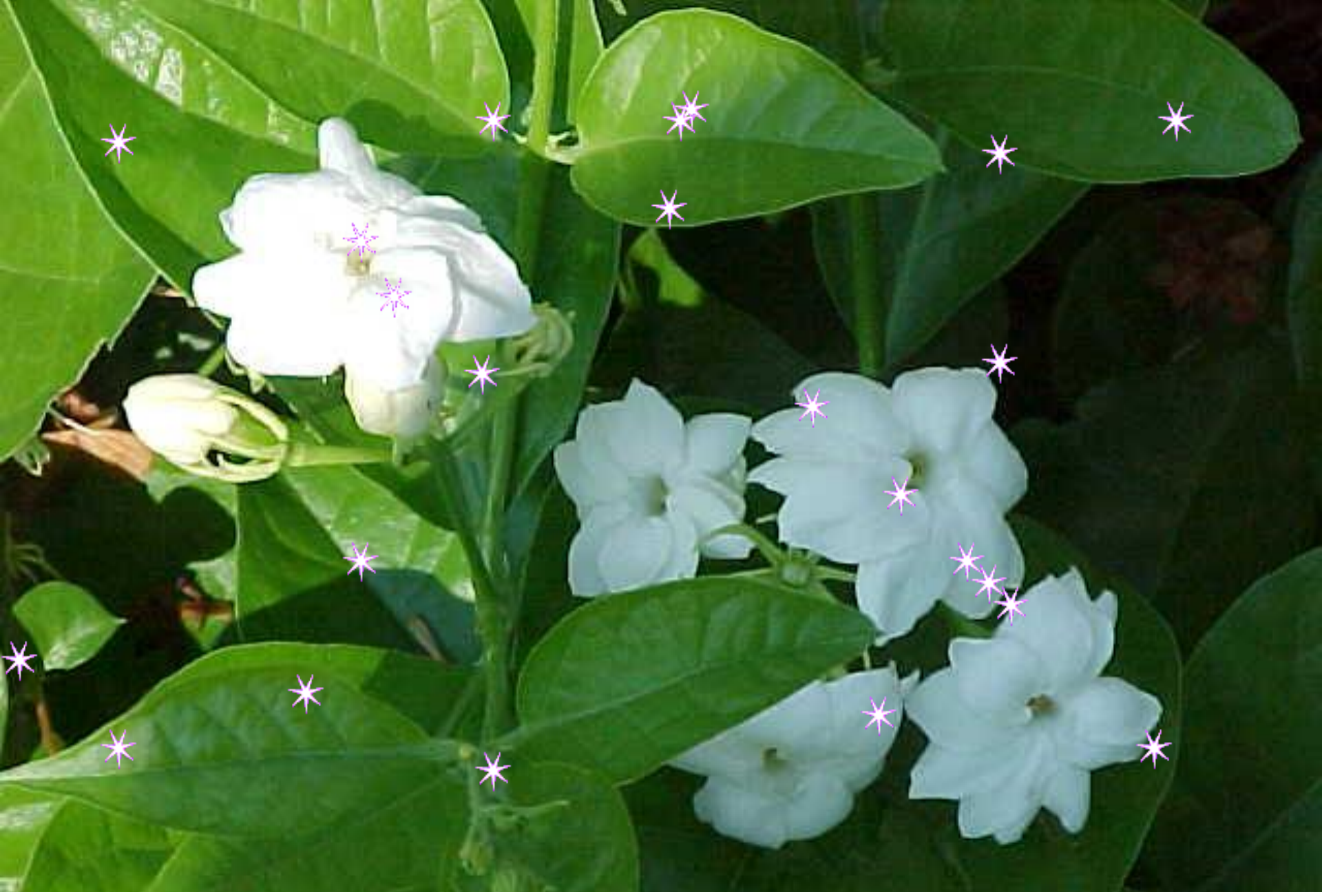
Hoa nhài xinh xinh