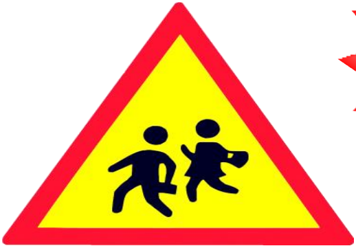
2. Trẻ em