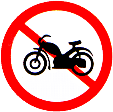
5. Cấm mô tô