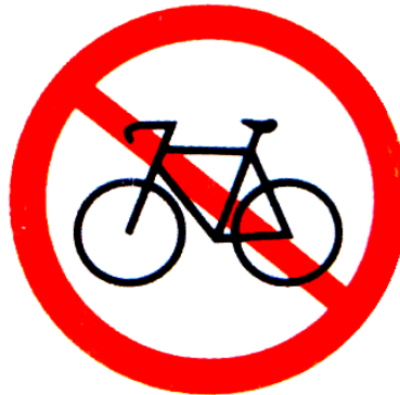
4. Cấm xe đạp