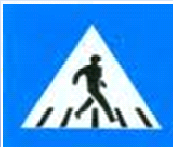
Đường người đi bộ sang ngang