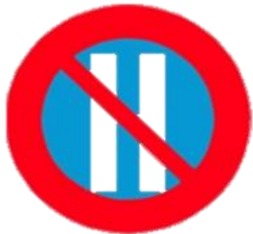
Cấm đỗ xe ngay chặn