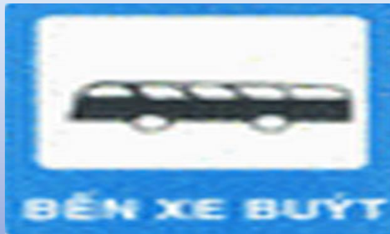
Bến xe buýt