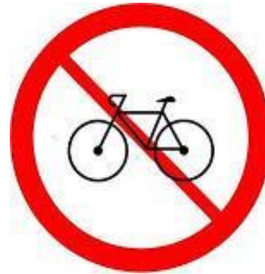
2. Cấm xe đạp