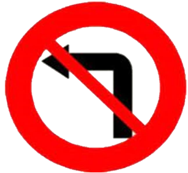
Cấm rẽ trái

- Hầu hết các biển báo cấm có dạng hình tròn, có viền màu đỏ, nền màu trắng, trên nền có một đường gạch chéo màu đỏ và hình màu đen và đặc trưng cho điều cấm.