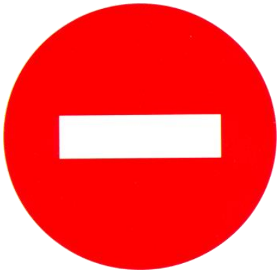
3. Cấm đi ngược chiều