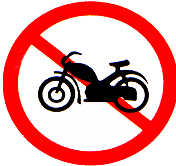
Cấm mô tô