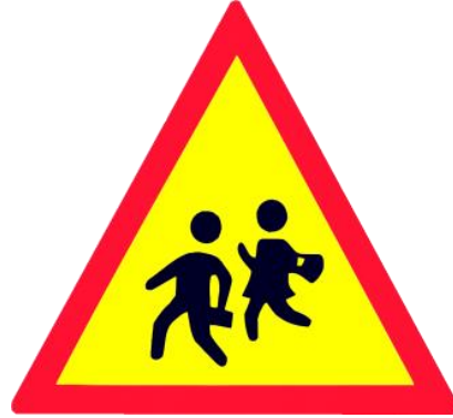
1. Trẻ em