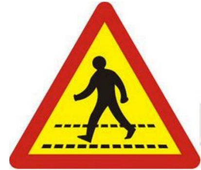
5. Người đi bộ cắt ngang