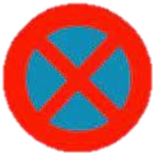
Cấm dừng và đỗ xe