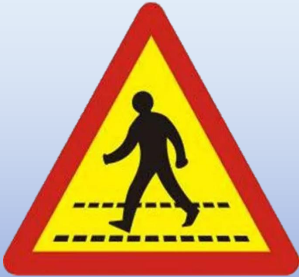
Đường người đi bộ cắt ngang