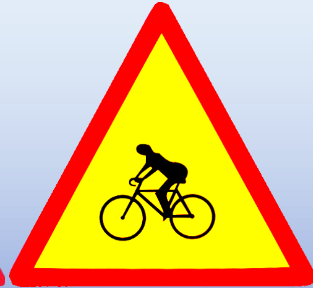
Người đi xe đạp cắt ngang

Biển báo nguy hiểm có hình dạng tam giác đều, viền đỏ, nền vàng, trên biển có hình vẽ màu đen nhằm mô tả sự việc muốn báo hiệu cho người đi đường biết trước tính chất của sự nguy hiểm.