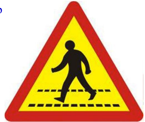
5. Người đi bộ cắt ngang