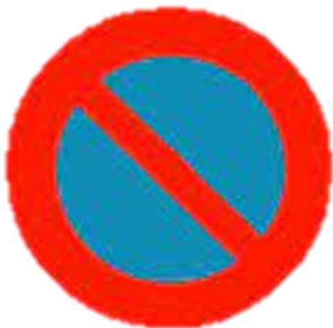
Cấm đỗ xe