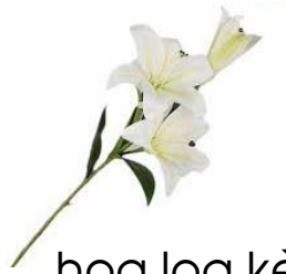
hoa loa kèn