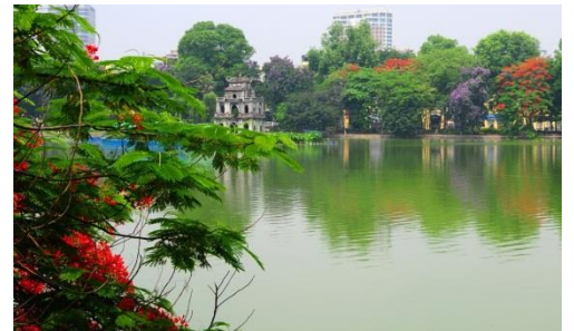
Hồ Hoàn Kiếm

5. Hãy tô màu xanh cho chữ ô (in hoa), màu đỏ cho chữ ô (in thường), màu vàng cho chữ ô (viết thường).