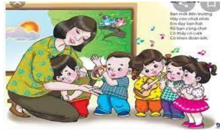
Bạn mới đến trường