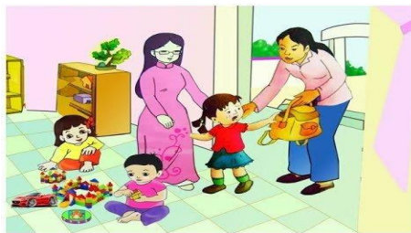
Bé Không khóc nữa

Câu 1: Theo các bé bài thơ có tên là gì?