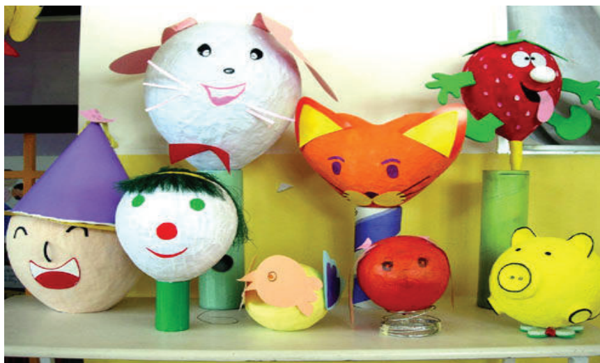
Những con rối có thể đứng được trên mặt giá để kích thích trẻ vào chơi trong góc