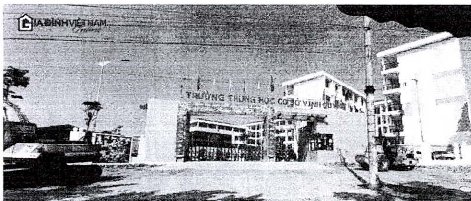
Hình ảnh Trường THCS Vĩnh Quỳnh (huyện Thanh Trì, TP. Hà Nội)